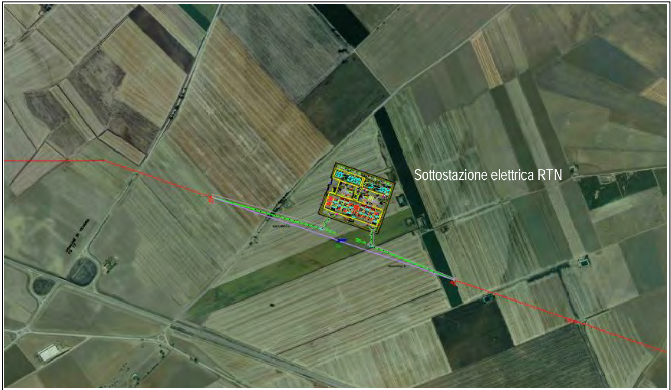
Fig.02: Veduta aerea di sedime della sottostazione elettrica utente di connessione alla RTN, da realizzare

Le coordinate geografiche del sito di ubicazione della sottostazione sono riportate in tabella 2: