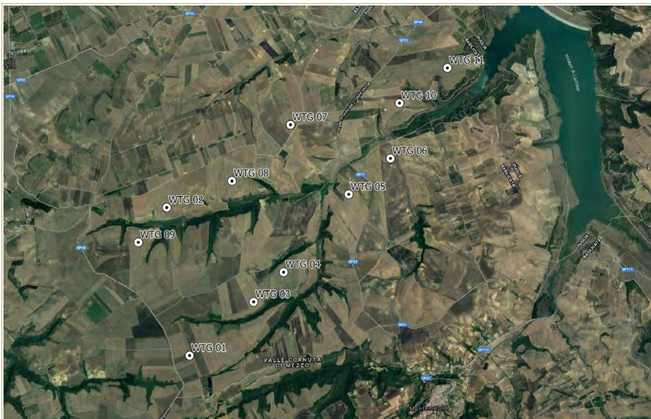
Fig.01: Veduta aerea con ubicazione dell'area parco

Le coordinate piane dei siti d'imposta degli aerogeneratori sono riportate nella tabella 1: