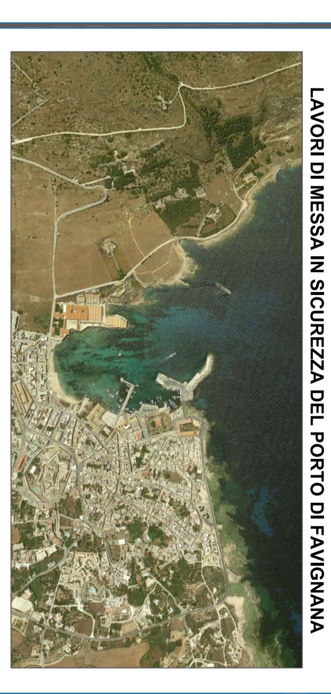
PROGETTO ESECUTIVO - 1° STRALCIO FUNZIONALE

Isole Egadi Comune di Favignana Provincia Regionale di Trapani