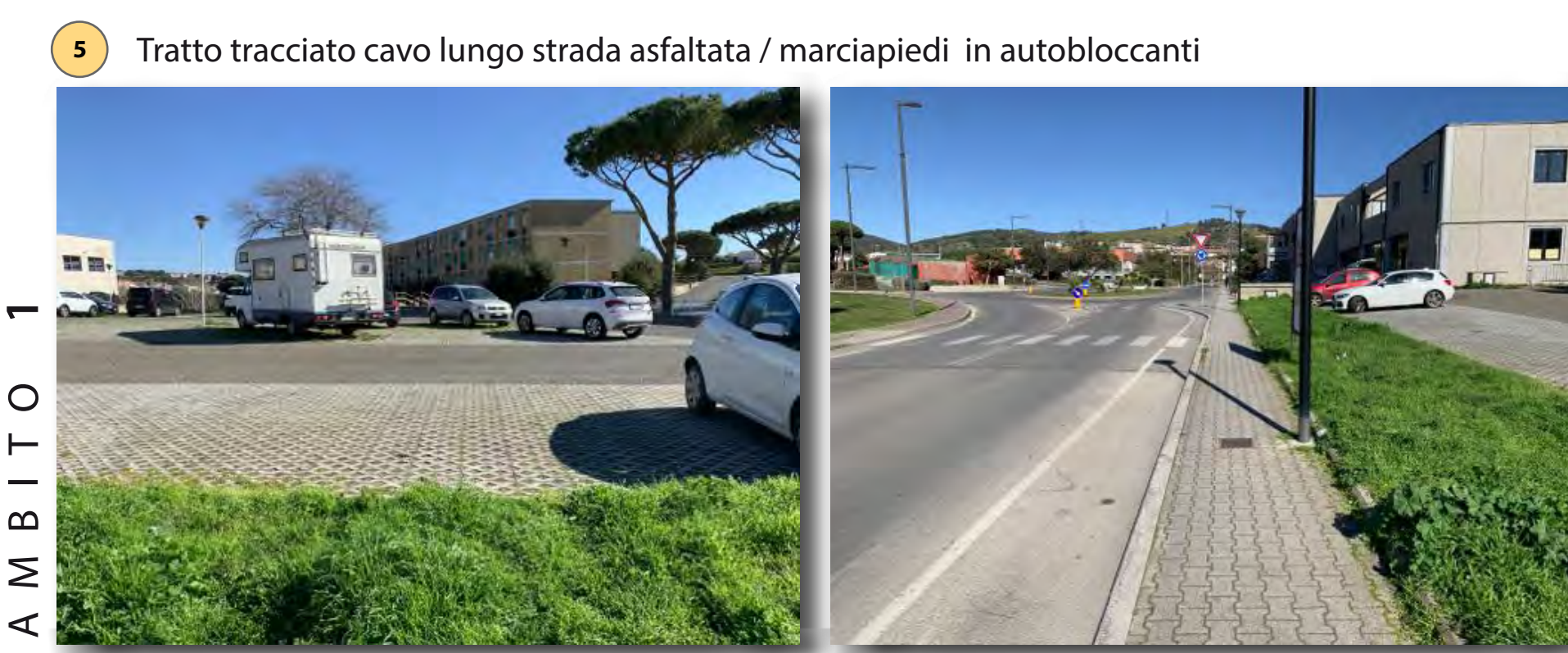
Interventi: ripristino manto stradale e ripristino ambientale tipo D