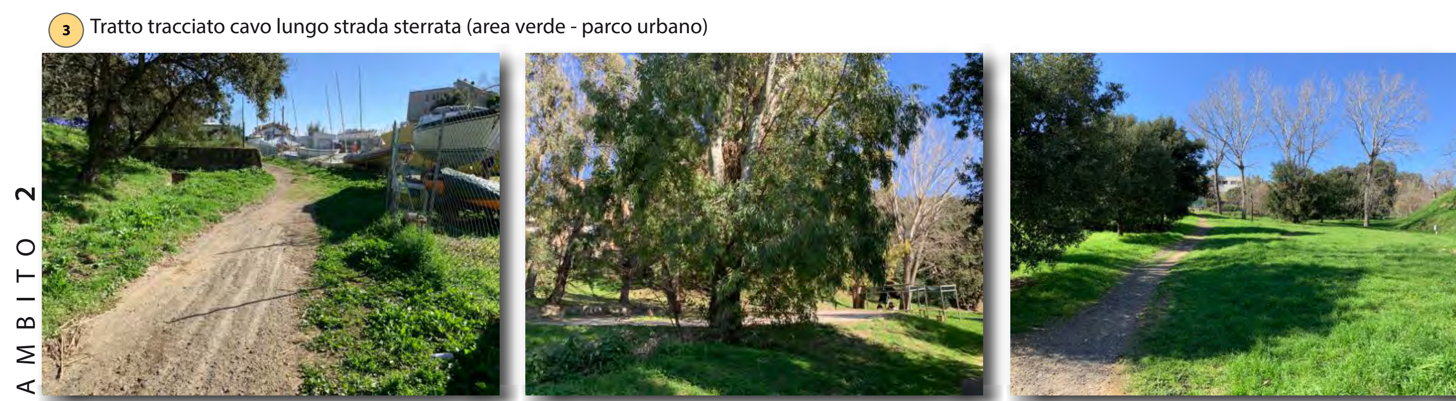
Interventi: ripristino sede stradale e ripristino ambientale tipo A