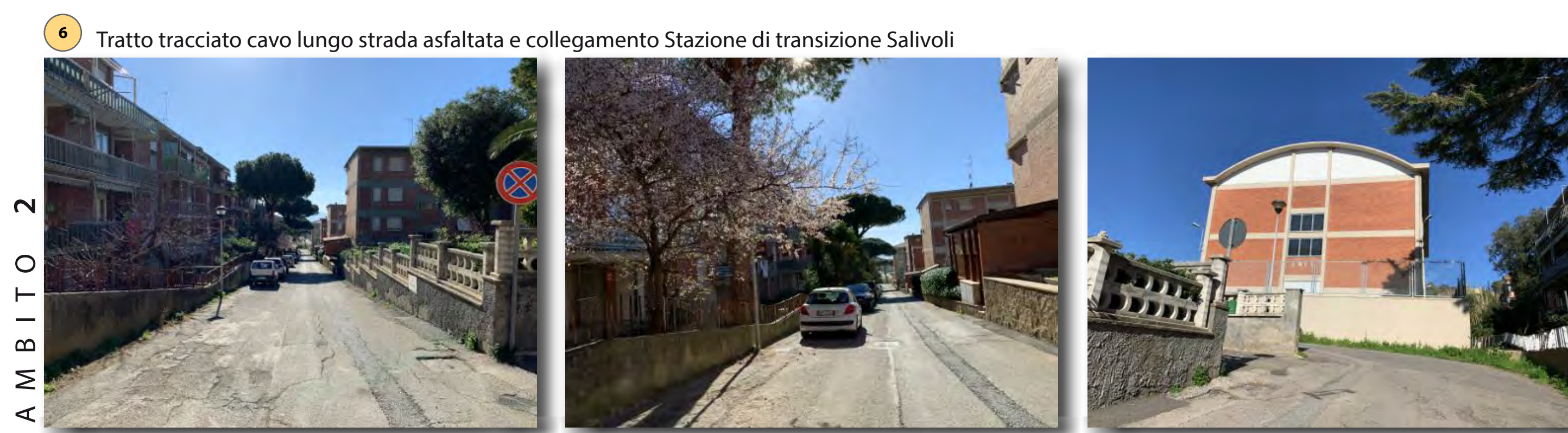
Interventi: ripristino manto stradale e interventi di ripristino ambientale tipo D