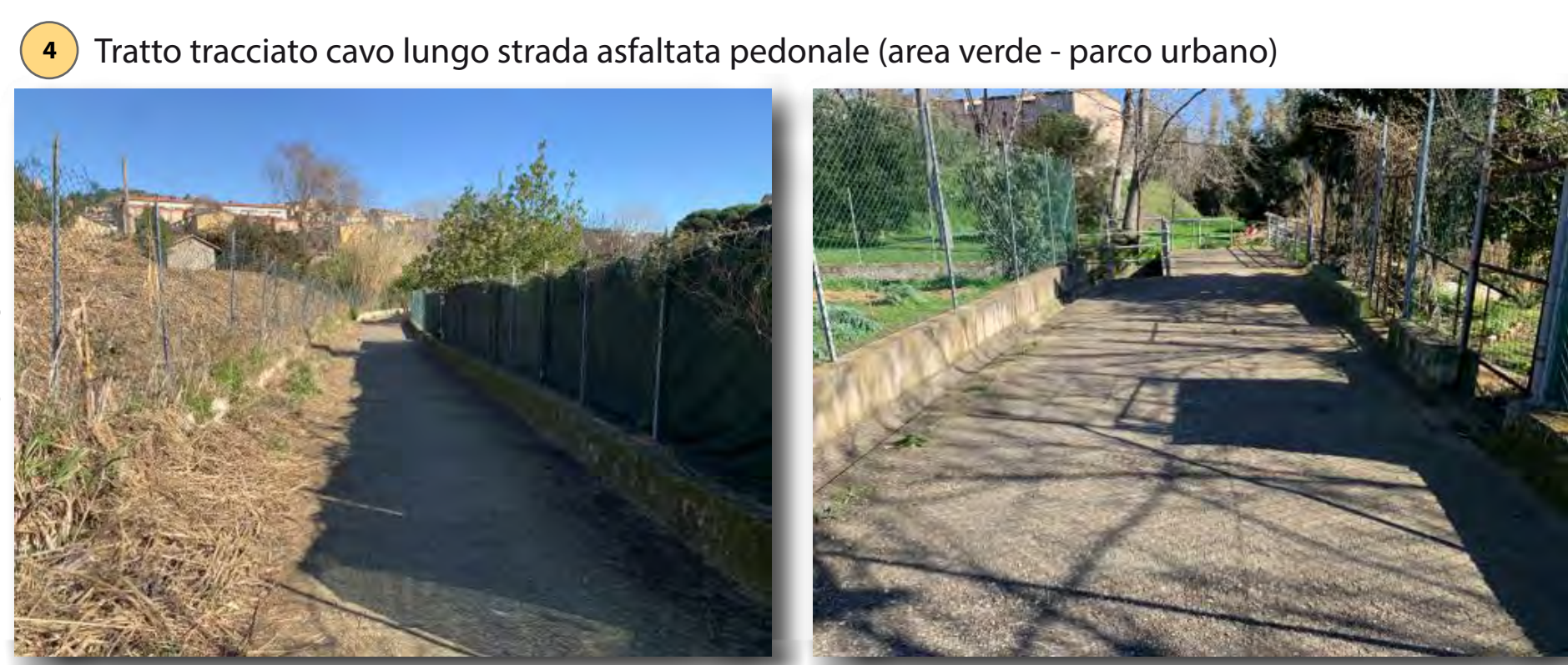
Interventi: ripristino camminamento e ripristino ambientale tipo C