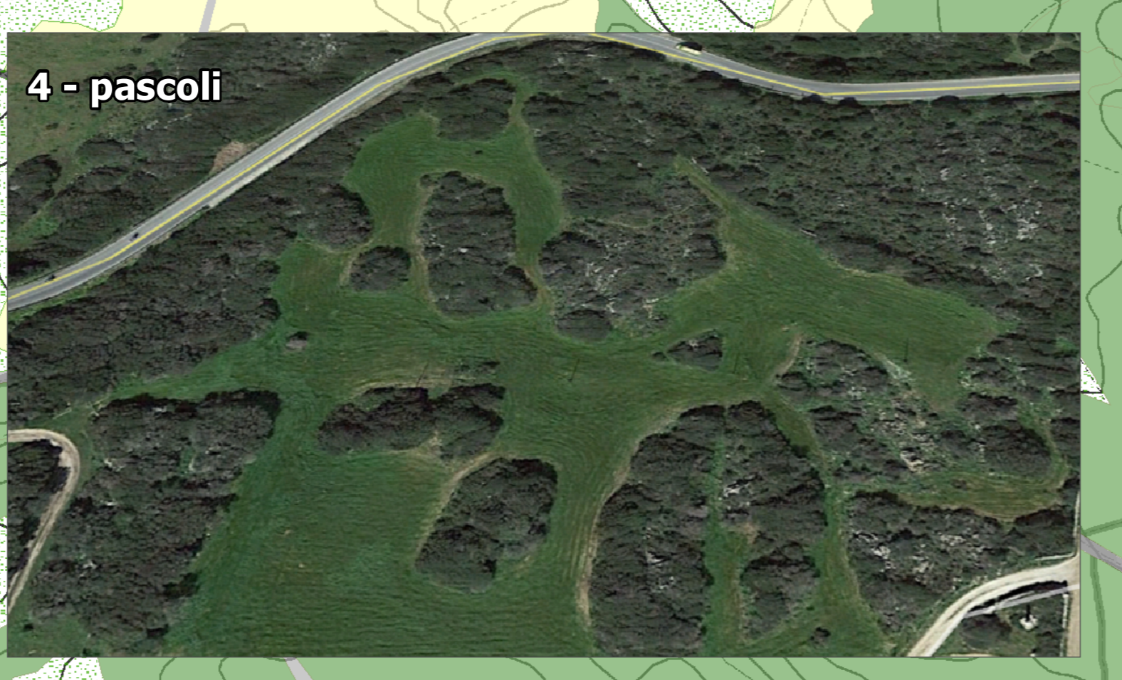
4 - pascoli