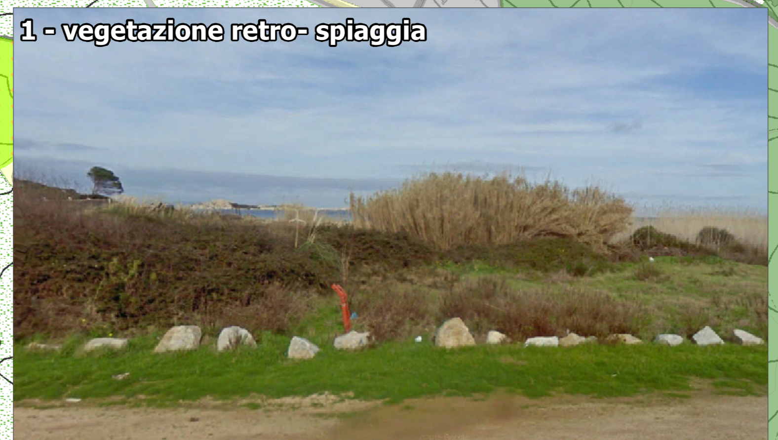
1 - vegetazione retro- spiaggia