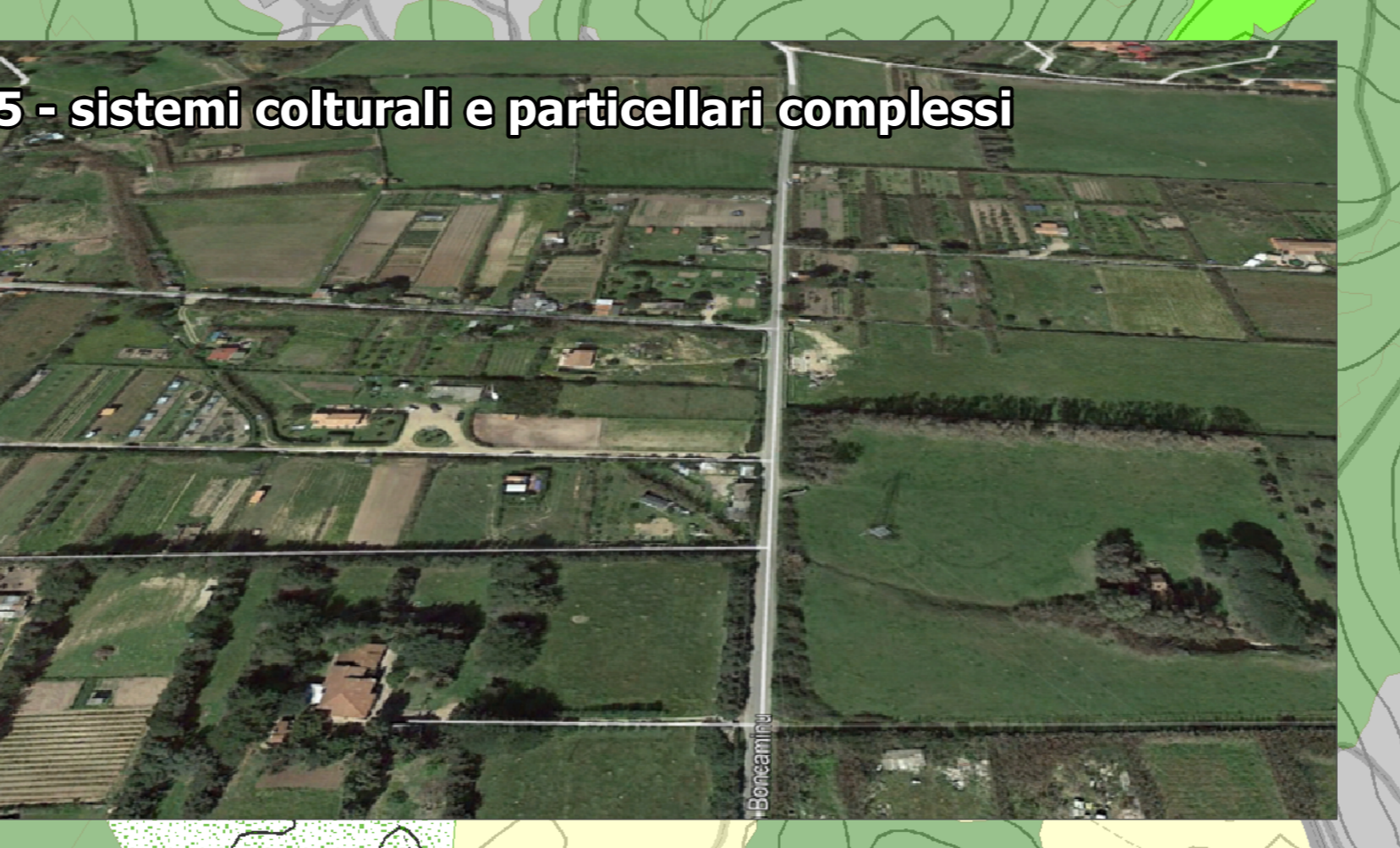
5 - sistemi colturali e particellari complessi