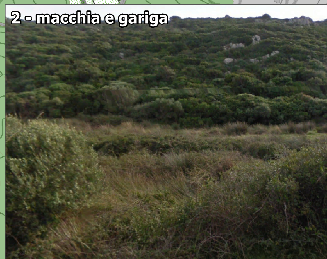
2 - macchia e gariga