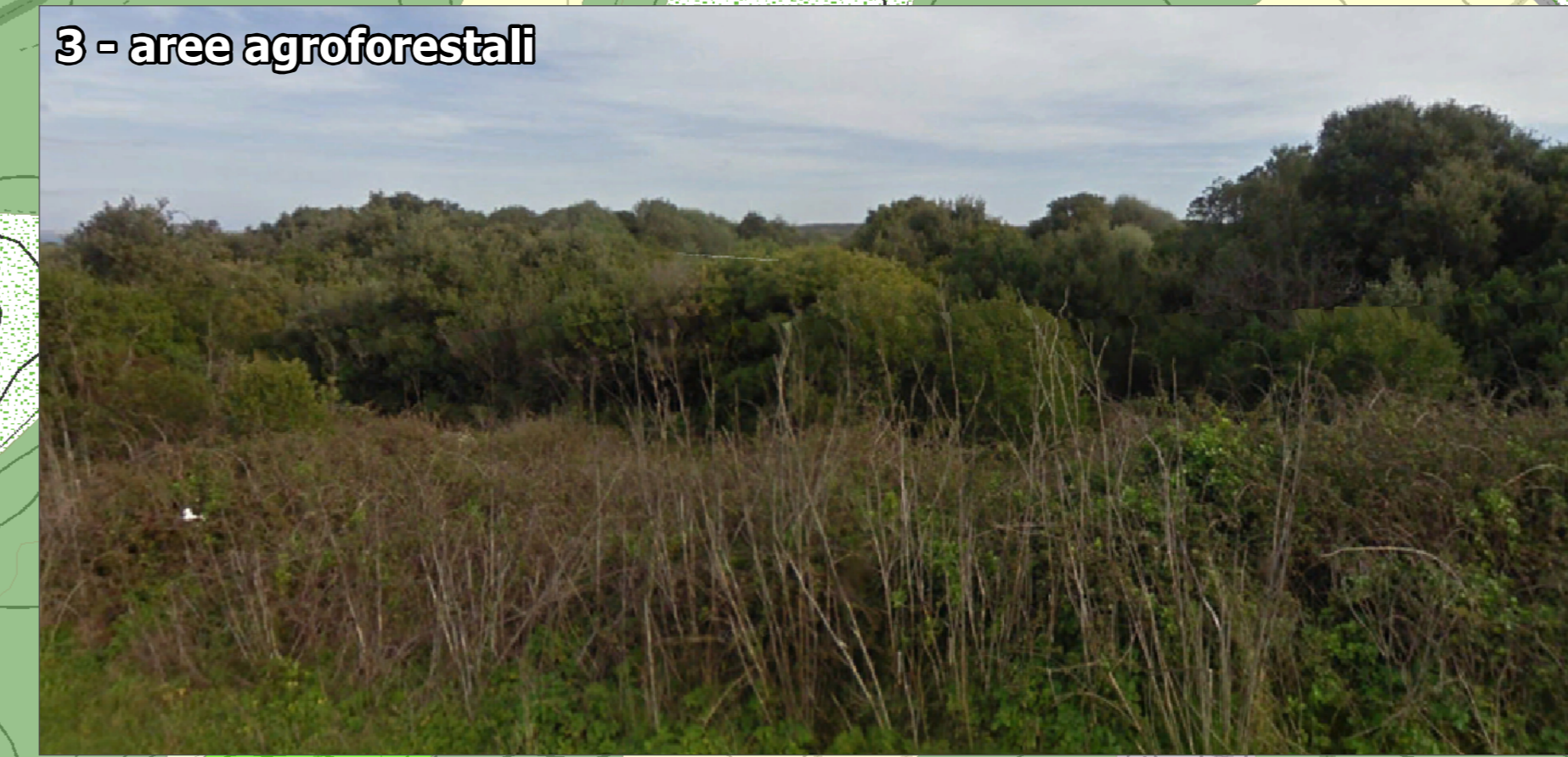
3 - aree agroforestali