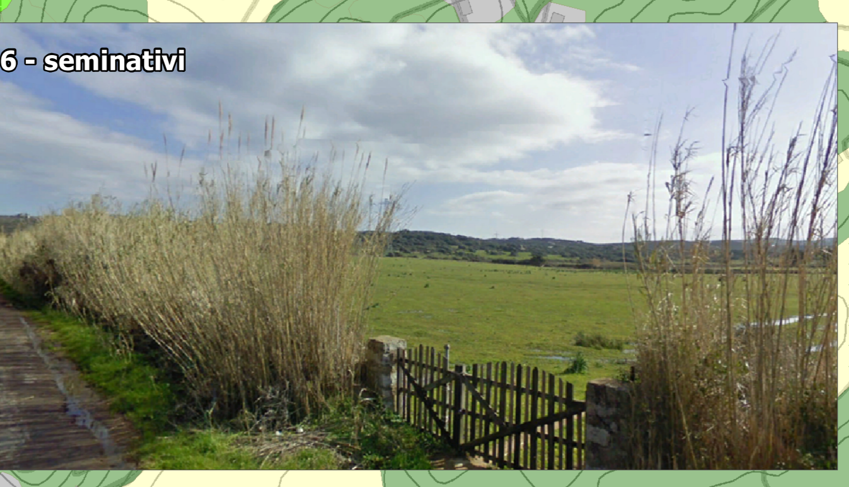
6 - seminativi