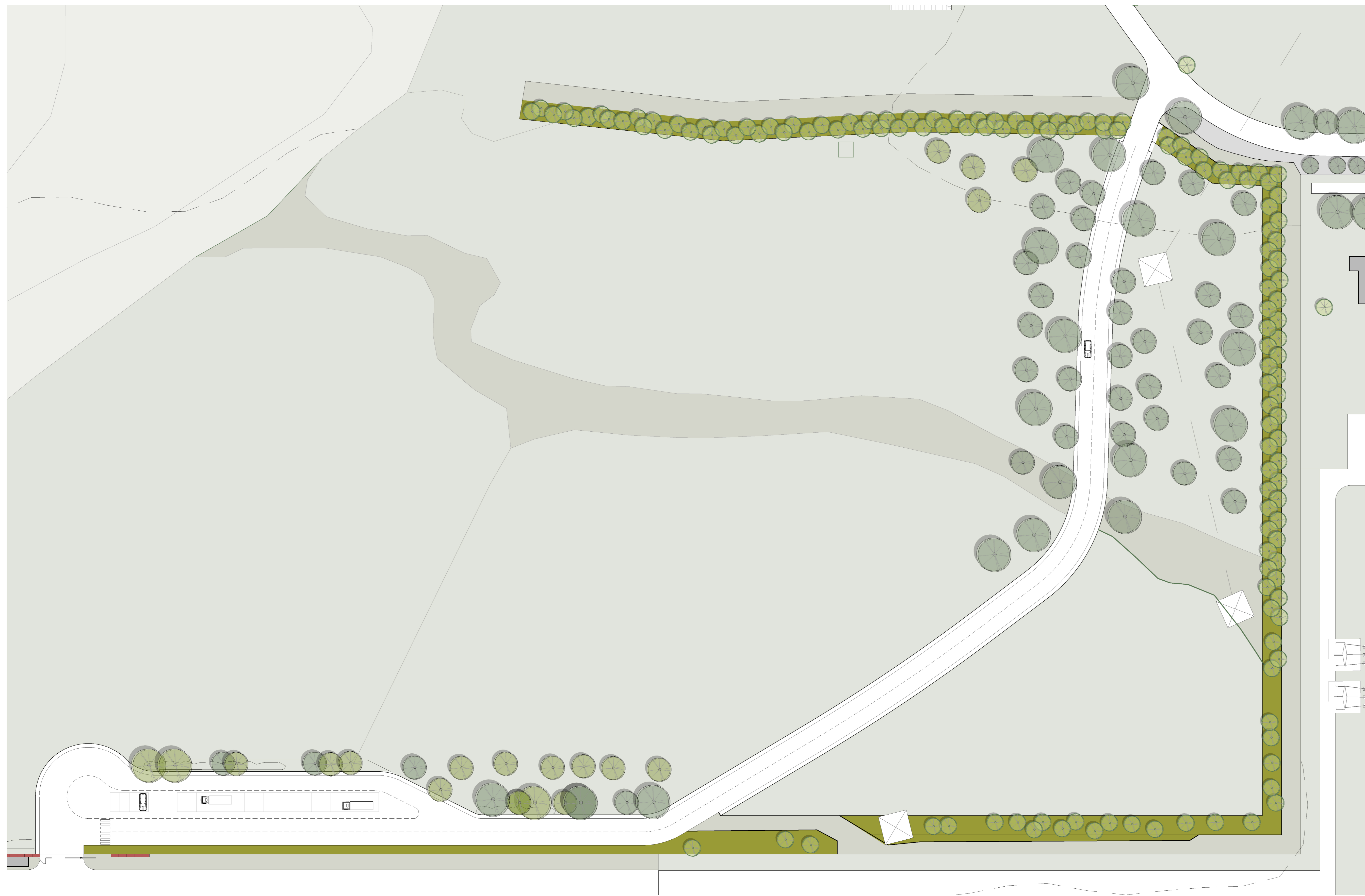
PIANTA | SCALA 1:500