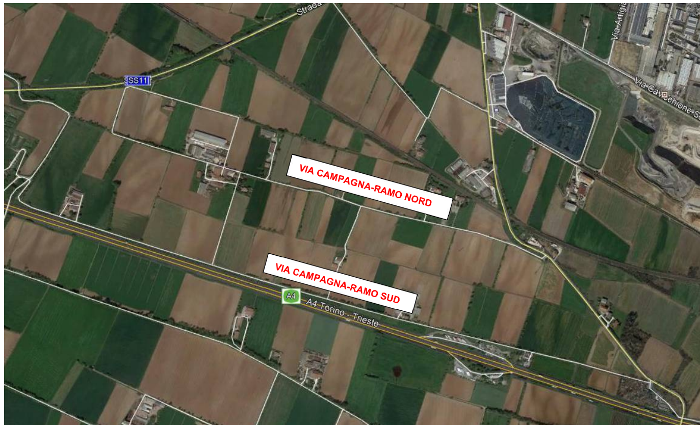
Planimetria di inquadramento ante operam

Entrambi i rami della viabilità esistente presentano una larghezza media della carreggiata di circa 3.5m, con pavimentazione in conglomerato bituminoso, sono privi di segnaletica orizzontale e verticale, e sono utilizzati principalmente per l'accesso ad alcune cascate esistenti ubicate tra l'Autostrada A4 e la linea storica Milano-Venezia.