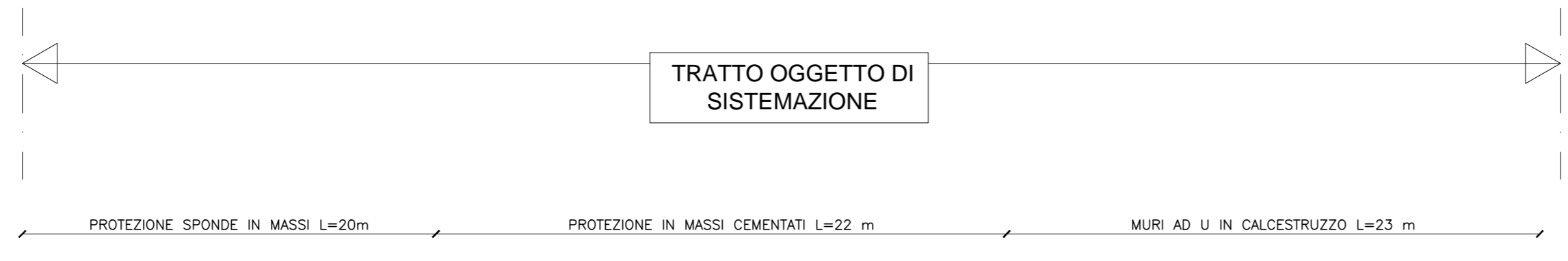
SISTEMAZIONE IDRAULICA DEL FONDO: PROFILO LONGITUDINALE

LEGENDA S 30 Linea di sezione trasversale e codice sezione Tratto di muro oggetto di intervento