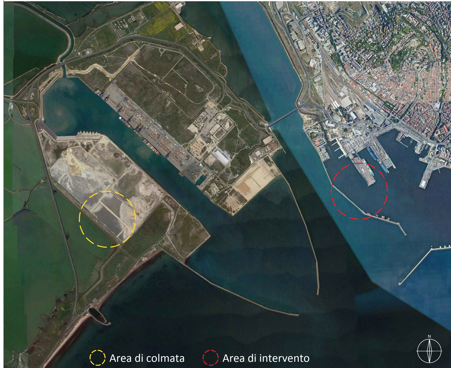
Key - Map: indicazione aree di colmata e e area di intervento