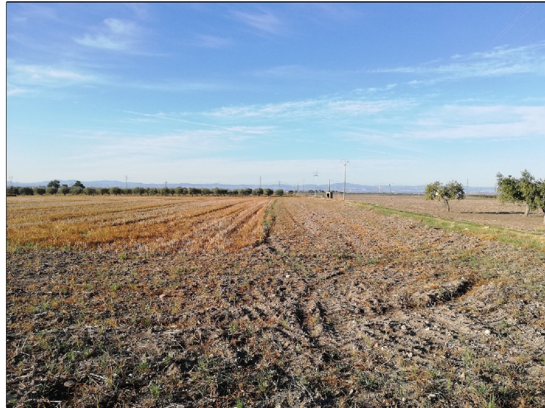
VISTA 1: STATO DI FATTO

Il presente disegno e' di proprieta' aziendale - La Societa' tutelera' i propri diritti a termine di legge.