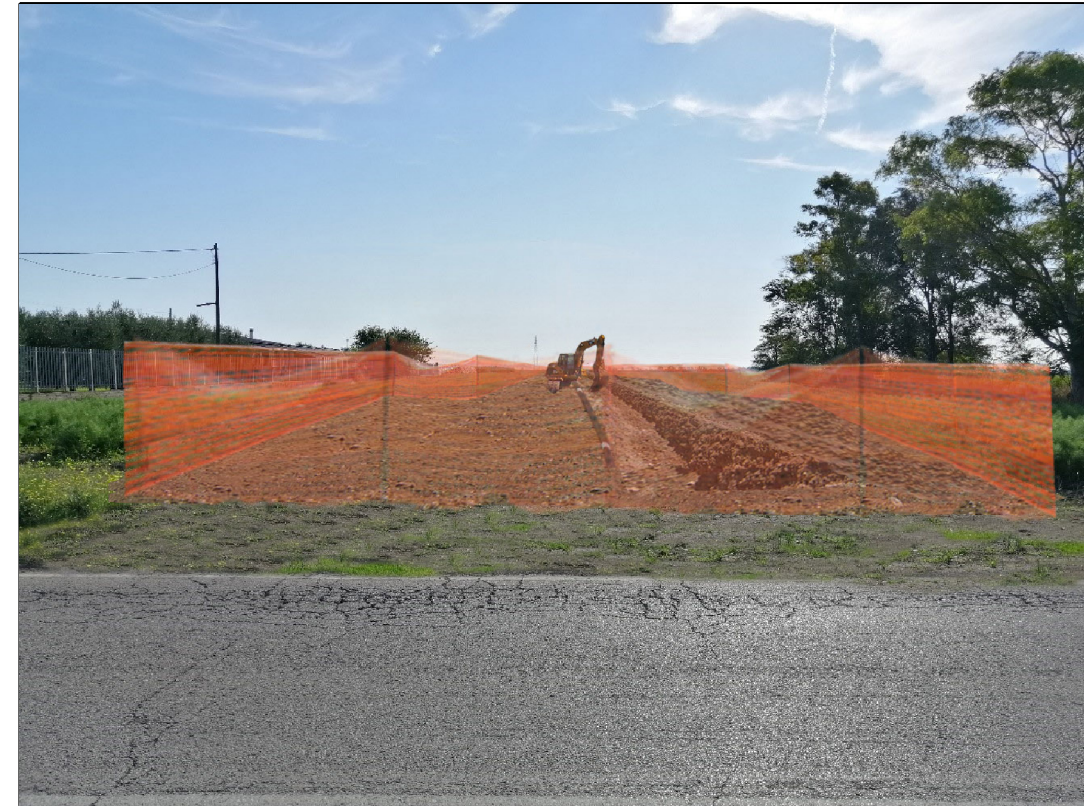
VISTA 2: STATO DI PROGETTO