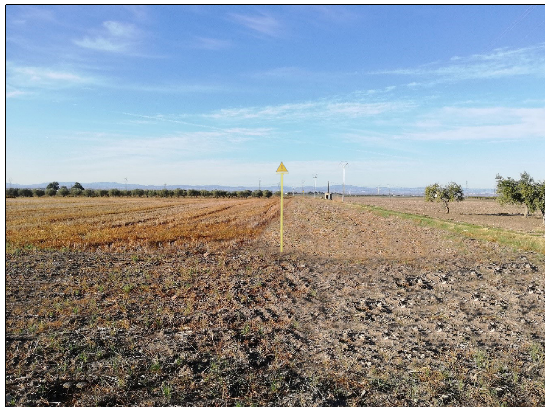
VISTA 3: STATO DI PROGETTO CON MASCHERAMENTO