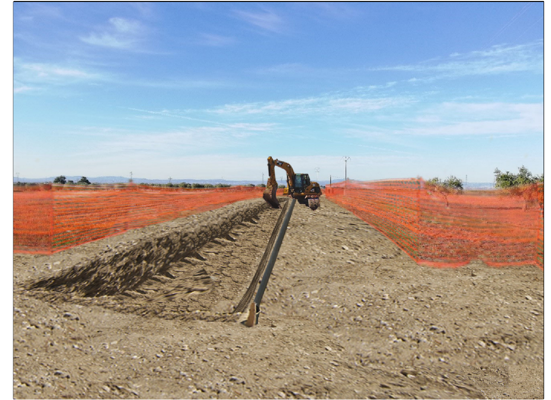
VISTA 2: STATO DI PROGETTO