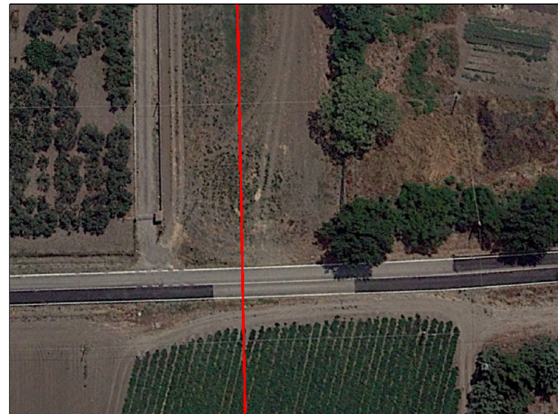
VISTA 4: FOTO AEREA CON EVIDENZIATA L'AREA DI INTERVENTO