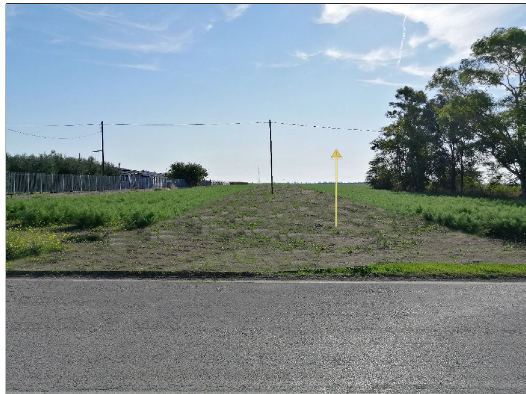
VISTA 3: STATO DI PROGETTO CON MASCHERAMENTO