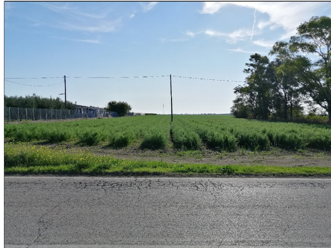
VISTA 1: STATO DI FATTO

Il presente disegno e' di proprieta' aziendale - La Societa' tutelera' i propri diritti a termine di legge.