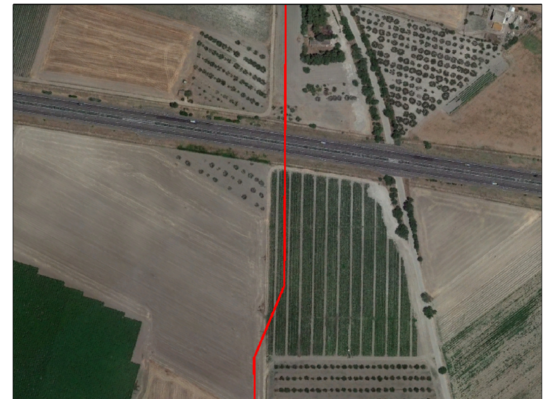
VISTA 4: FOTO AEREA CON EVIDENZIATA L'AREA DI INTERVENTO