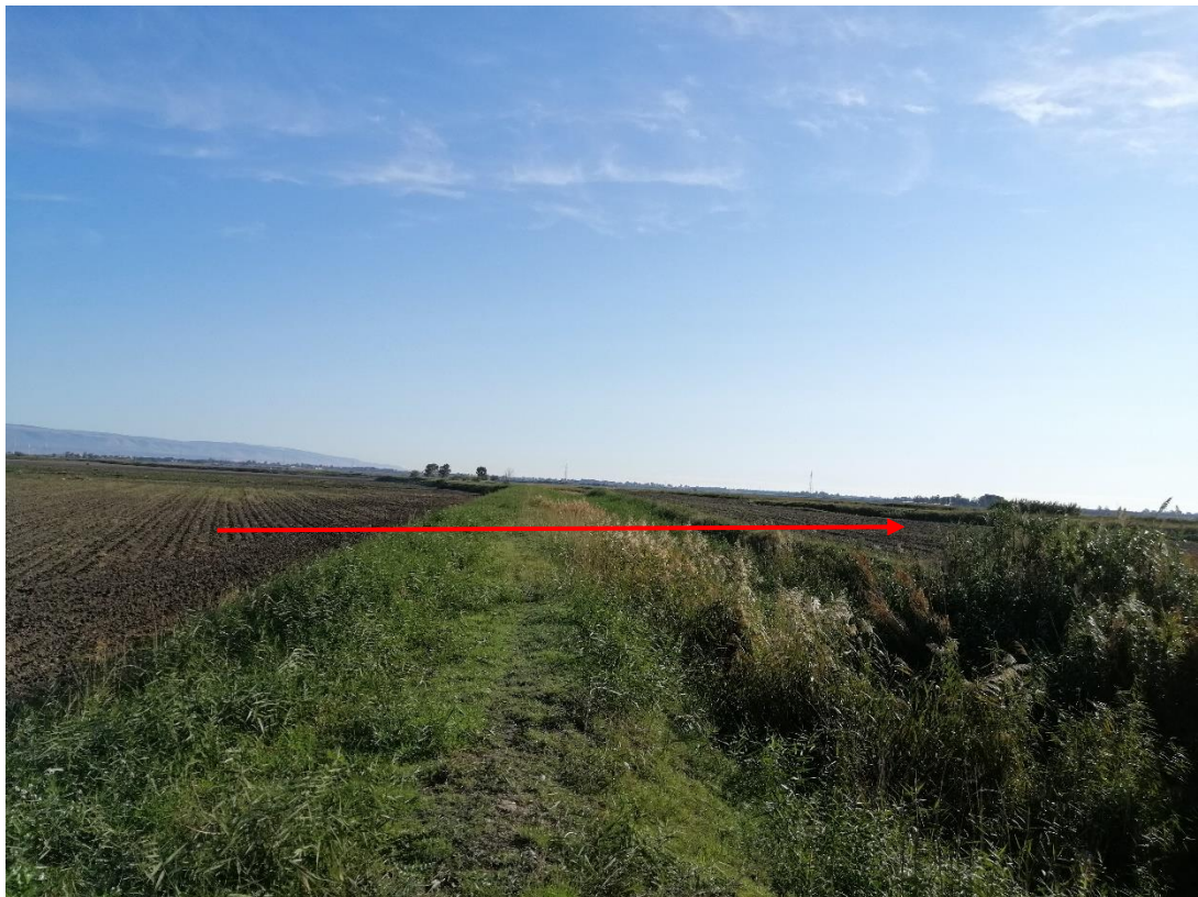
Fig. 5-2 – Il Torrente Celone nei pressi dell'interferenza con il metanodotto in progetto Bretella 1 (in rosso il tracciato del metanodotto).

Il Celone è un torrente del foggiano, lungo circa 70 km. Ha origine dal monte San Vito, costeggia le falde meridionali del monte Cornacchia (la vetta più alta della Puglia), per poi percorrere la valle compresa tra Celle di San Vito e Castelluccio Valmaggiore. Attraversa il Tavoliere delle Puglie poco a nord di Foggia e sfocia infine nel Torrente Candelaro presso San Marco in Lamis.