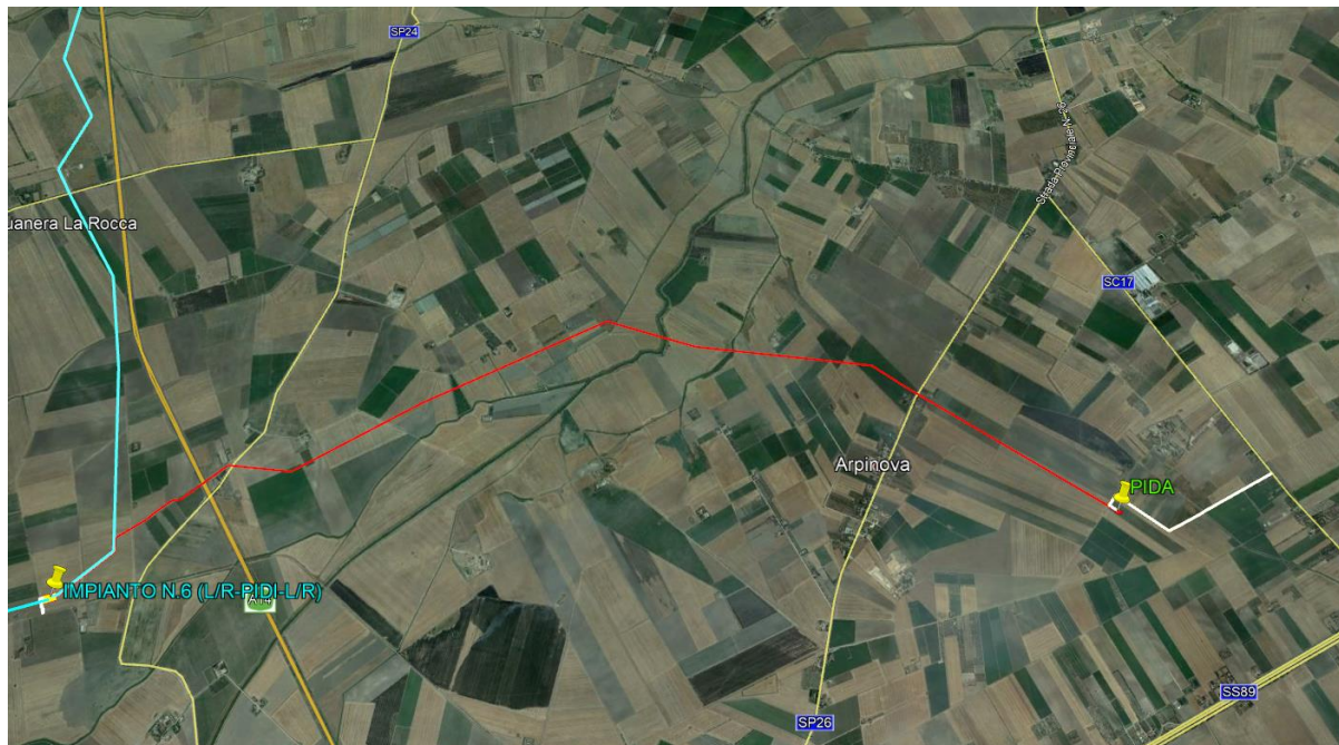
Fig. 2-1 – Inquadramento geografico dell'opera in progetto (tratto rosso)