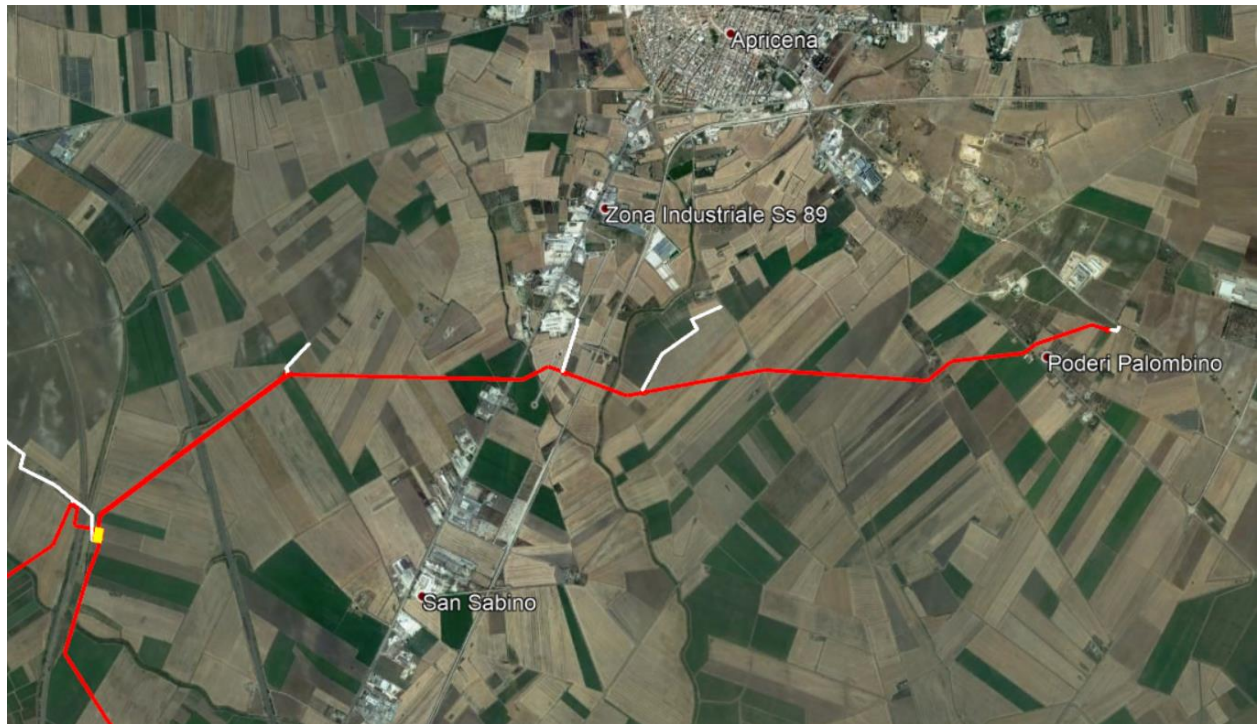
Fig. 2-1 – Inquadramento geografico dell'opera in progetto (tratto rosso)