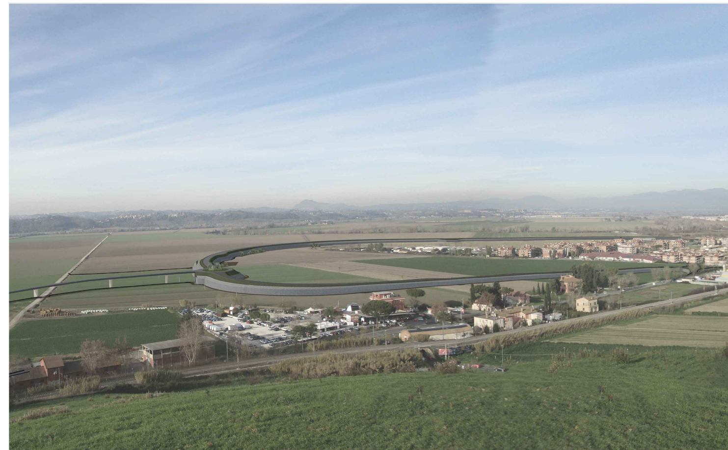
1 - POST OPERAM (con mitigazioni)