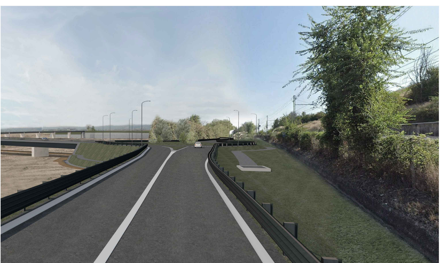
3 - POST OPERAM (con mitigazioni)