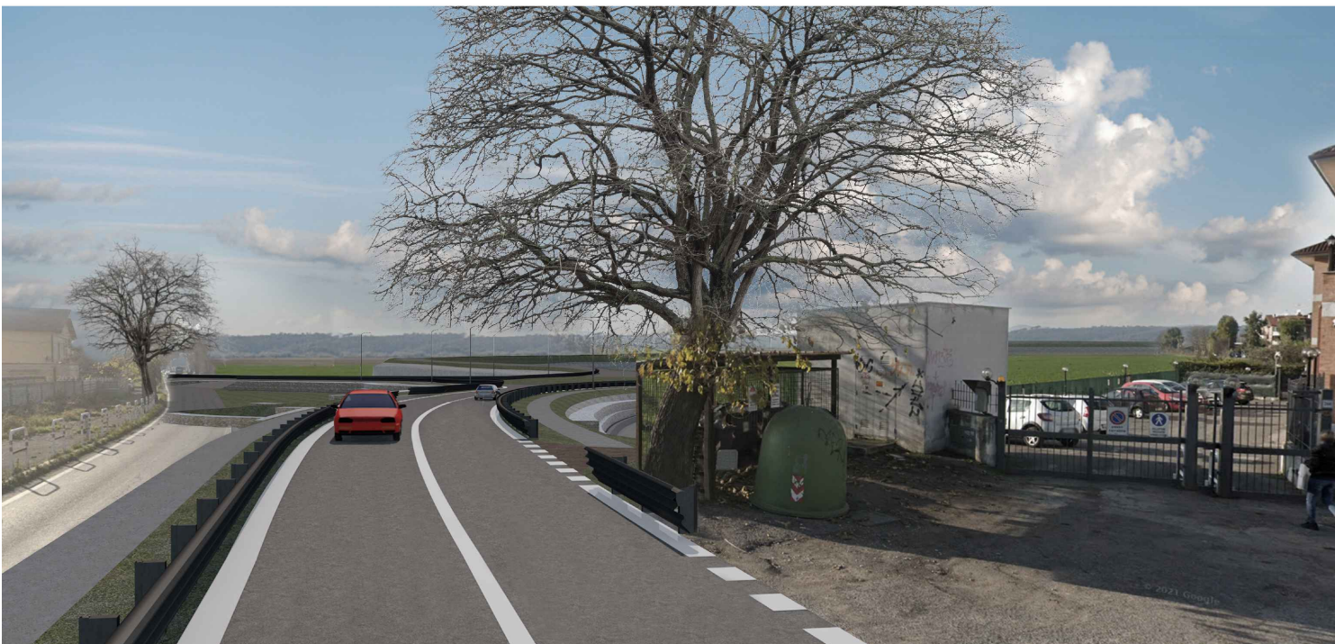
2 - POST OPERAM