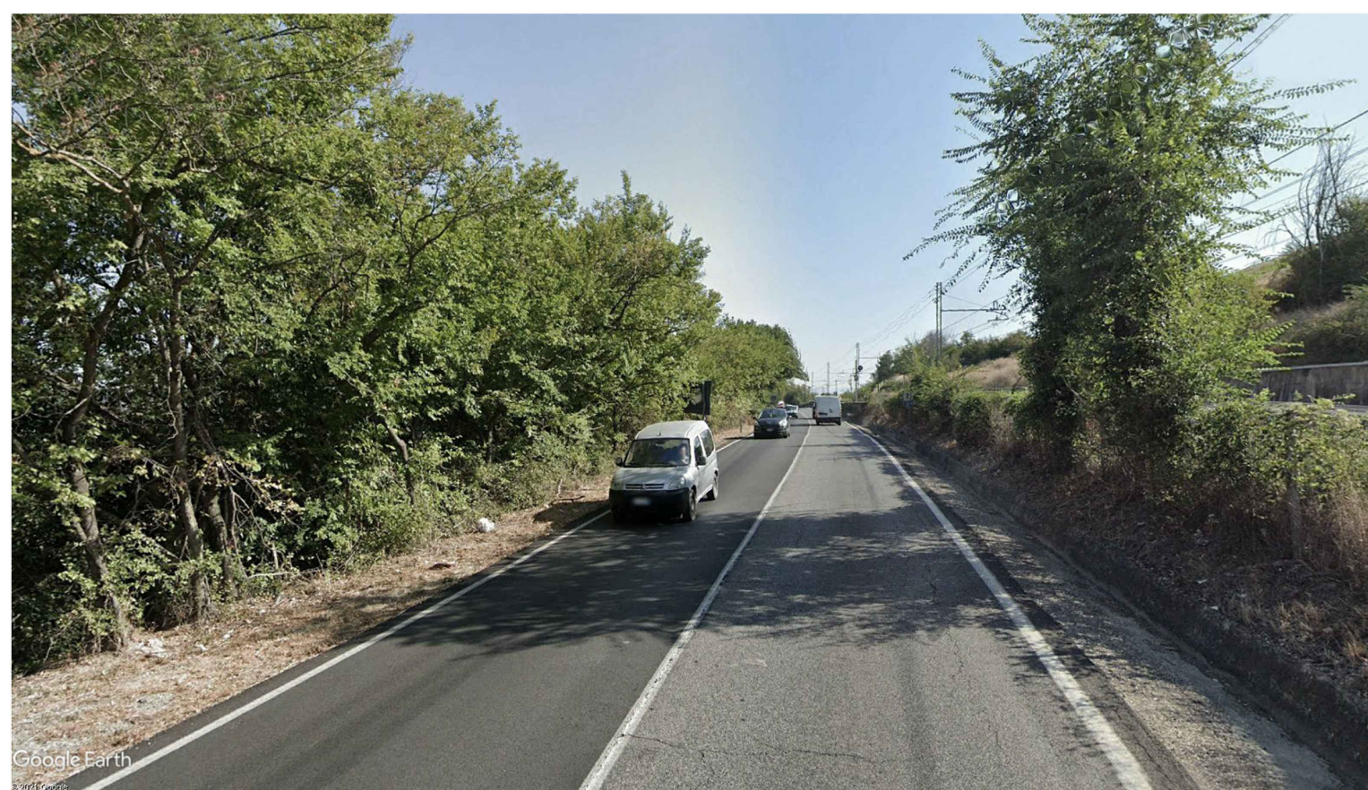
3 - ANTE OPERAM