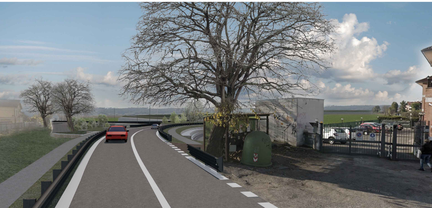
2 - POST OPERAM (con mitigazioni)