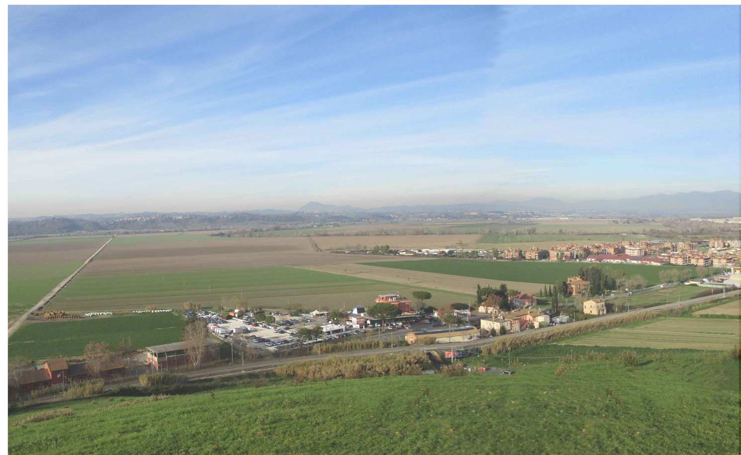
1 - ANTE OPERAM