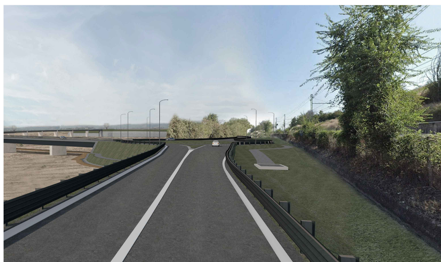
3 - POST OPERAM