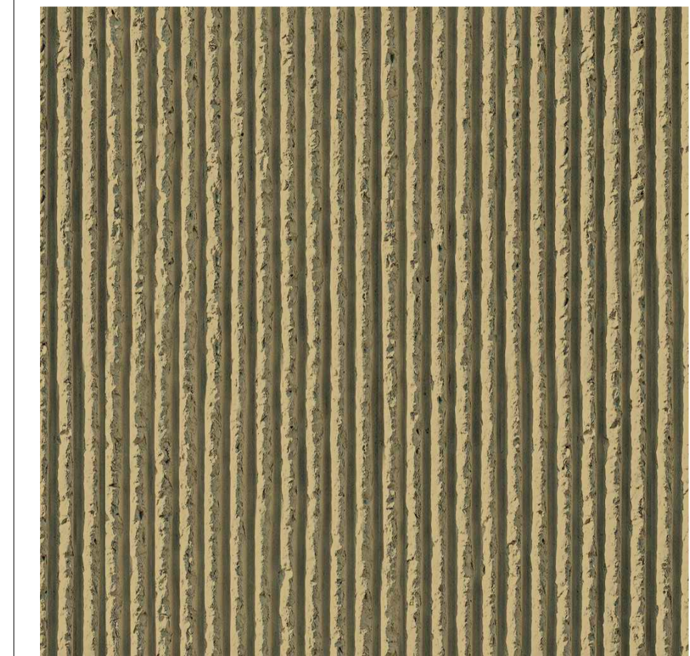
PARTICOLARE PANNELLO DI RIVESTIMENTO LATO RICETTORI