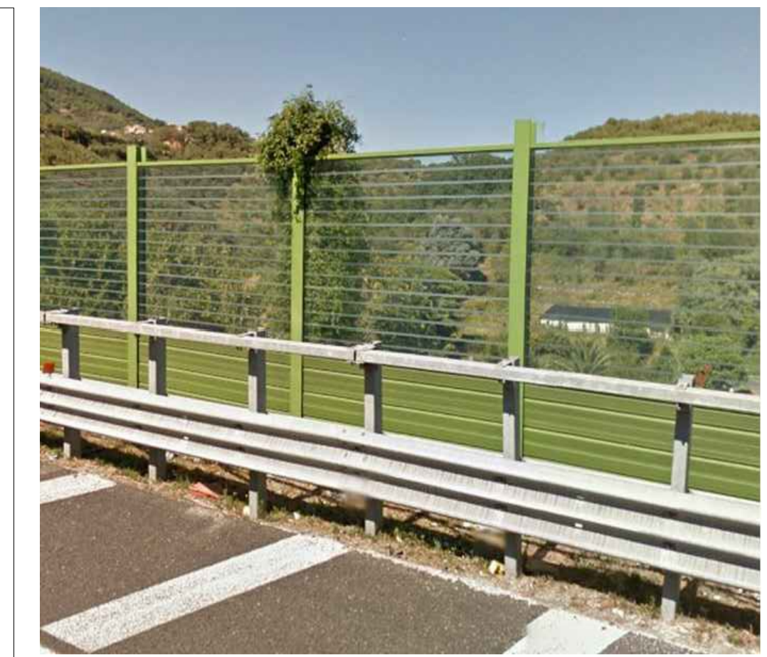
BARRIERA CON PANNELLI IN PMMA CON TRATTAMENTO ANTICOLLISIONE MEDIANTE ABRASIONE SUPERFICIALE