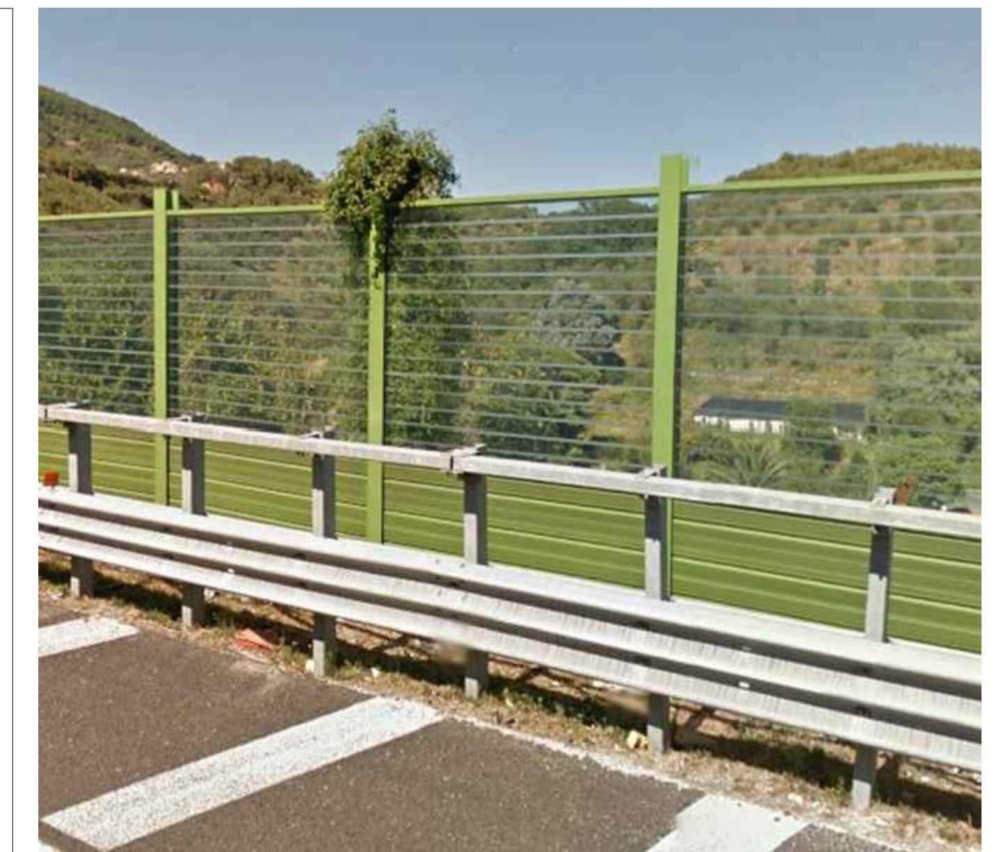
BARRIERA CON PANNELLI IN PMMA CON TRATTAMENTO ANTICOLLISIONE MEDIANTE ABRASIONE SUPERFICIALE