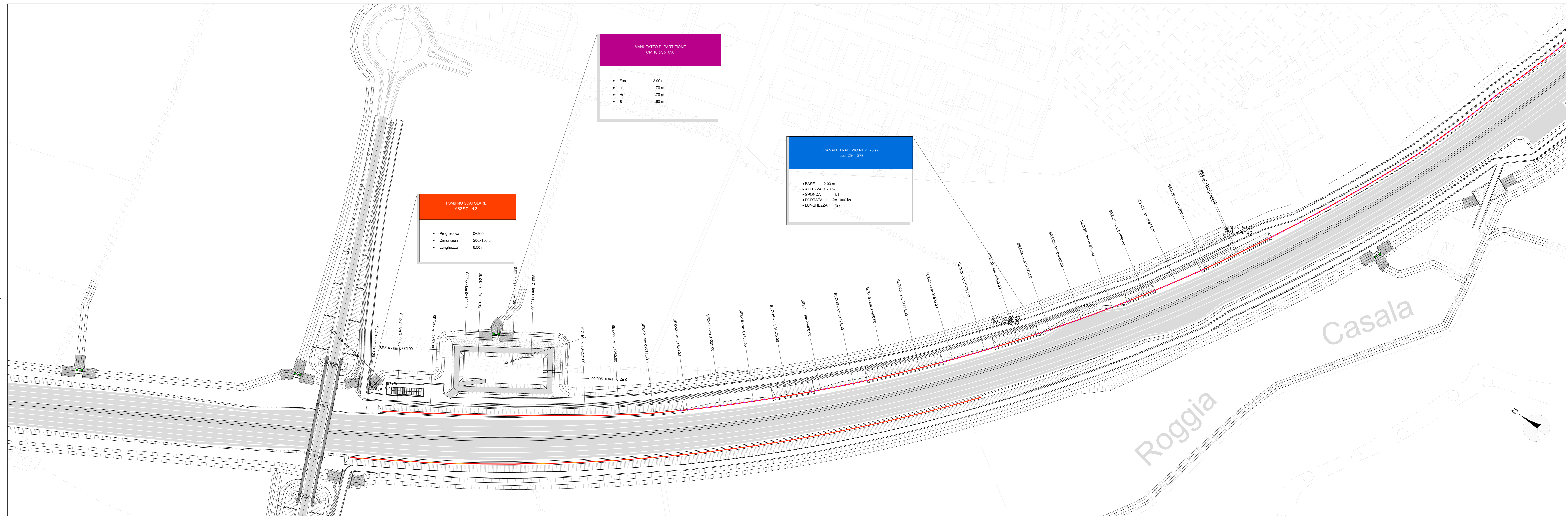
PROFLO CANALE SX N°25 SCALA 1:1.000/100