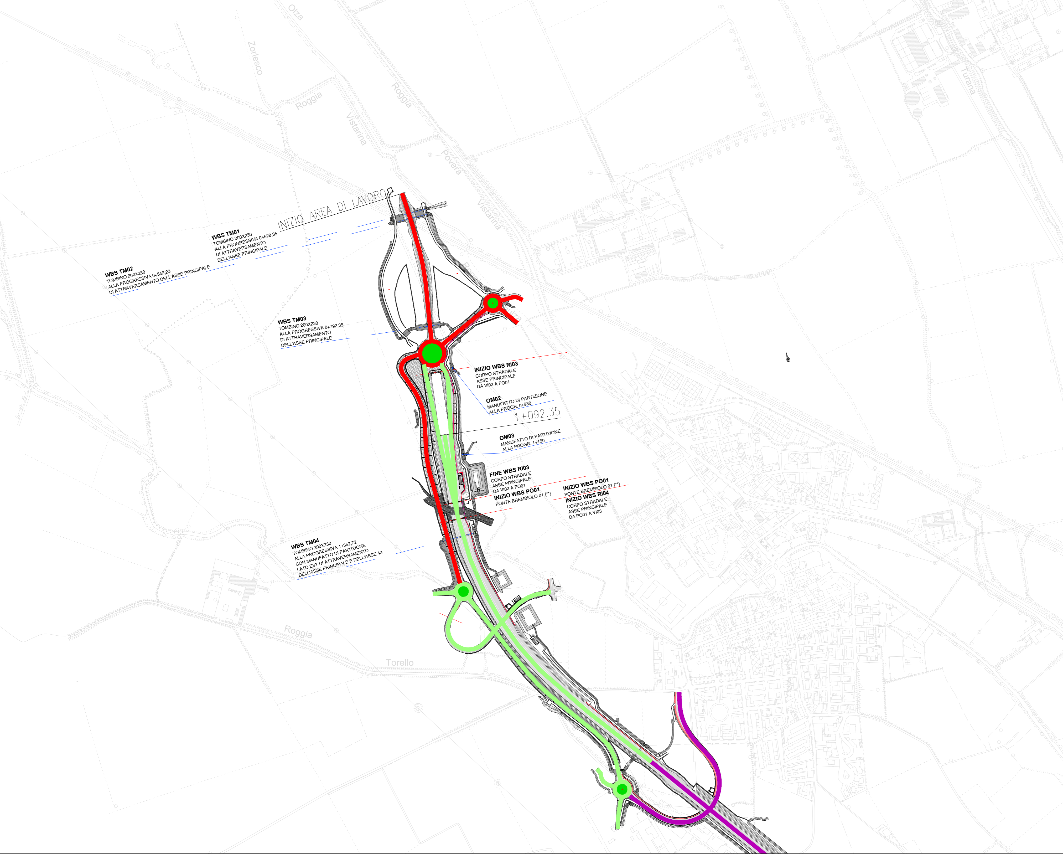
WBS ASSE PRINCIPALE - FASE ESECUTIVA 1

NB La colorazione assi segue quella delle AREE DI LAVORO indicata in legenda. Le lavorazioni incluse nella WBS sono esplicitate in etichetta