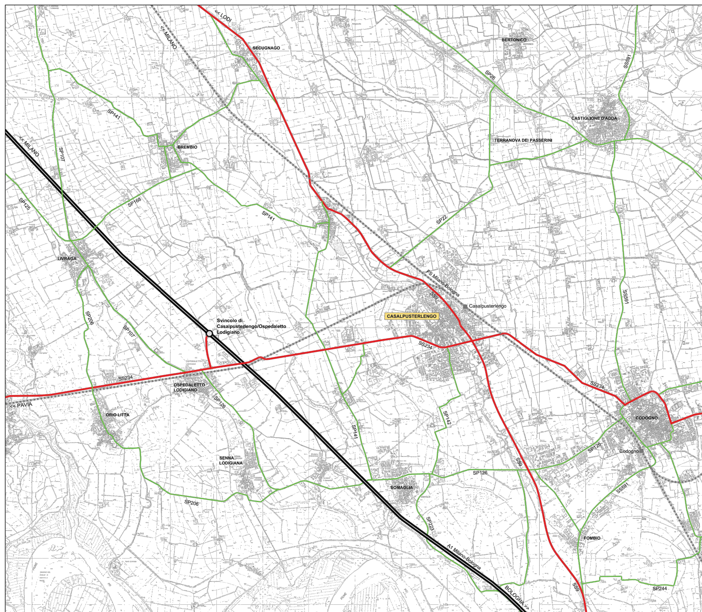
LEGENDA AUTOSTRADA E SVINCOLI STRADE PRINCIPALI STRADE SECONDARIE LINEE E STAZIONI FERROVIARIE FIGURA 1 INQUADRAMENTO DELLA RETE DI TRASPORTO STATO DI FATTO