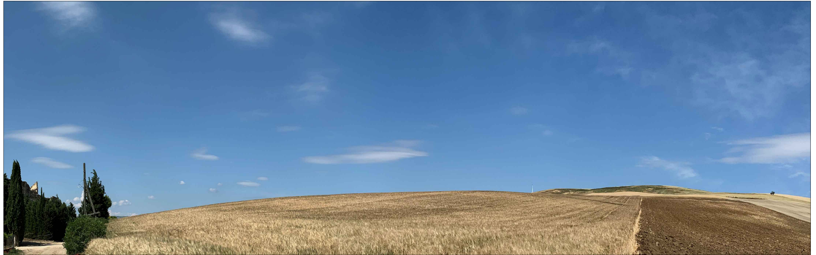
PUNTO 1: MASSERIA VERDEROSA - REGIO TRATTURELLO PALMIRA-MONTESERICO-CANOSA - Post operam