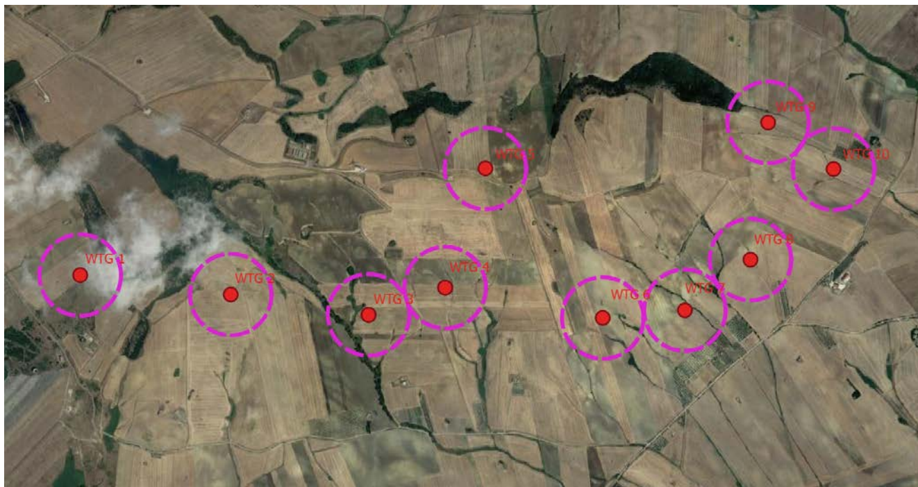
Figura 1 – Layout di progetto con indicazione della gittata massima della pala in caso di distacco

Nota la posizione di quest'ultimo, date le caratteristiche geometriche della pala, si è calcolato il punto in cui cadrà il vertice della pala stessa, ovvero nella situazione peggiore il vertice della pala cadrà ad una distanza massima dall'asse della turbina pari a 218.05 m .