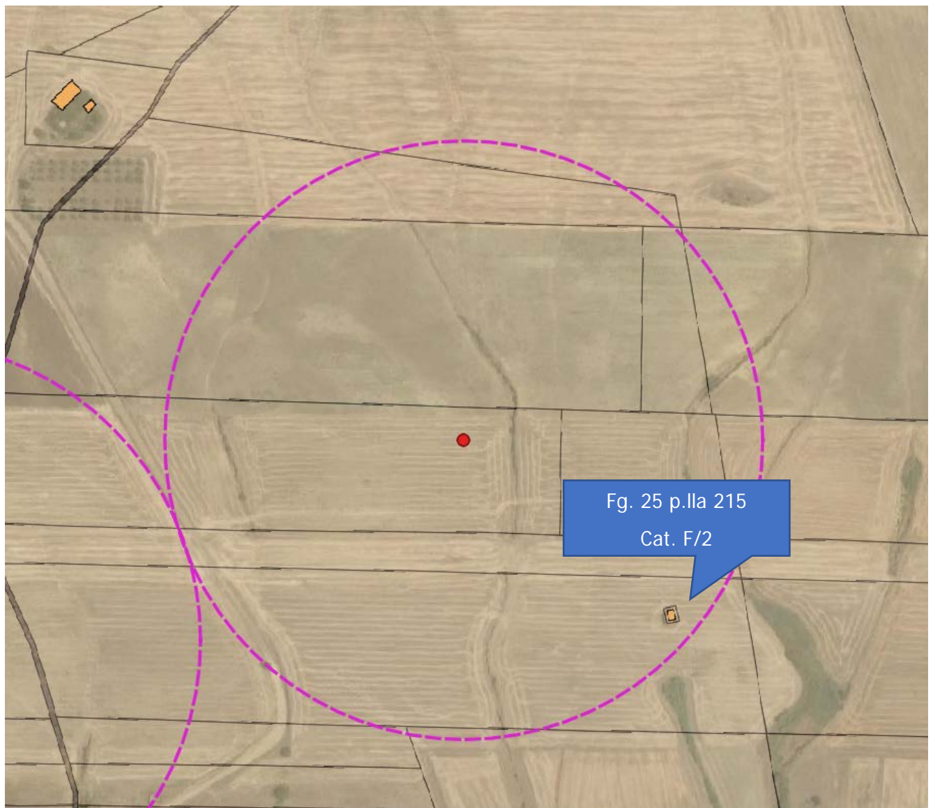
Figure 2 Particolare WTG4

Difatti l'unico immobile censito catastalmente presente nell'area di interesse è ubicato in prossimità della WTG4.