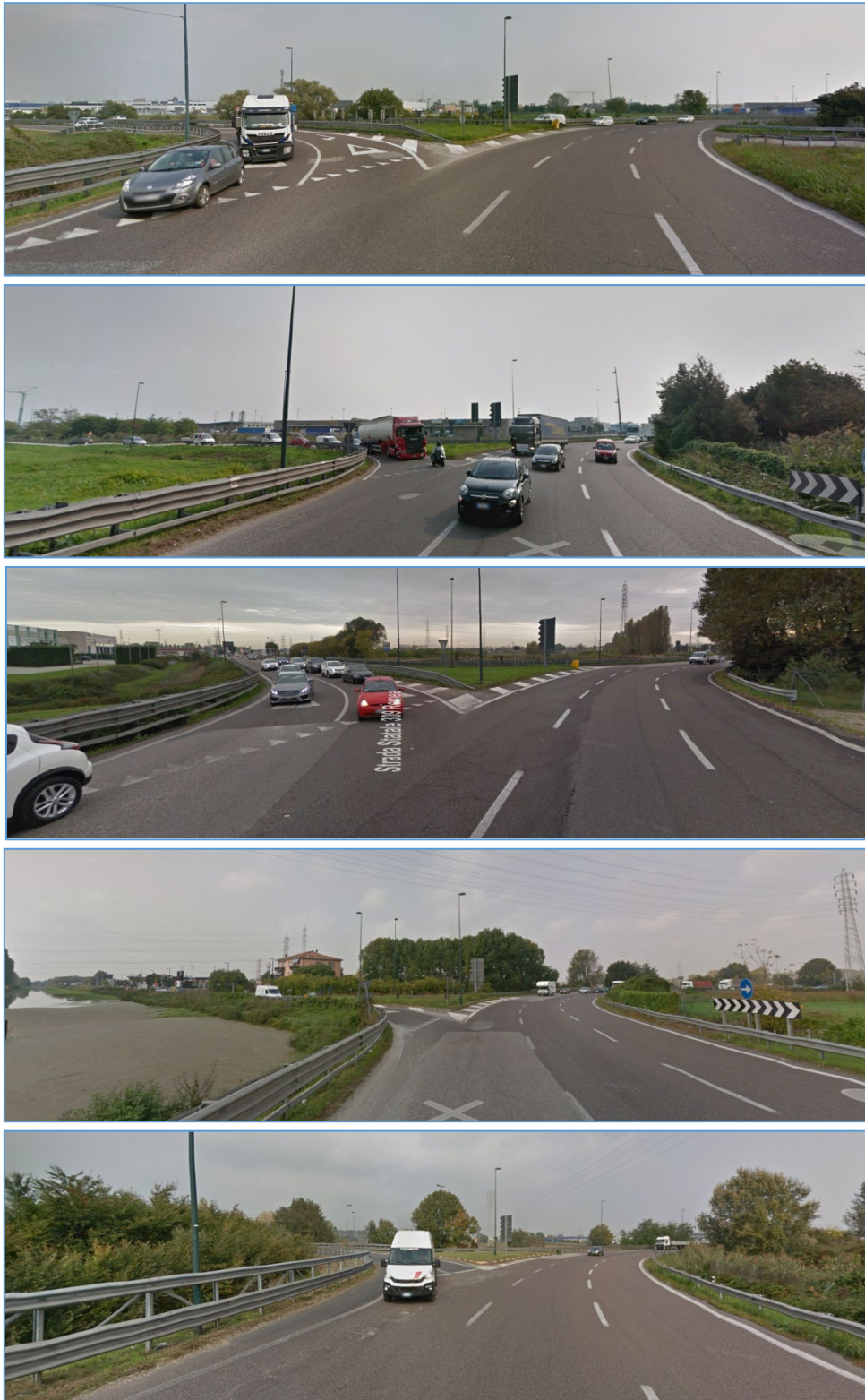
Figura2.5: Rami in ingresso nella rotatoria collocata all'intersezione di SS309, SR11 ed SP81 (nell'ordine: SS309 proveniente da nord, SR11 proveniente da est, SS309 proveniente da sud, SR11 proveniente da ovest, SP 81)

Capitale Sociale Euro 1.500.000,00 i.v. – Partita IVA / Cod.fiscale 04452700273