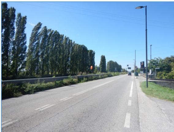
Figura 2.9: SR11, tratto ad ovest della rotonda presso Canale Industriale Ovest

SR11, tratto ad ovest della rotonda presso Canale Industriale Ovest: è presente una sola carreggiata, a doppio senso con una corsia per senso di marcia, senza corsia di emergenza e con numerosi accessi laterali, anche privati; si tratta di una strada extraurbana che assume una caratterizzazione prettamente urbana per l'attraversamento dei centri abitati di Oriago e Mira.