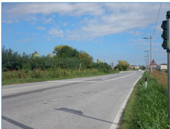
Figura 2.11: SR11, tratto ad est della rotatoria presso Canale Industriale Ovest

Capitale Sociale Euro 1.500.000,00 i.v. – Partita IVA / Cod.fiscale 04452700273