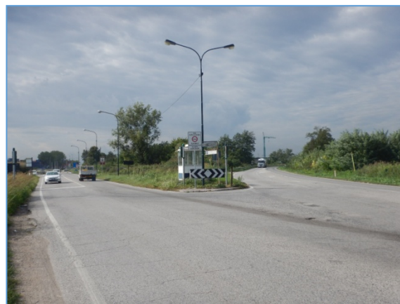
Figura 2.12: SR11, intersezione con via Malcontenta

SP81 , tratto da rotatoria presso Canale Industriale Ovest a Casello Autostradale Mira - Oriago: è presente una sola carreggiata, a doppio senso con una corsia per senso di marcia; in generale la linea di mezzzeria è continua, tranne in corrispondenza delle intersezioni laterali; sono presenti tre intersezioni a rotatoria, che - date le loro caratteristiche geometriche - non diminuiscono la capacità complessiva del tratto.