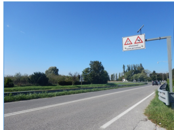
Figura 2.10: SR11, tratto ad ovest della rotonda presso Naviglio del Brenta

SR11, tratto ad est della rotonda presso Canale Industriale Ovest: fino all'inserimento su via Fratelli Bandiera ha le medesime caratteristiche del tratto che proviene da ovest; a partire da via Fratelli Bandiera, può essere considerata come una strada urbana di scorrimento a due carreggiate con due corsie per senso di marcia e prosegue come tale fino all'innesto su via della Libertà.