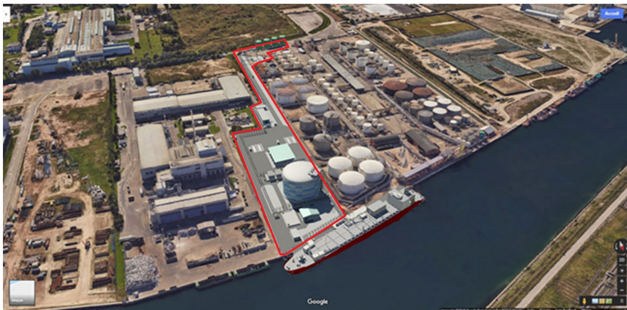
Fig. 1.1: fotoinserimento del progetto

Capitale Sociale Euro 1.500.000,00 i.v. – Partita IVA / Cod.fiscale 04452700273