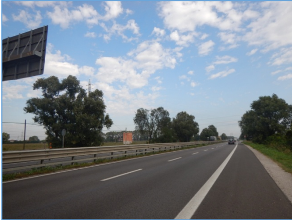
Figura 2.3: SS309, tratto compreso tra la rotonda di Marghera e la rotonda presso il Canale Industriale Ovest - Direzione Nord

Capitale Sociale Euro 1.500.000,00 i.v. – Partita IVA / Cod.fiscale 04452700273