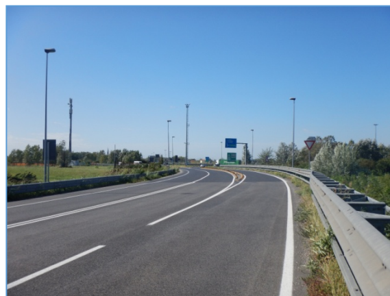
Figura 2.14: SP81, presso ingresso autostradale Mira - Oriago

Rotatoria collocata all'intersezione di SS309 , SR11 ed SP81 : si tratta di una rotatoria di grandi dimensioni, il cui diametro interno è di circa 230 metri; è dotata di tre corsie tutto il suo sviluppo; i rami che confluiscono in essa hanno due corsie di ingresso ed una di uscita (SS309 ed SP81), tranne la SR11 che ha soltanto una corsia in ingresso ed una in uscita.