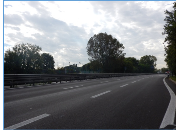
Figura 2.3: SS309, tratto compreso tra la rotonda di Marghera e la rotonda presso il Canale Industriale Ovest - Direzione Sud

SS309, tratto compreso tra la rotonda presso il Canale Industriale Ovest e l'intersezione con la SP24 (via delle Valli): ha due carreggiate separate con due corsie per ciascuna carreggiata; sono presenti alcuni accessi laterali dotati di relativa corsia di accelerazione/decelerazione; l'intersezione con la SP24 presenta una corsia centrale per la svolta a sinistra (veicoli marcianti da nord a sud) che prosegue come corsia di immissione per chi proviene dalla SP24 ed è diretto verso sud.