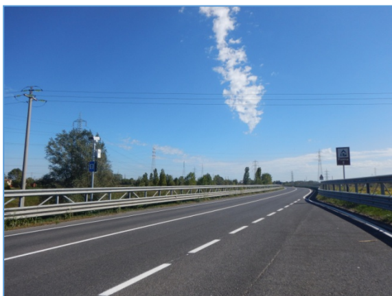
Figura 2.4: SP81, tratto da rotatoria presso Canale Industriale Ovest a rotatoria Forte Tron

SP81 , tratto da rotatoria presso Canale Industriale Ovest a Casello Autostradale Mira - Oriago: è presente una sola carreggiata, a doppio senso con una corsia per senso di marcia; in generale la linea di mezzzeria è continua, tranne in corrispondenza delle intersezioni laterali; sono presenti tre intersezioni a rotatoria, che - date le loro caratteristiche geometriche - non diminuiscono la capacità complessiva del tratto.