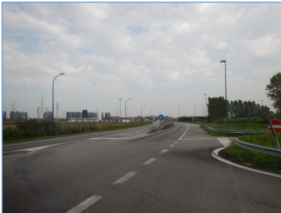
Figura 2.5: SS309, intersezione con la SP24 (via delle Valli)

SS309, tratto compreso tra la rotonda presso il Canale Industriale Ovest e l'intersezione con la SP24 (via delle Valli): ha due carreggiate separate con due corsie per ciascuna carreggiata; sono presenti alcuni accessi laterali dotati di relativa corsia di accelerazione/decelerazione; l'intersezione con la SP24 presenta una corsia centrale per la svolta a sinistra (veicoli marcianti da nord a sud) che prosegue come corsia di immissione per chi proviene dalla SP24 ed è diretto verso sud.