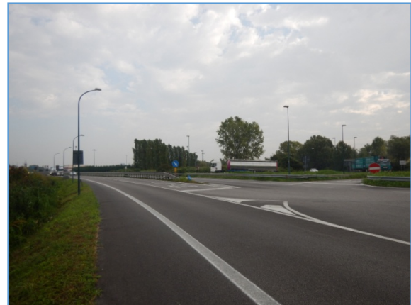
Figura 2.6: SS309, intersezione con la SP24 (via delle Valli)

SS309, tratto a sud dell'intersezione con la SP24: è presente una sola carreggiata, a doppio senso con una corsia per senso di marcia; in generale la linea di mezzzeria è continua, tranne in corrispondenza di alcune intersezioni che sono regolate da impianto semaforico o presentano corsie centrali dedicate alla svolta a sinistra.