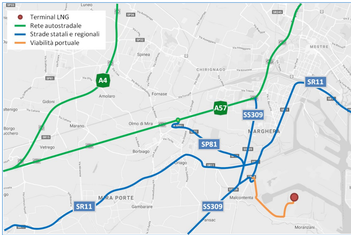
Figura 2.2: Accessibilità terrestre del cantiere

Capitale Sociale Euro 1.500.000,00 i.v. – Partita IVA / Cod.fiscale 04452700273