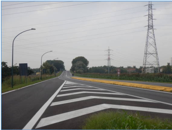
Figura 2.7: SS309, tratto a sud dell'intersezione con la SP24

Capitale Sociale Euro 1.500.000,00 i.v. – Partita IVA / Cod.fiscale 04452700273