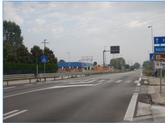
Figura 2.8: SS309, attraversamento pedonale in corrispondenza dell'incrocio con via Malcantone

SR11, tratto ad ovest della rotonda presso Canale Industriale Ovest: è presente una sola carreggiata, a doppio senso con una corsia per senso di marcia, senza corsia di emergenza e con numerosi accessi laterali, anche privati; si tratta di una strada extraurbana che assume una caratterizzazione prettamente urbana per l'attraversamento dei centri abitati di Oriago e Mira.