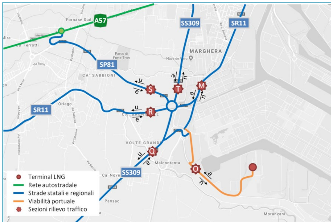
Fig. 4.1: collocazione delle sezioni di rilievo per la caratterizzazione del traffico nell'area di interesse

Capitale Sociale Euro 1.500.000,00 i.v. – Partita IVA / Cod.fiscale 04452700273