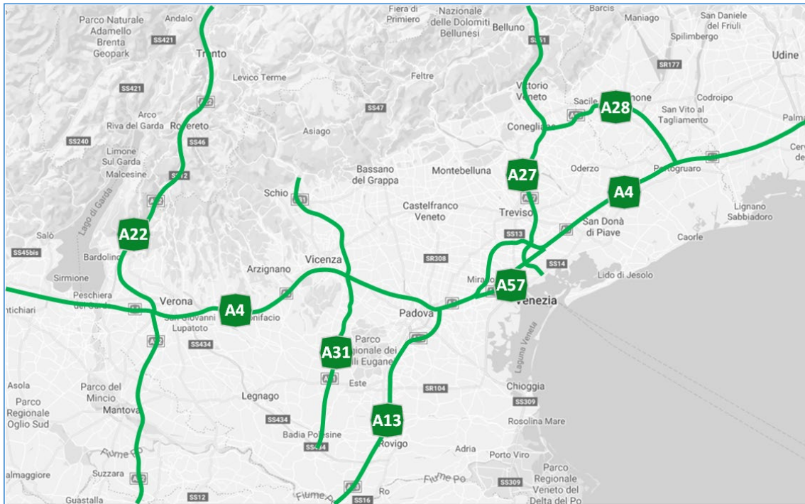
Figura 2.1: Rete Autostradale Nord-Est Italia a servizio del Porto di Venezia

Capitale Sociale Euro 1.500.000,00 i.v. – Partita IVA / Cod.fiscale 04452700273