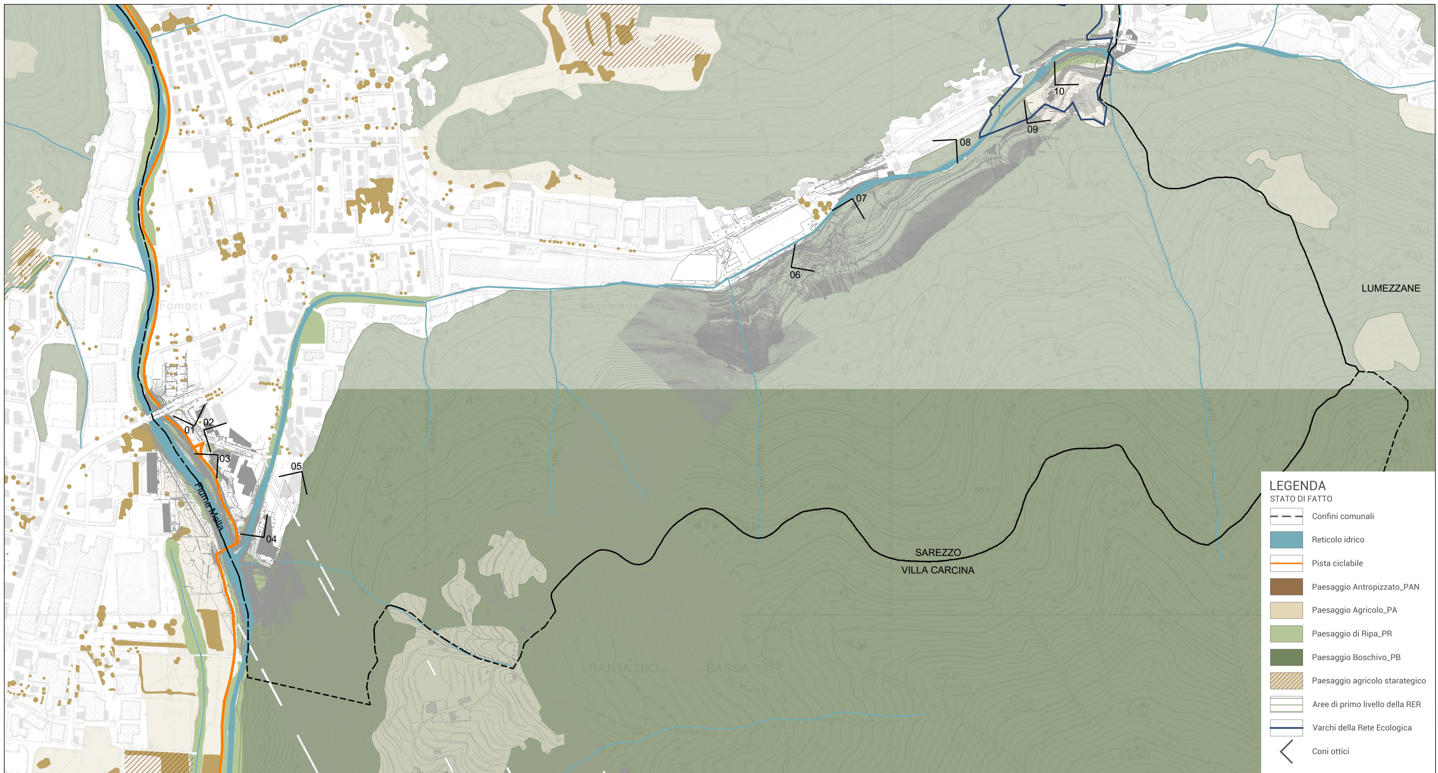
01 STATO DI FATTO_Quadrante B 1:5.000