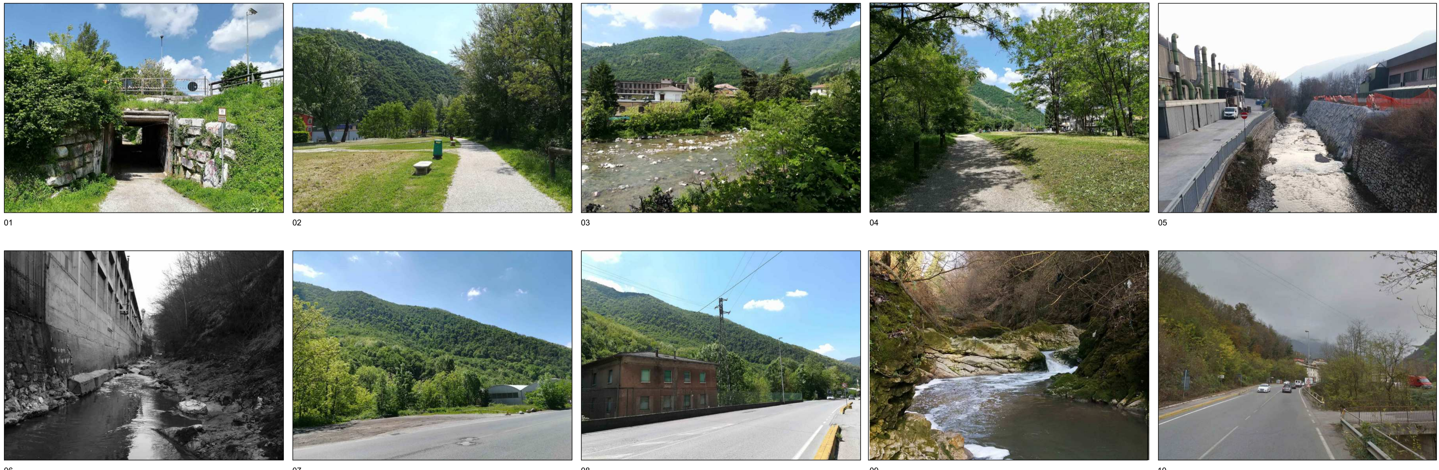
02 RICOGNIZIONE FOTOGRAFICA Eseguita in data 23/05/2019