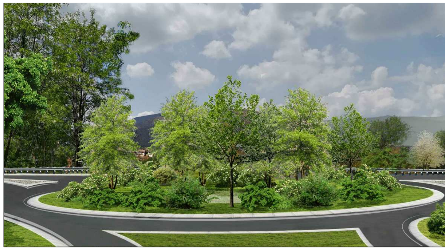
01_Nuova rotondina superficiale in località San Vigilio