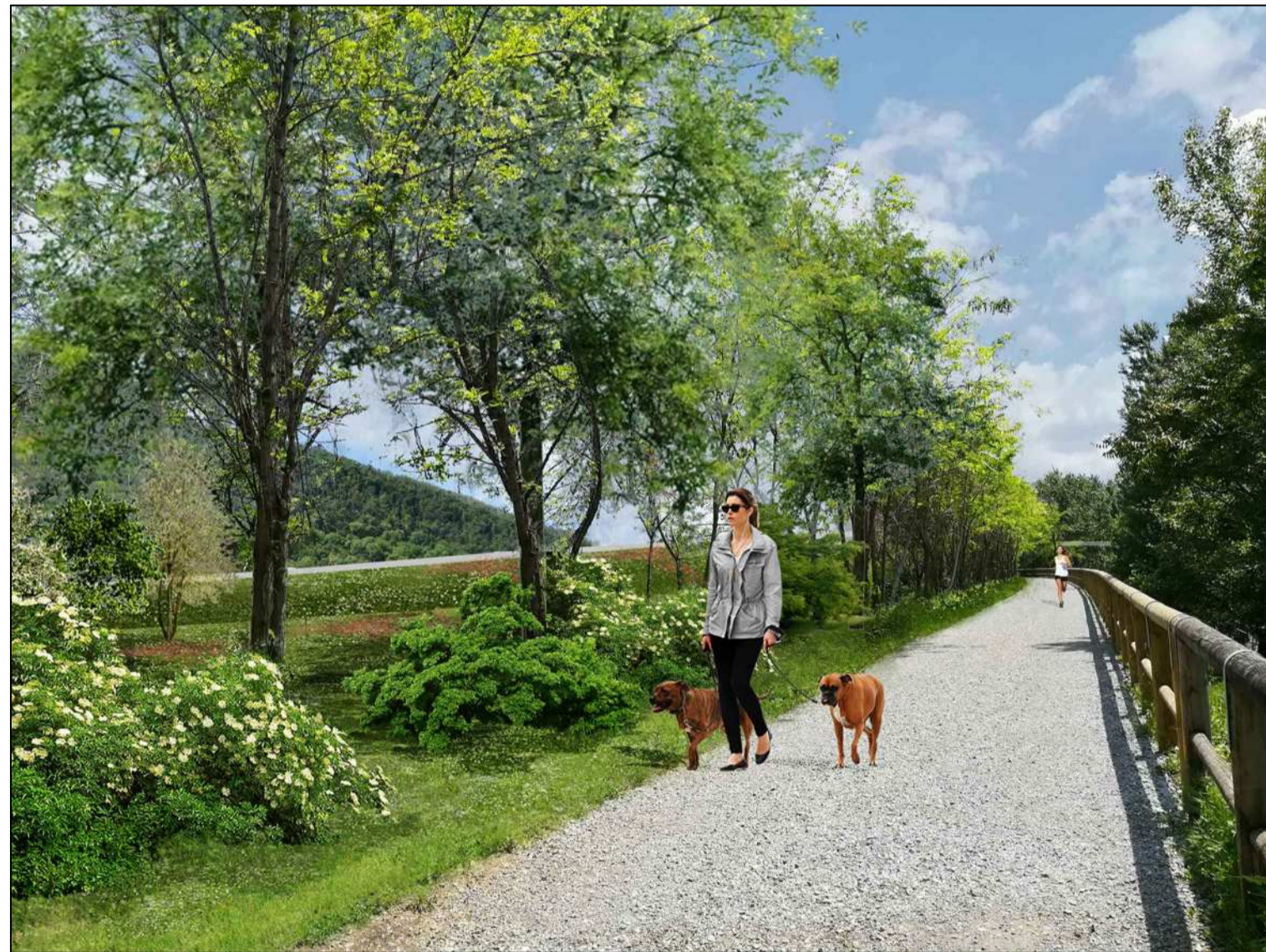
03_Percorso pedonale in prossimità dello svincolo di Villa Carcina verso il rilevato stradale