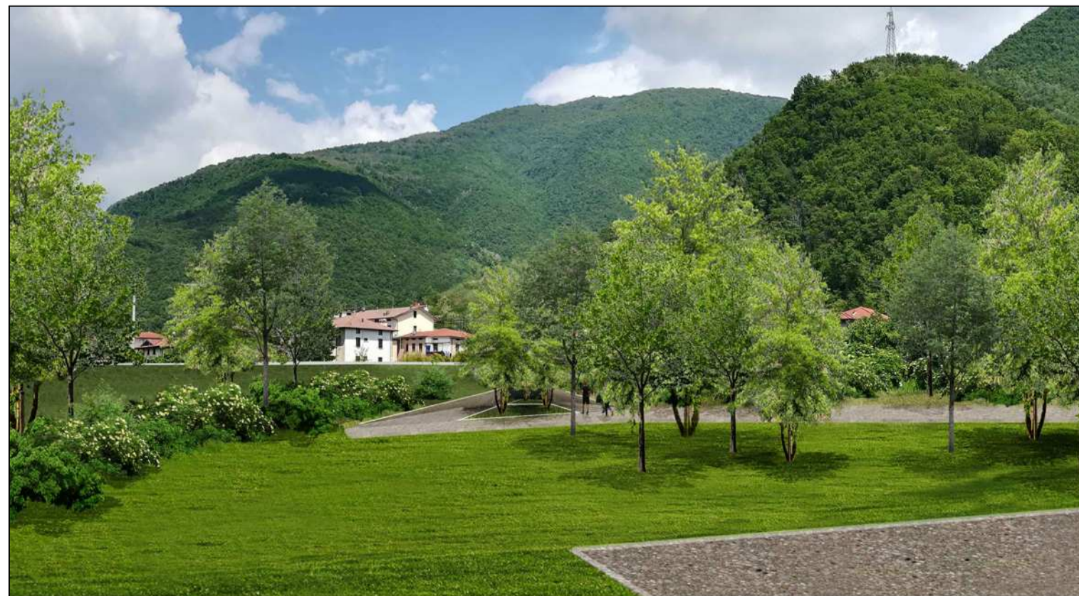
04_Ingresso al manufatto archeologico di Villa Carcina