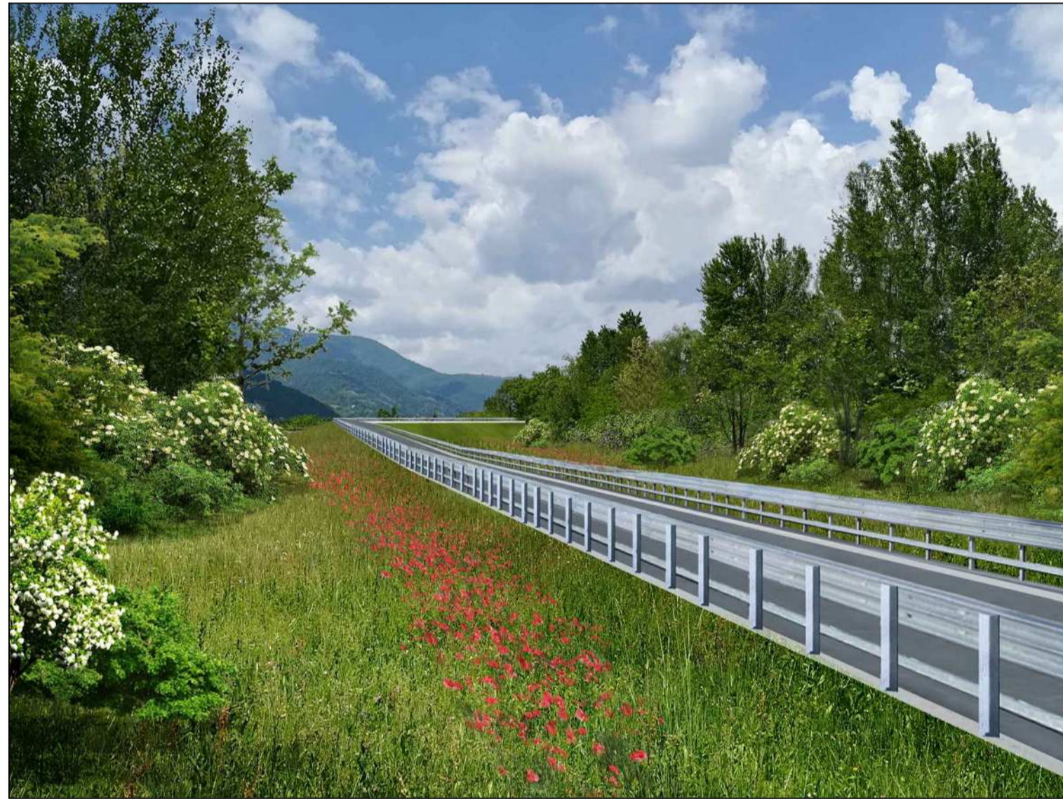
02_Tracciato stradale in uscita dalla galleria artificiale di San Vigilio