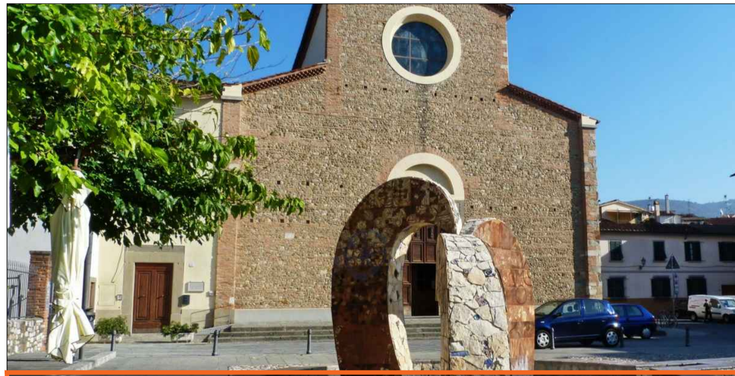
Chiesa di Sant'Agostino XIII secolo