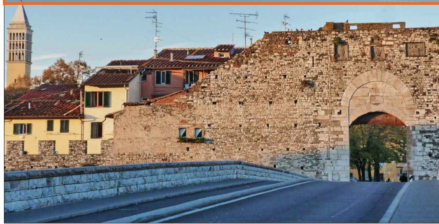
Porta del Mercatale XII secolo