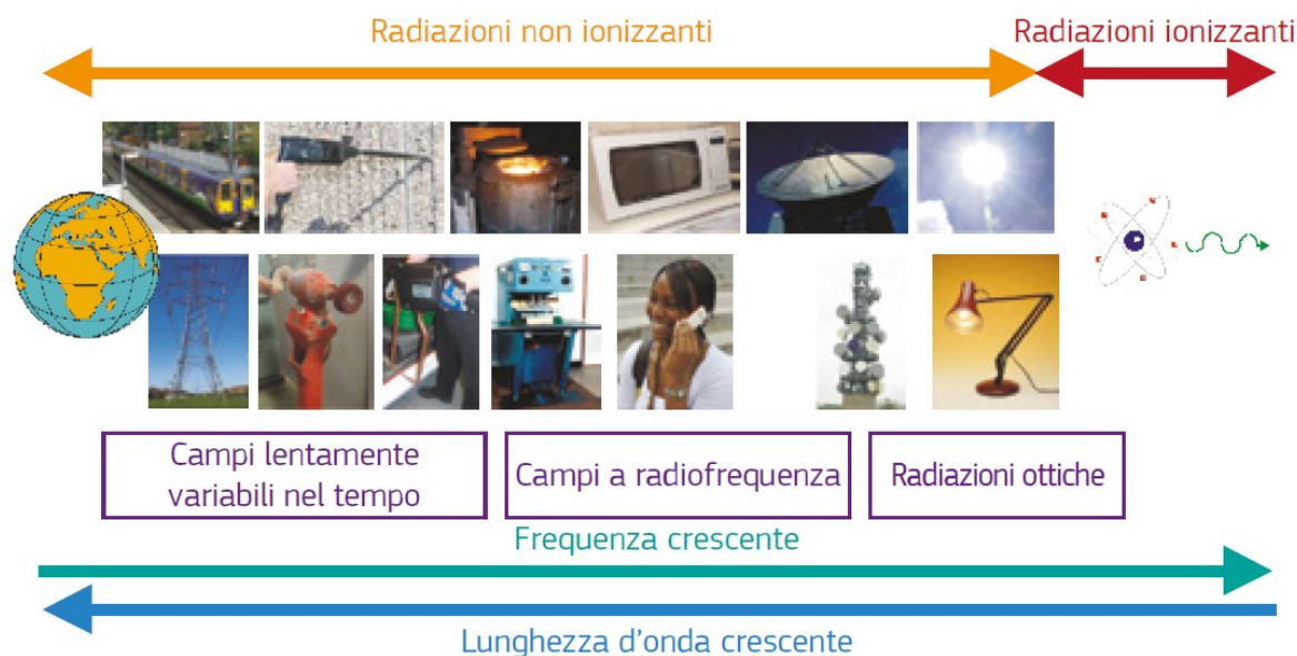
Grafico esplicativo della suddivisione delle radiazioni in non ionizzanti e ionizzanti

Si consulti in proposito l'immagine appresso indicata: