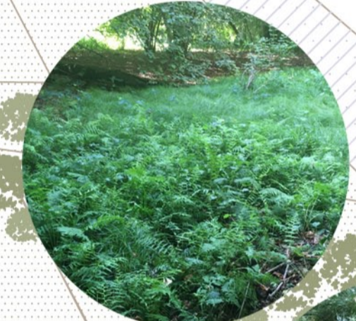
Sottobosco (Felci, Carex)