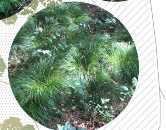
Sottobosco (Felci, Carex)