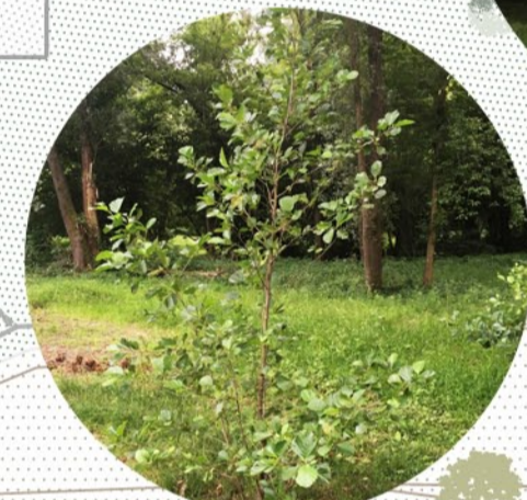
Piantagioni arboree (Carpini, Ontani)