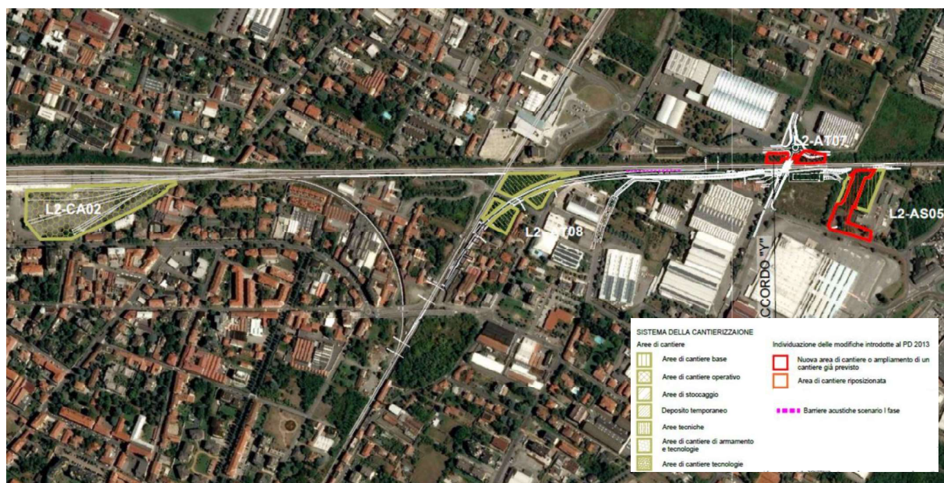
Figura 2 – Inquadramento tratto oggetto d'intervento in Provincia di Varese relativo al progetto Raccordo a Y (stralcio tav. MDL130D22N5SA0001008A - Individuazione e caratterizzazione delle parti progettuali oggetto di integrazione e aggiornamento - 4/4.)

Le modifiche progettuali che interessano il territorio della provincia di Varese e che sono oggetto di valutazione riguardano esclusivamente l'ottimizzazione costruttiva delle barriere acustiche e il sistema della cantierizzazione. In relazione alle barriere acustiche si rileva che è prevista una nuova barriera in corrispondenza del confine tra i Comuni di Castellanza e Busto Arsizio (linea rosa nell'immagine).