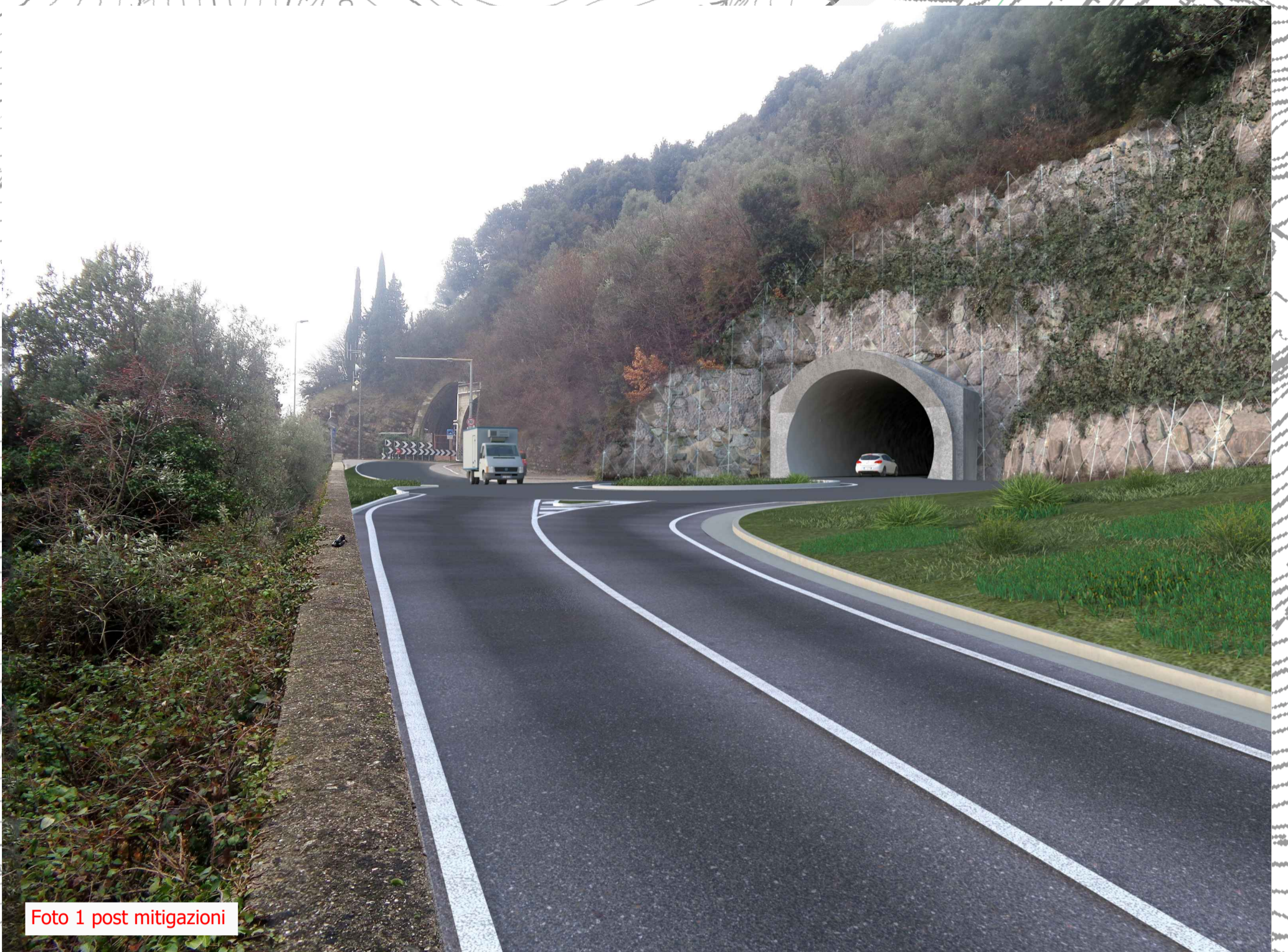
Foto 1 post mitigazioni