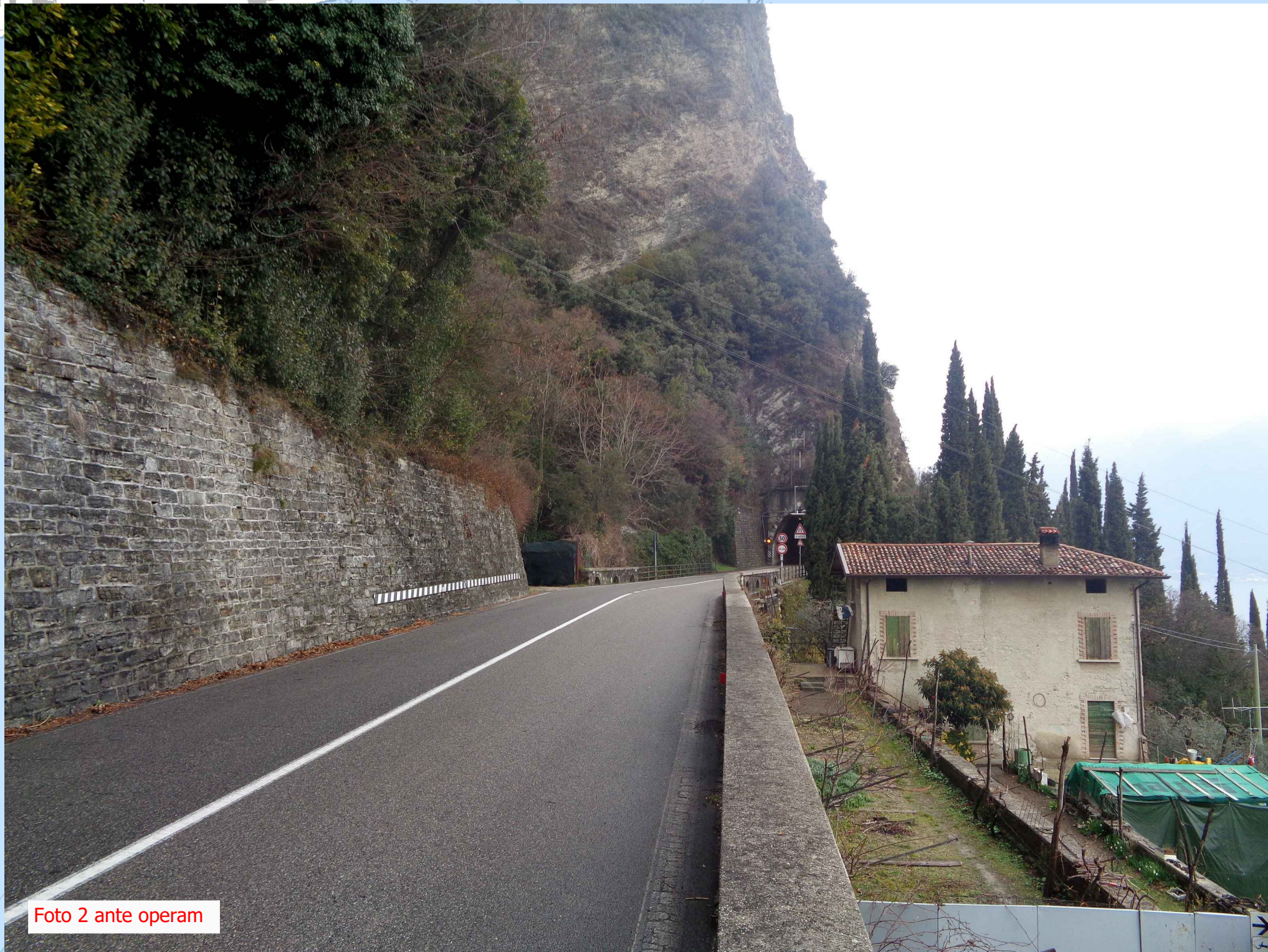
Foto 2 ante operam