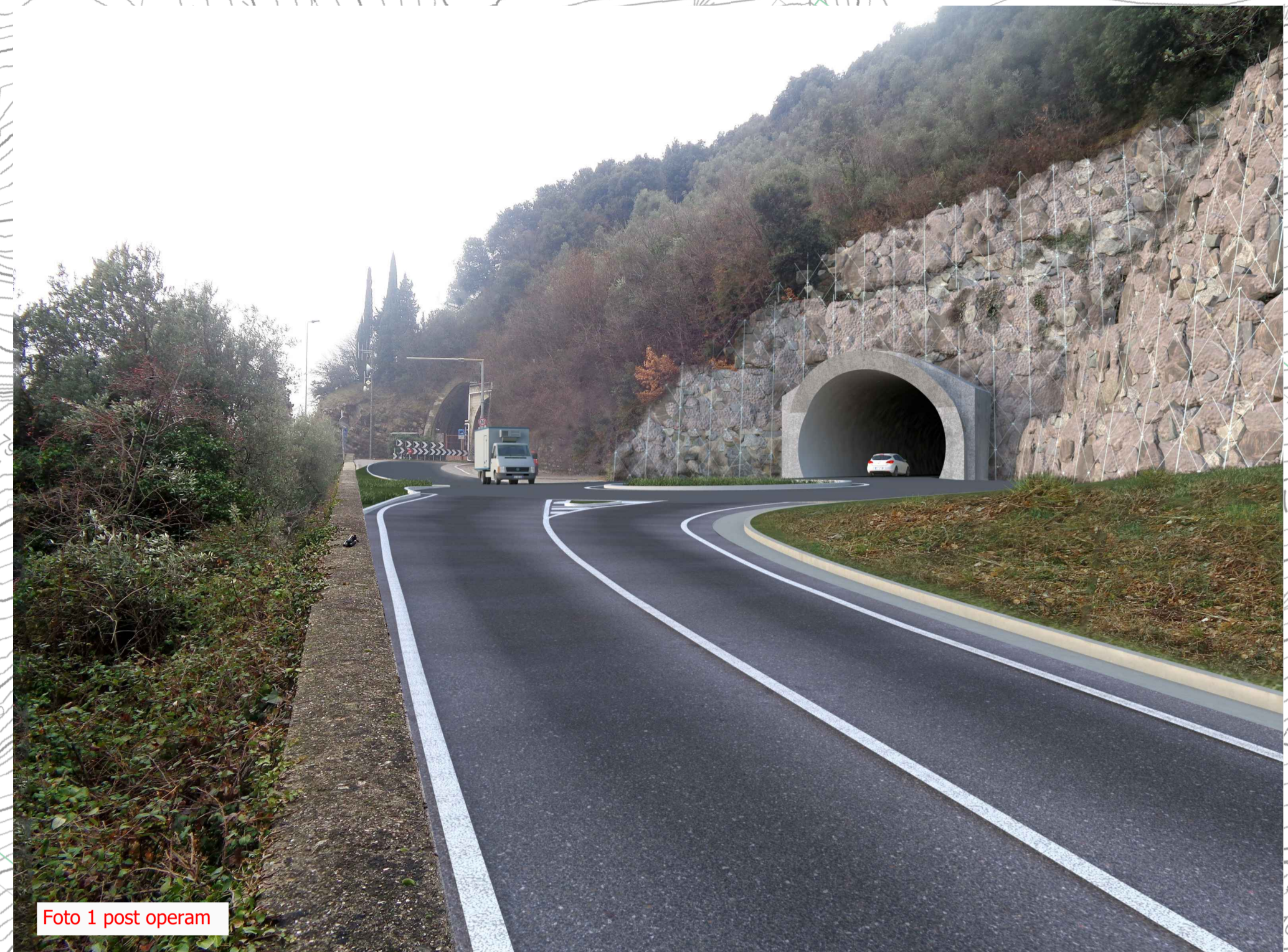
Foto 1 post operam