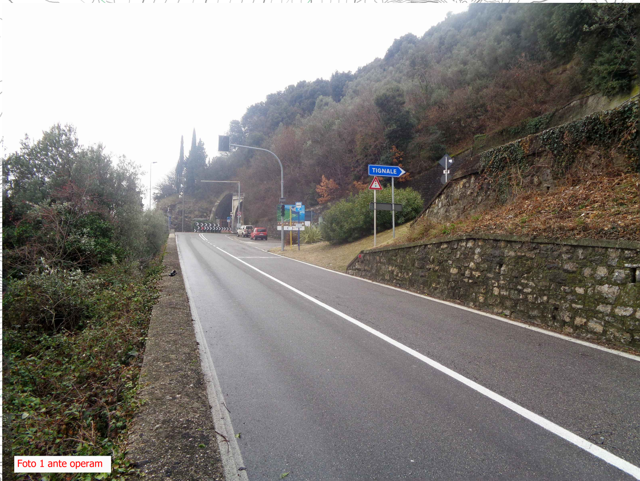
Foto 1 ante operam