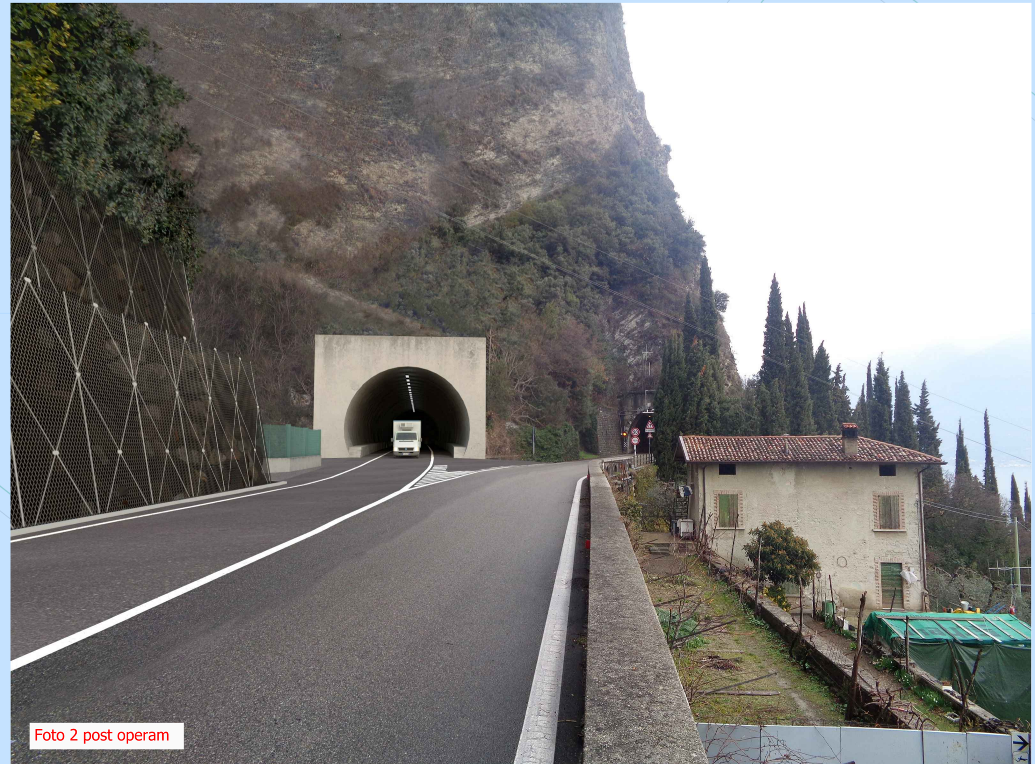
Foto 2 post operam