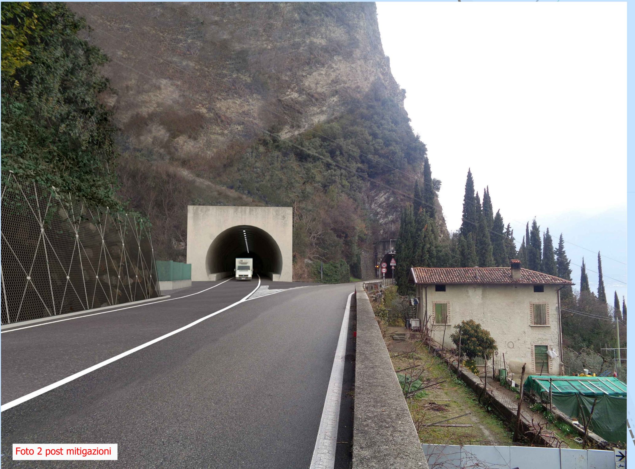
Foto 2 post mitigazioni