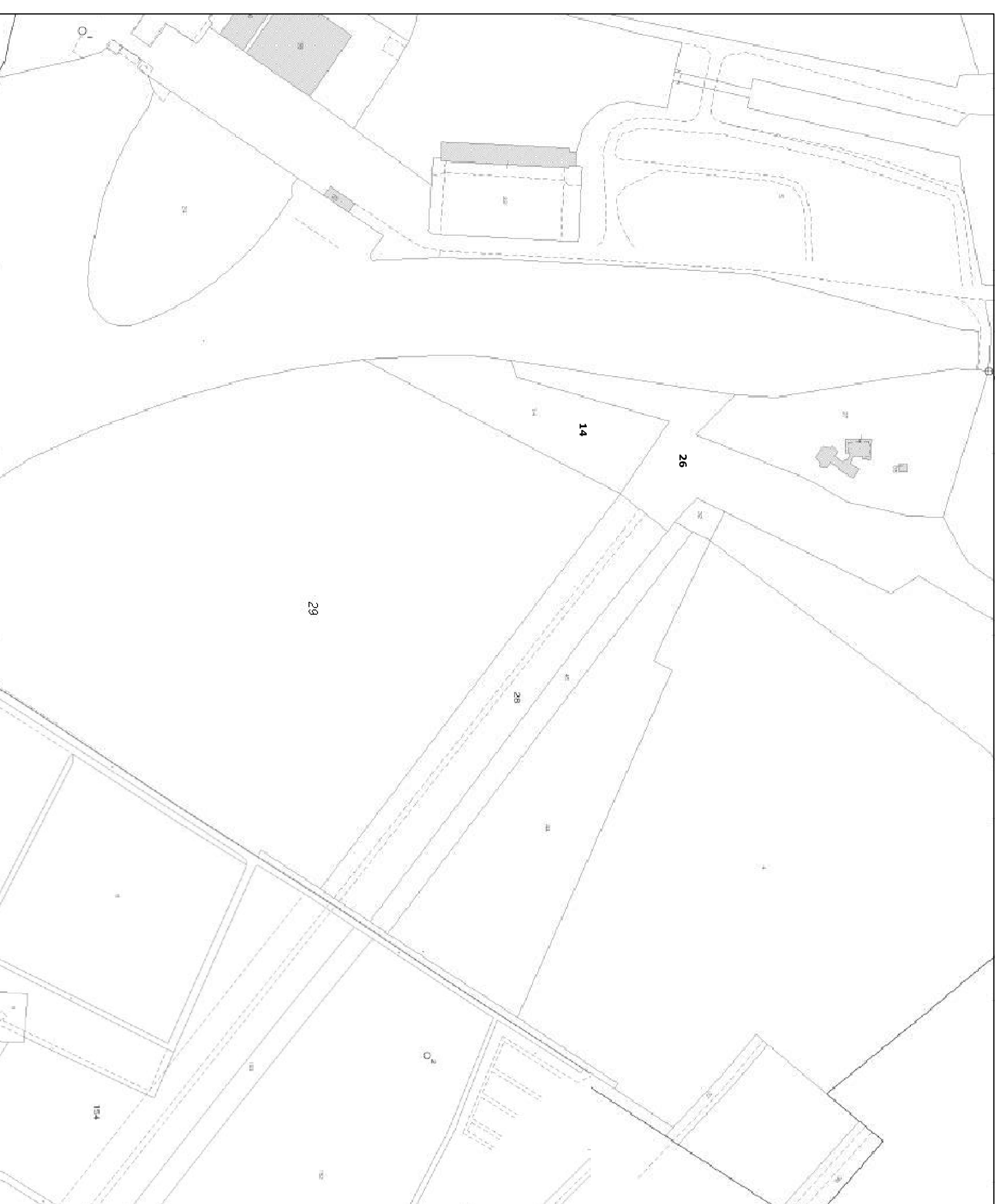
FIG. 3 - "Sbancatura limitagli da decommissionare". Area di intervento Spazio di accesso