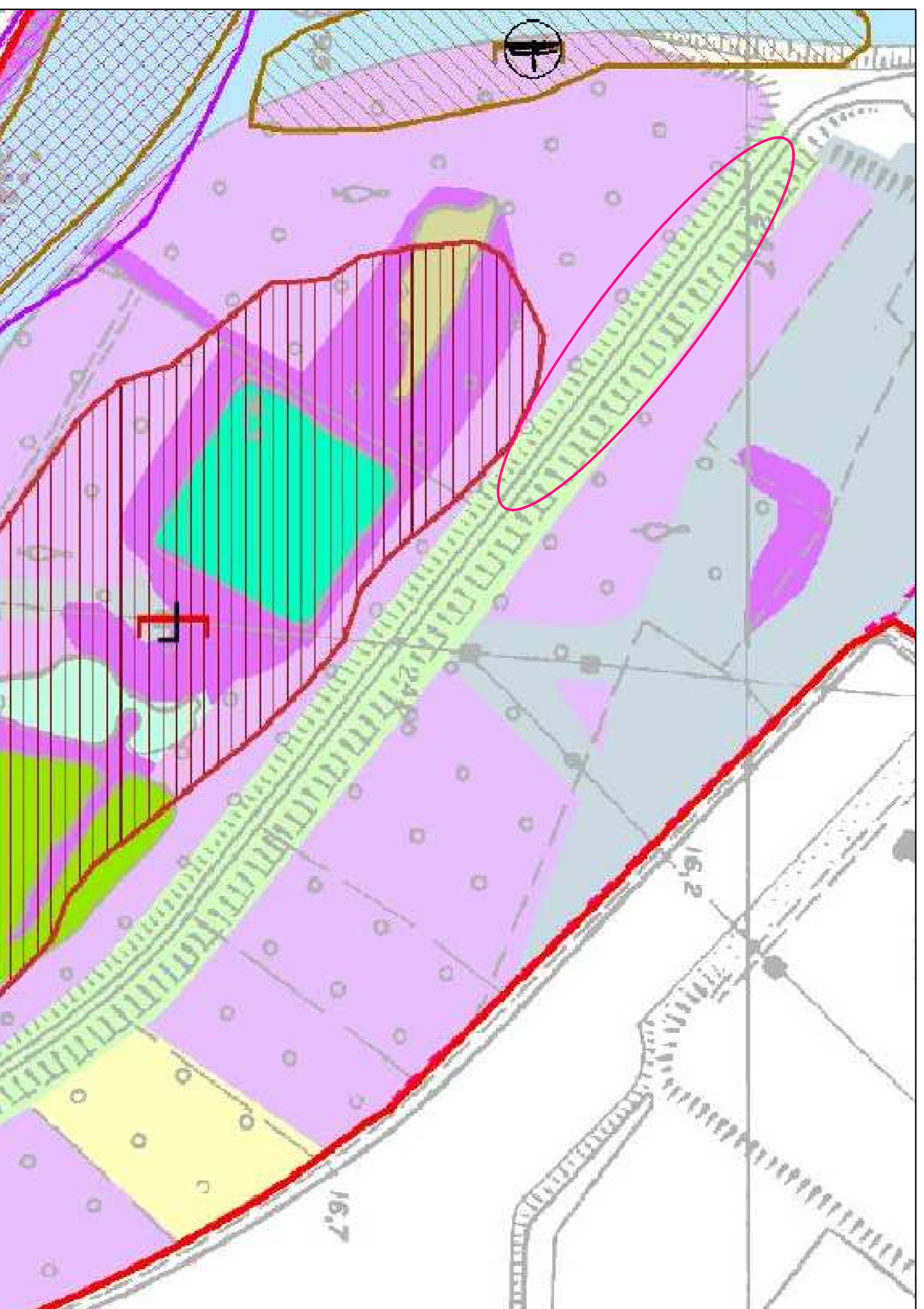
Stralcio della Tavola 7 - Carta degli areali faunistici; Piano di Gestione della Riserva Naturale Vallazza e del SIC/ZPS "Vallazza" Zona di intervento