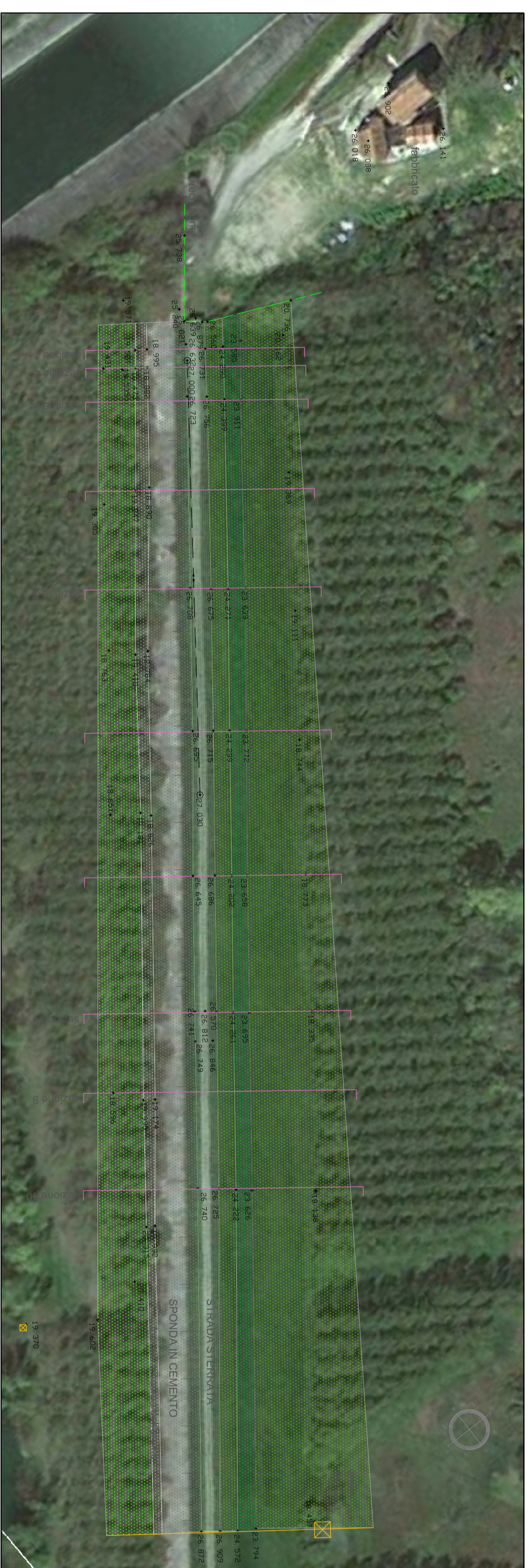
RILIEVO SOVRAPPPOSTO ALL'ORTOTOPO 1:1.000