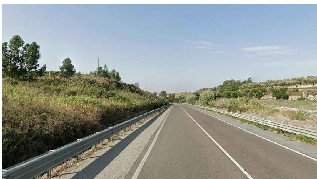
STATO ANTE OPERAM