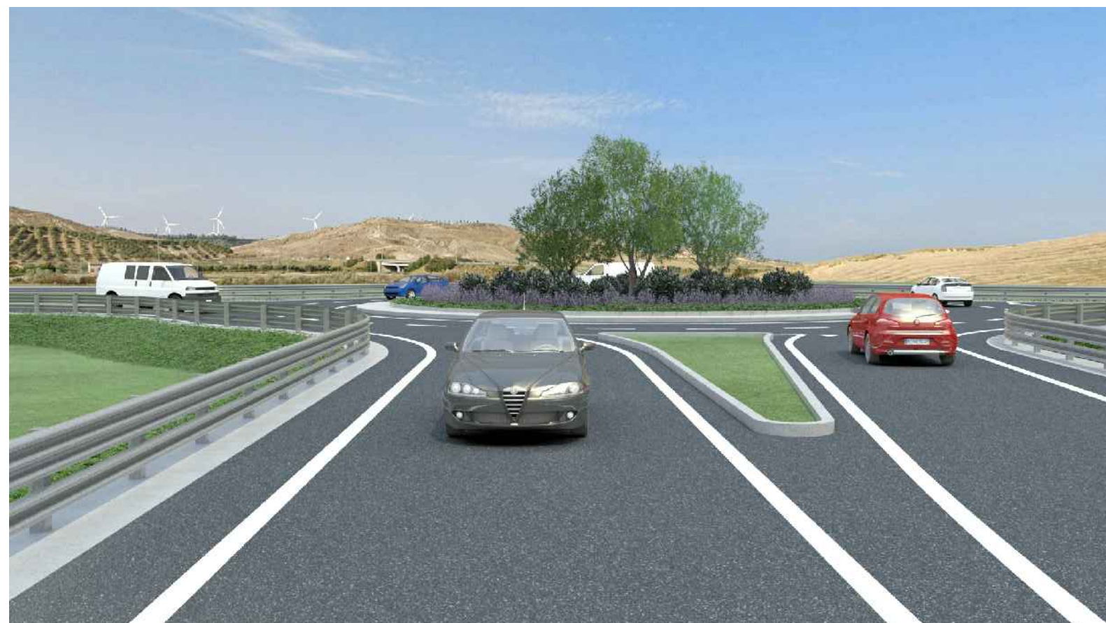
STATO POST OPERAM