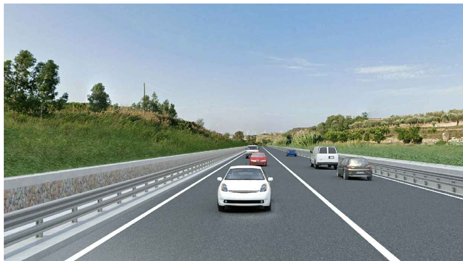
STATO POST OPERAM