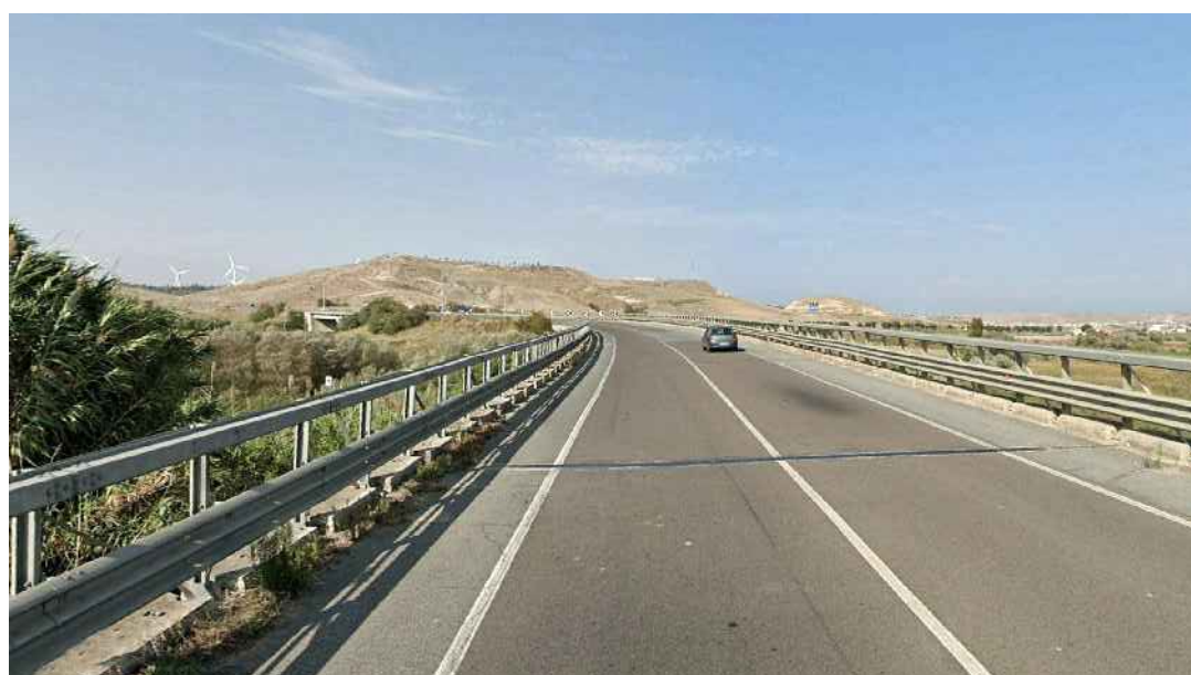
STATO ANTE OPERAM