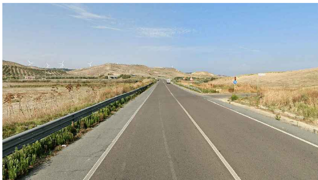
STATO ANTE OPERAM