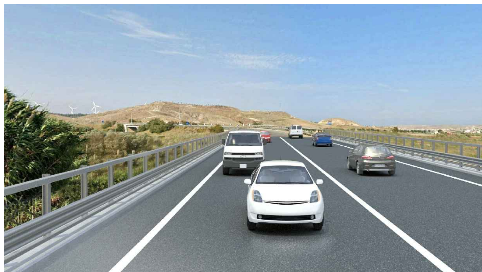
STATO POST OPERAM