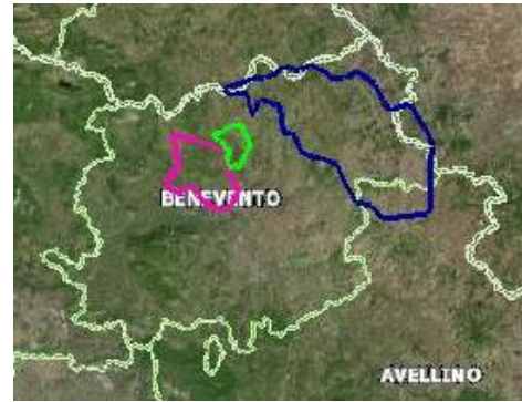
Mappa di inquadramento territoriale

Questa Associazione, quale ente gestore dell'oasi WWF "Lago di Campolattaro", parzialmente coincidente con la Zona di Protezione Speciale (ZPS) codice IT8020015 ( Invaso del Fiume Tammaro ), evidenzia la criticità verso cui sta evolvendo il territorio circostante, come mostra la mappa seguente.