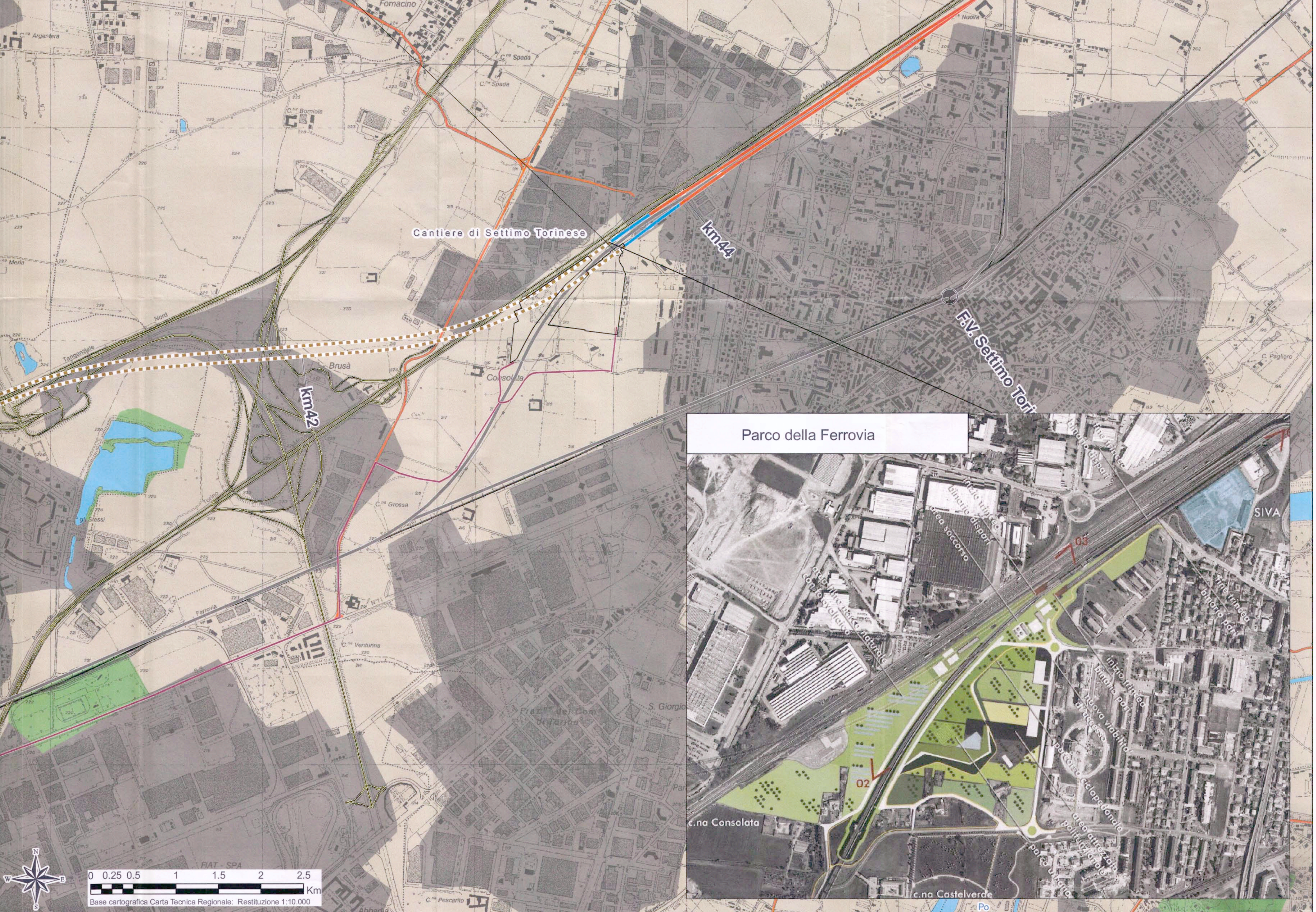
Parco della Ferrovia