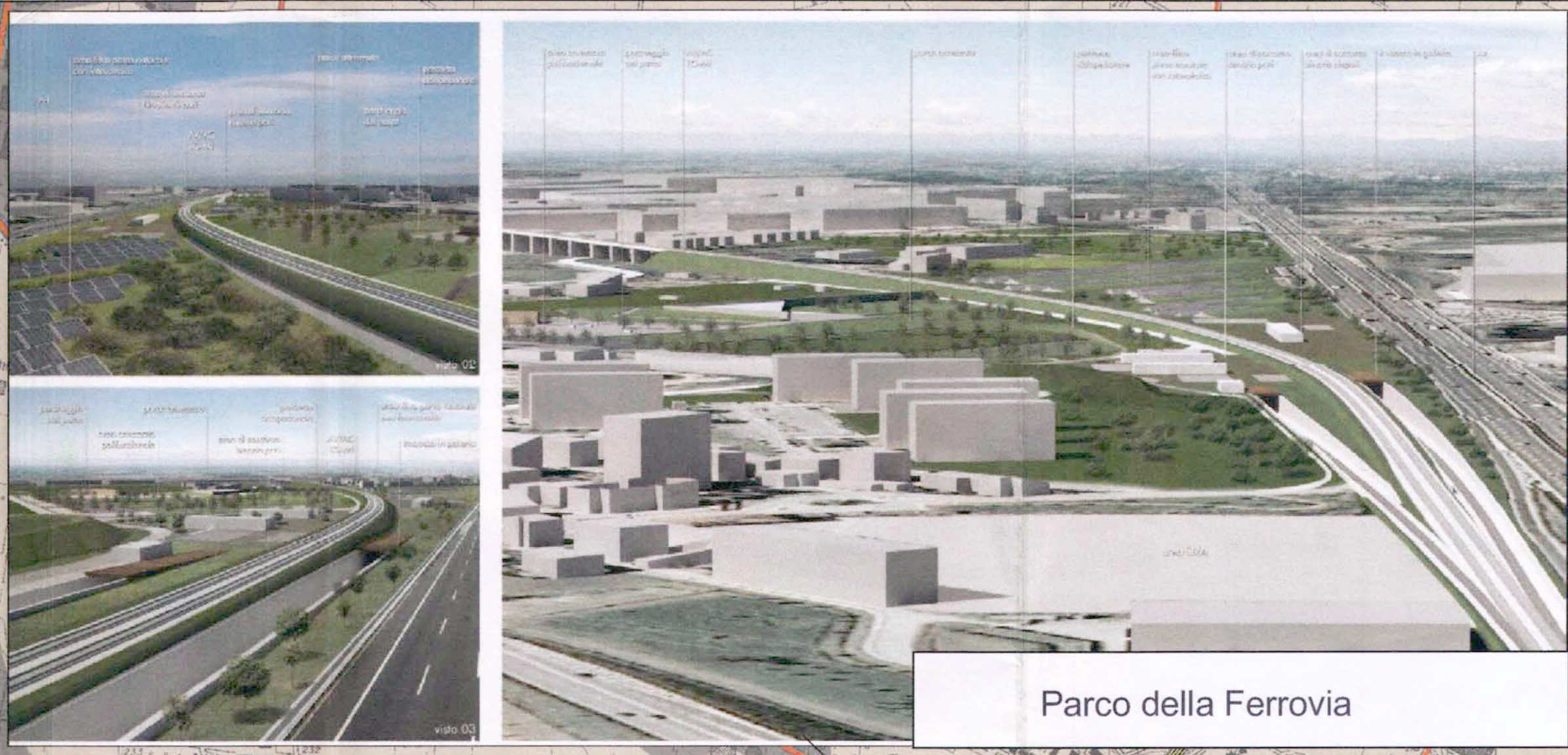
Parco della Ferrovia