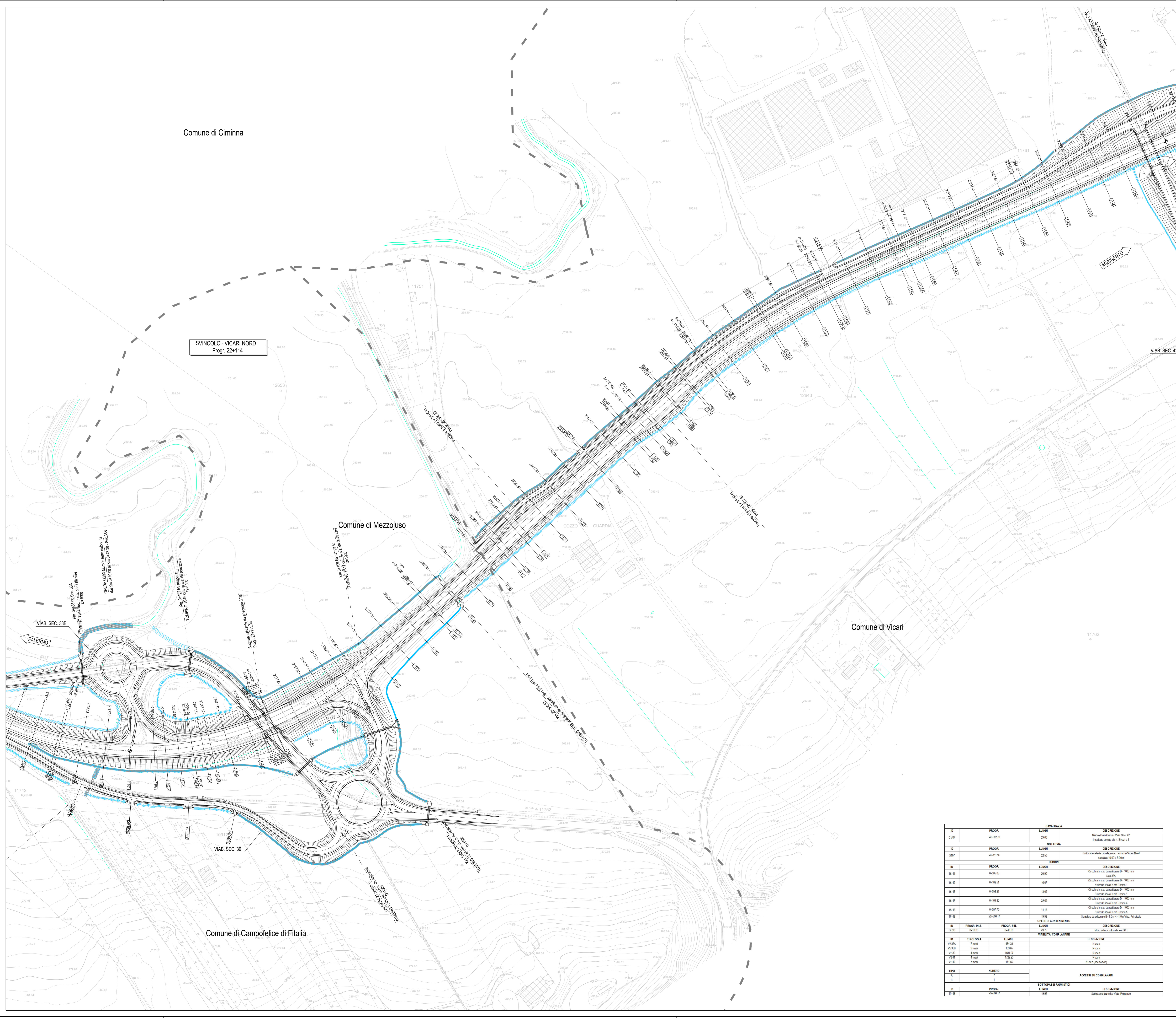
QUADRO DI UNIONE - Scala 1:100.000