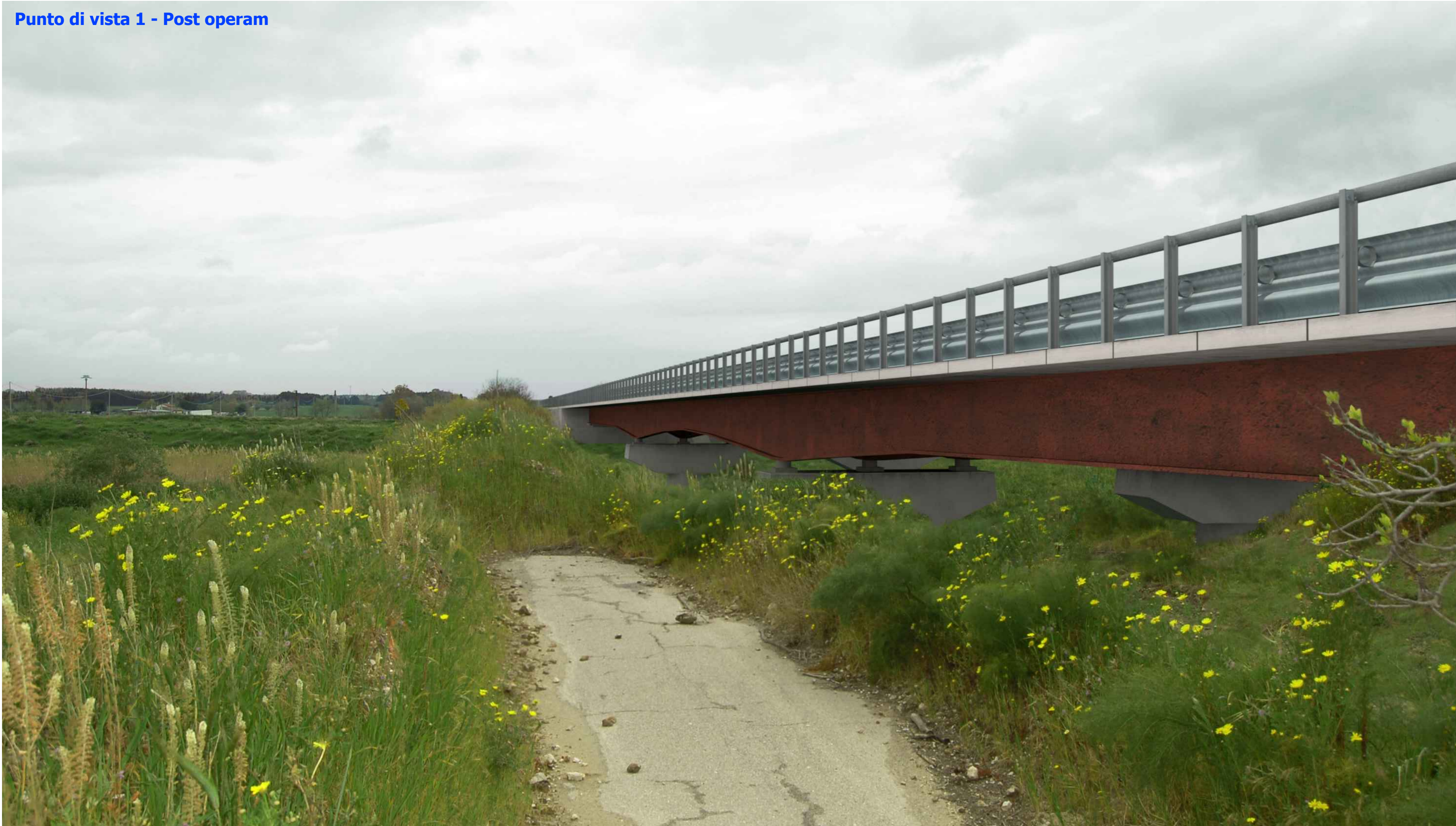
Punto di vista 1 - Post operam