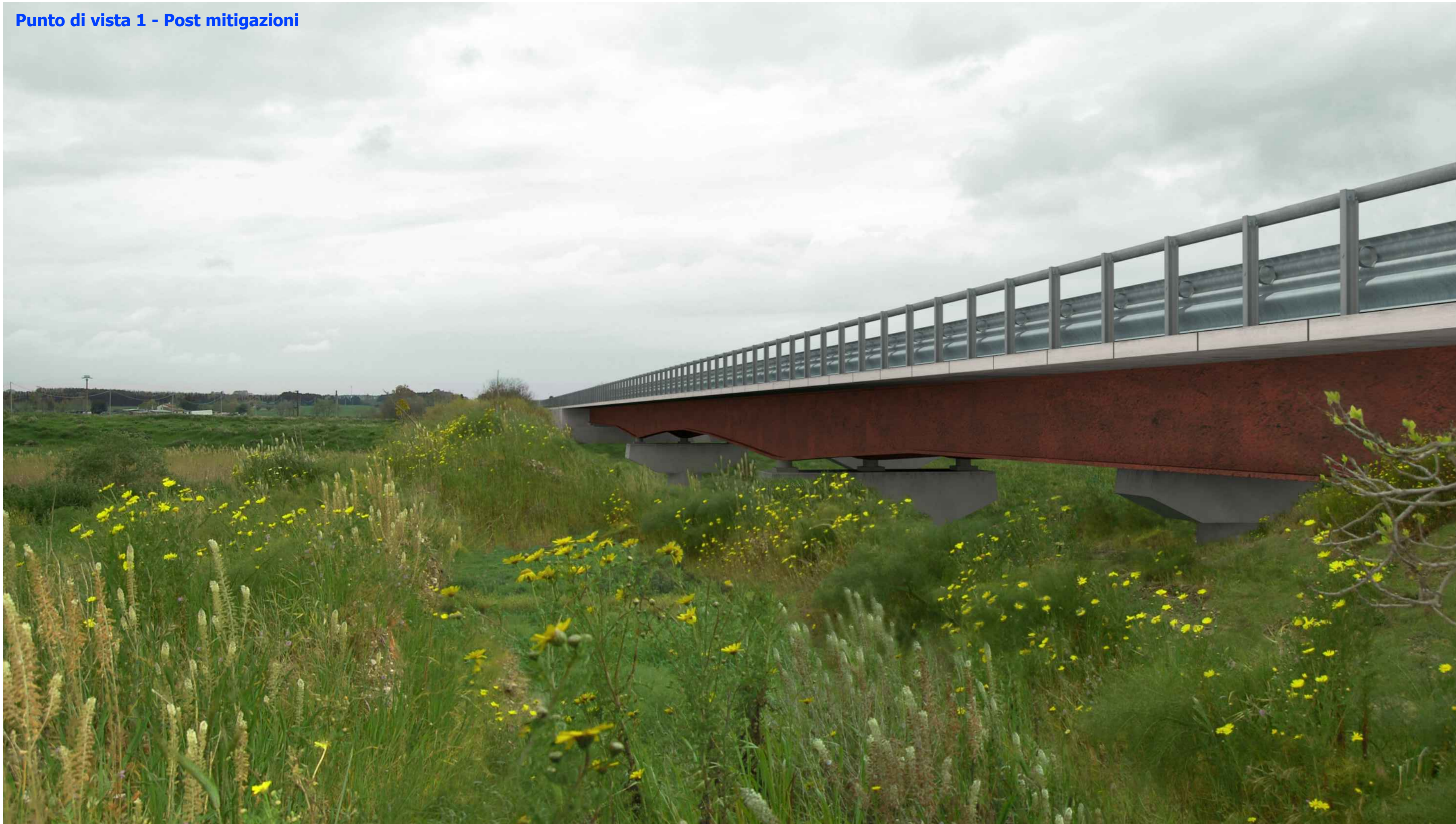
Punto di vista 1 - Post mitigazioni