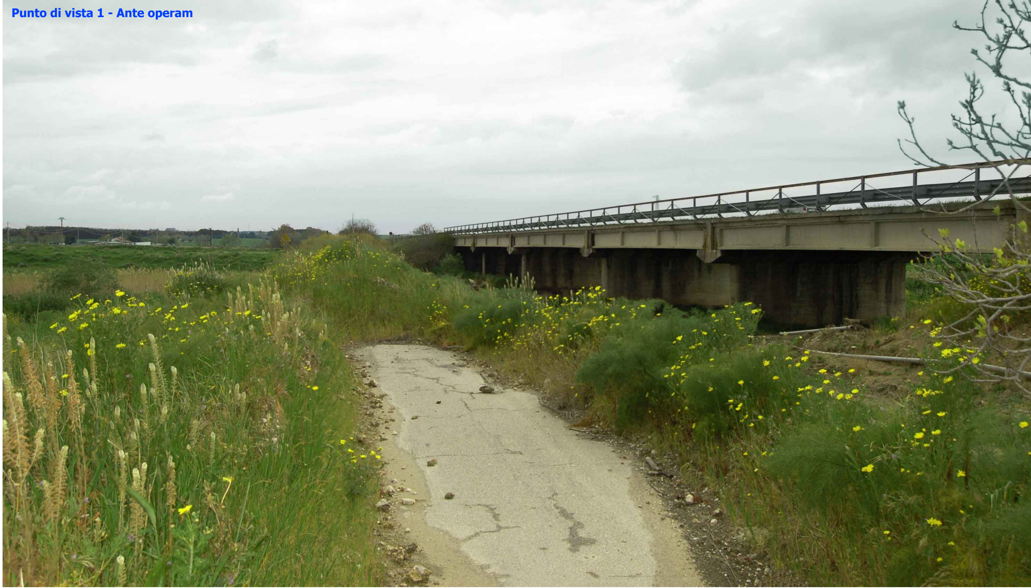
Punto di vista 1 - Ante operam