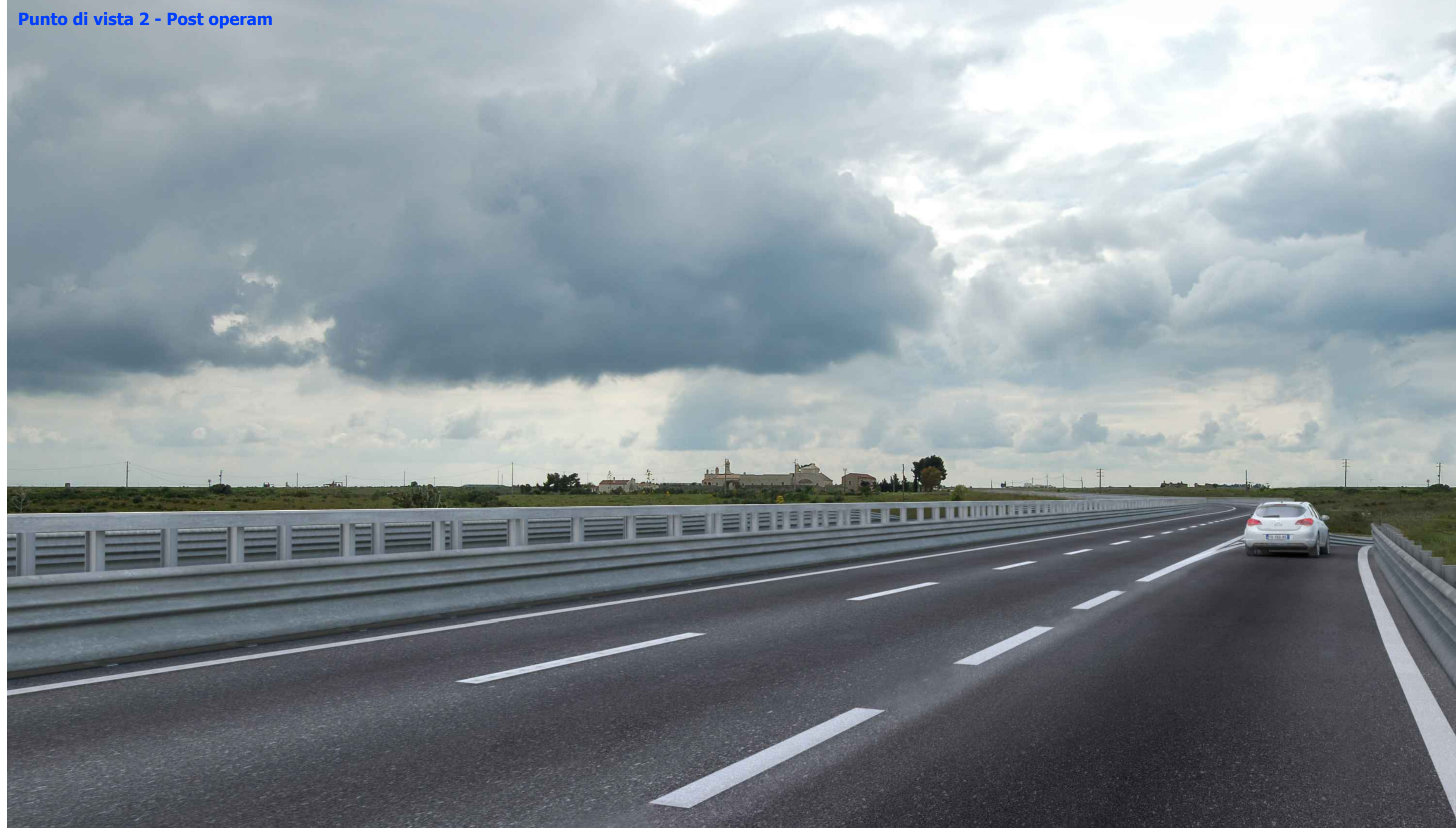
Punto di vista 2 - Post operam