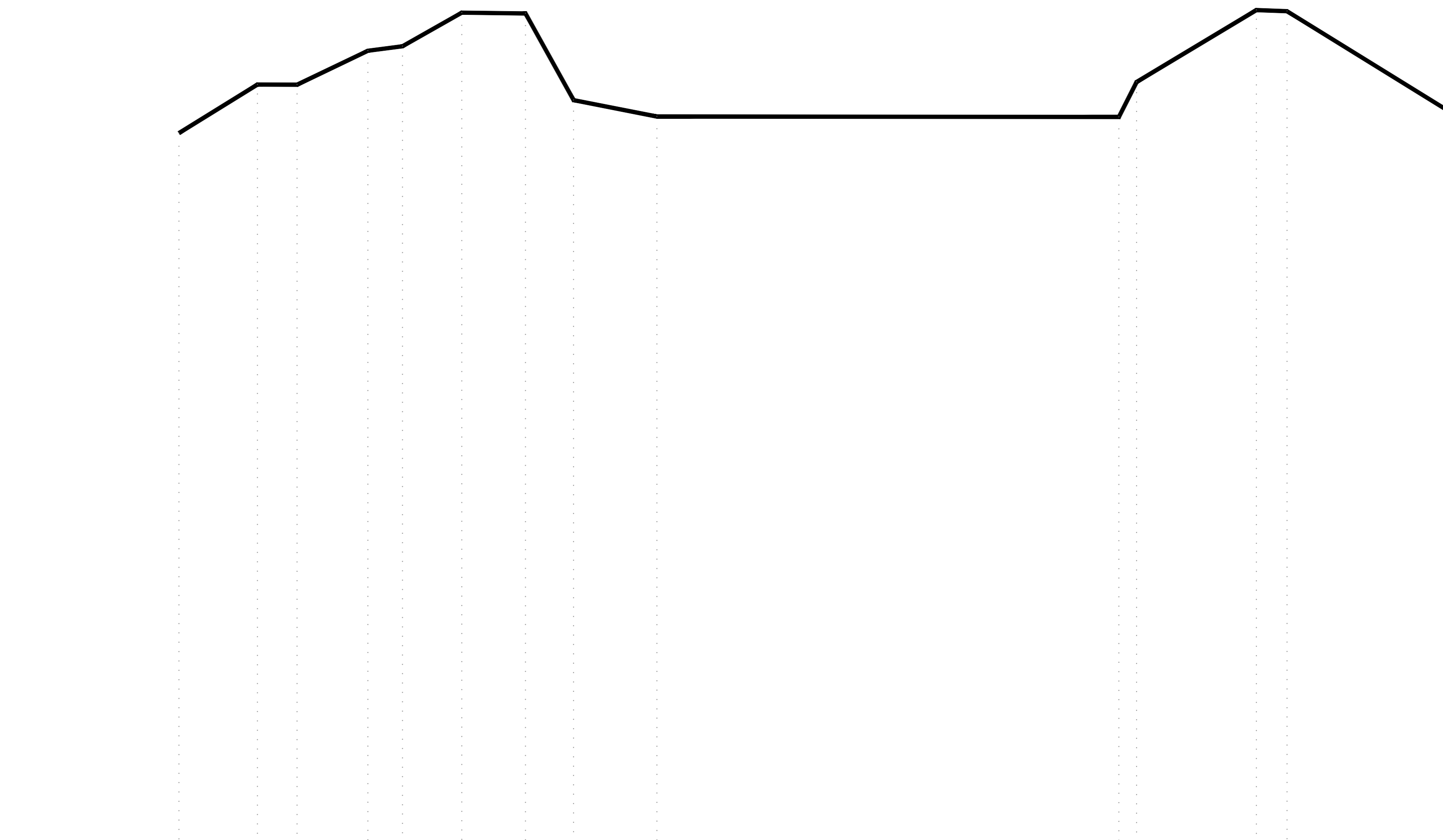
Guà sez 2