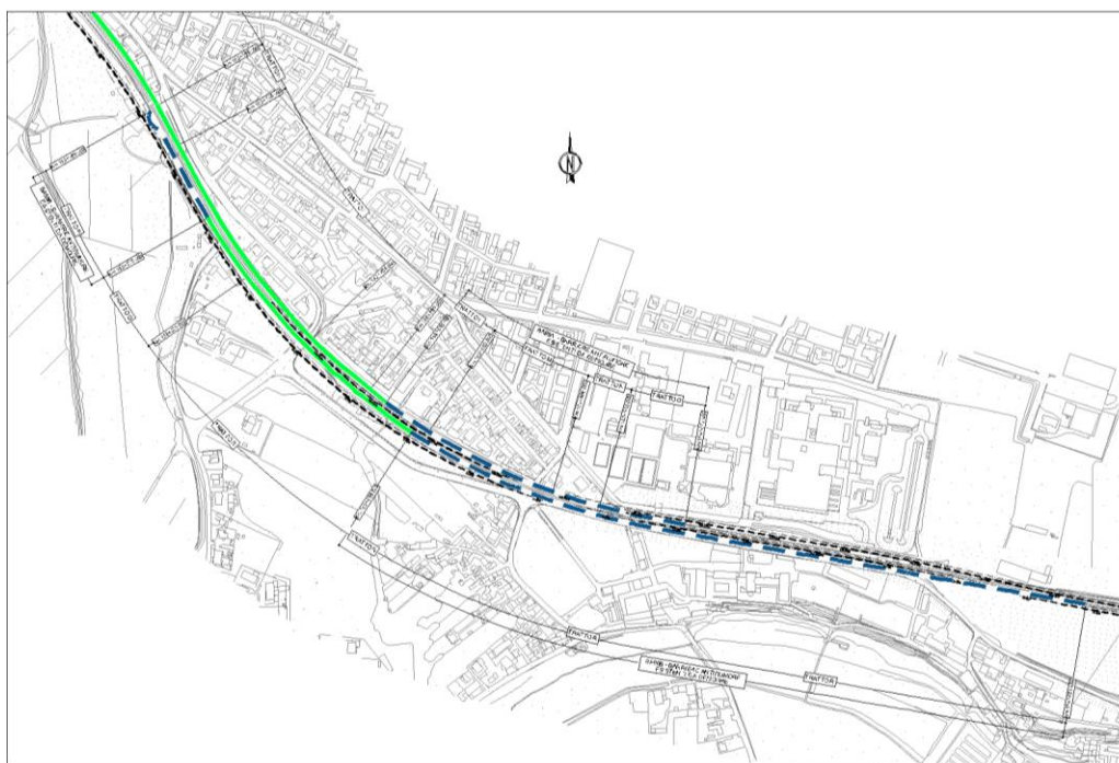
Figura 2 – Stralcio planimetrico barriere da demolire

Si riporta inoltre uno stralcio planimetrico delle tratte oggetto delle demolizioni.