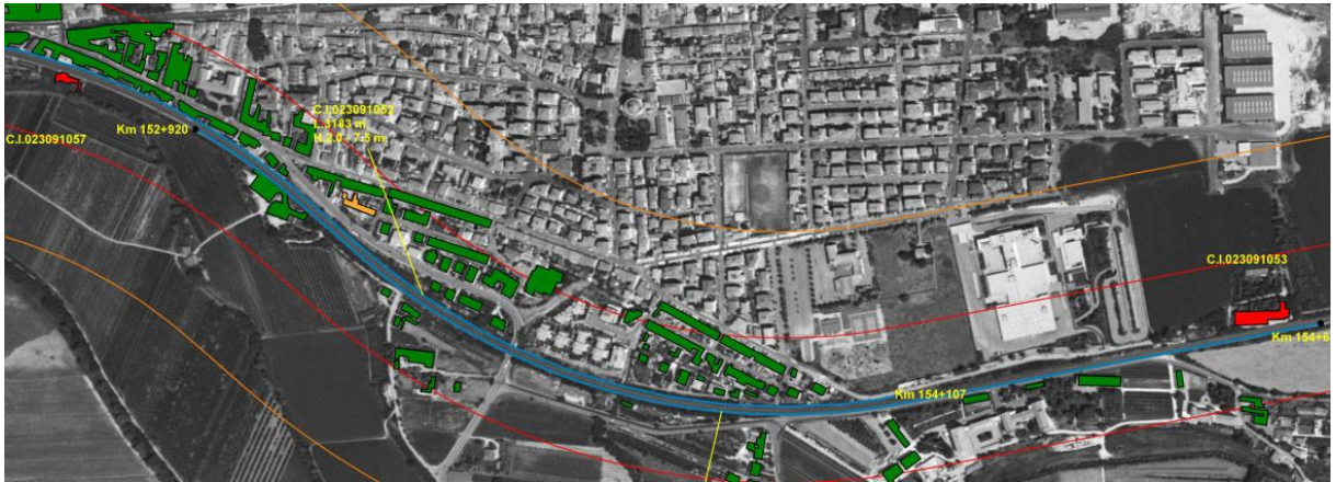
Figura 1 – Estratto Piano di risanamento Acustico Redatto ai sensi del DMA 29/11/2000 - Codici di intervento 023091052 e 023091058

Le barriere esistenti si estendono a nord dal km 151+424 al km 154+079 (corrispondente al tratto dal km 0+194 al km 2+810 della nuova linea A.V) e a sud dal km 153+089 (AV km 1+865) al km 154+651 (AV km 3+382).