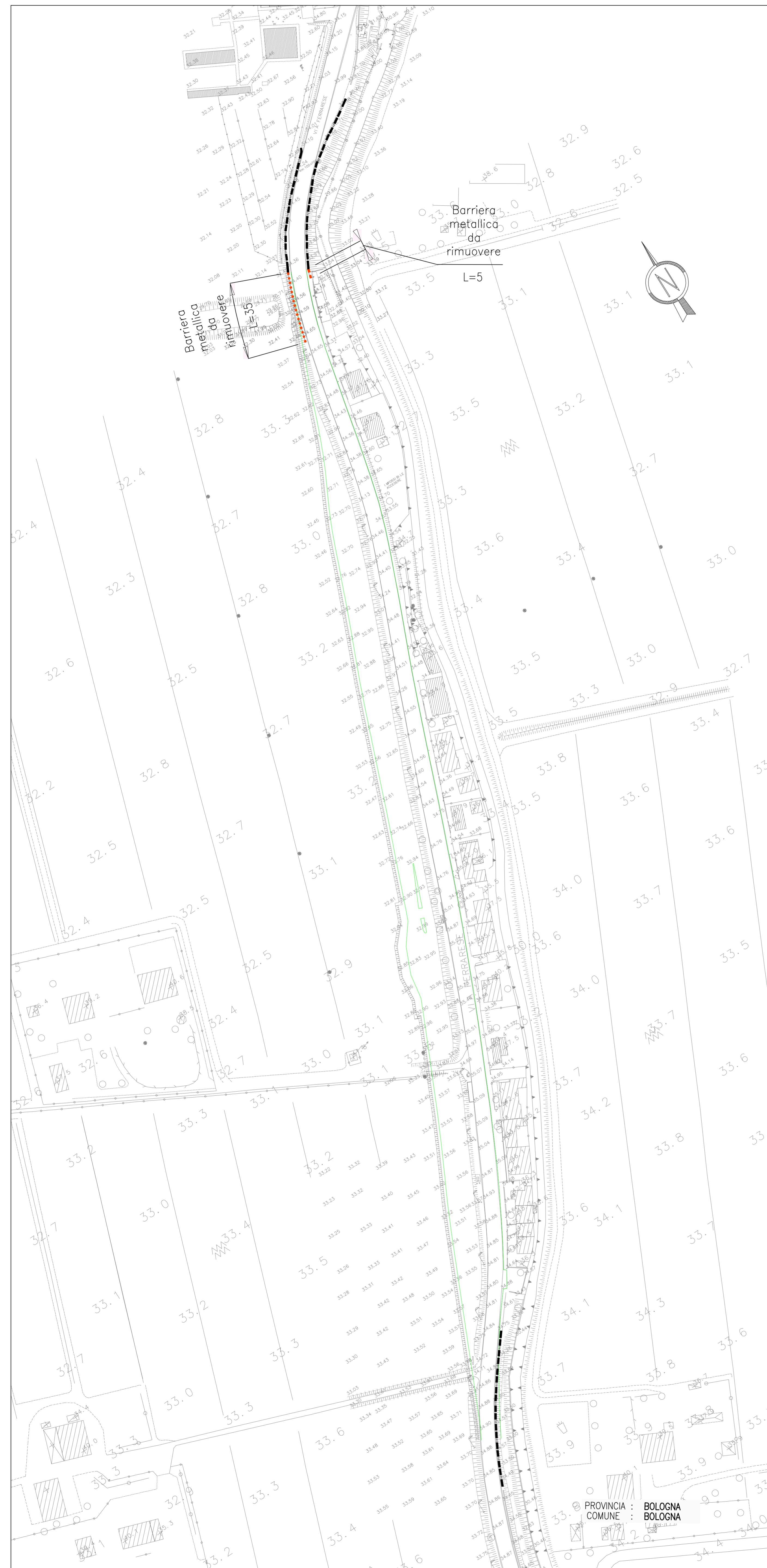
VL040: PLANIMETRIA DELLE RIMOZIONI