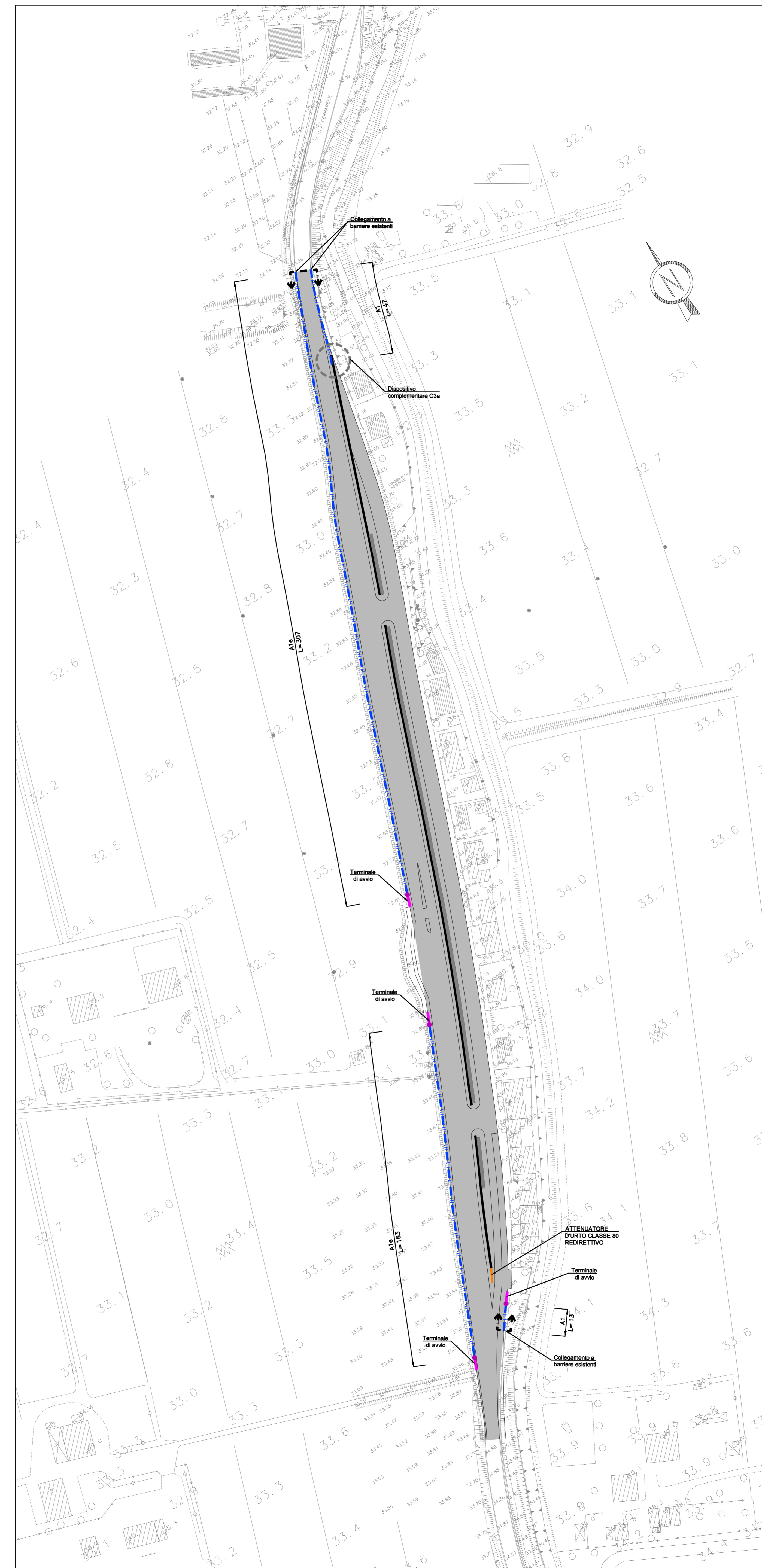
VL040: PLANIMETRIA DI PROGETTO