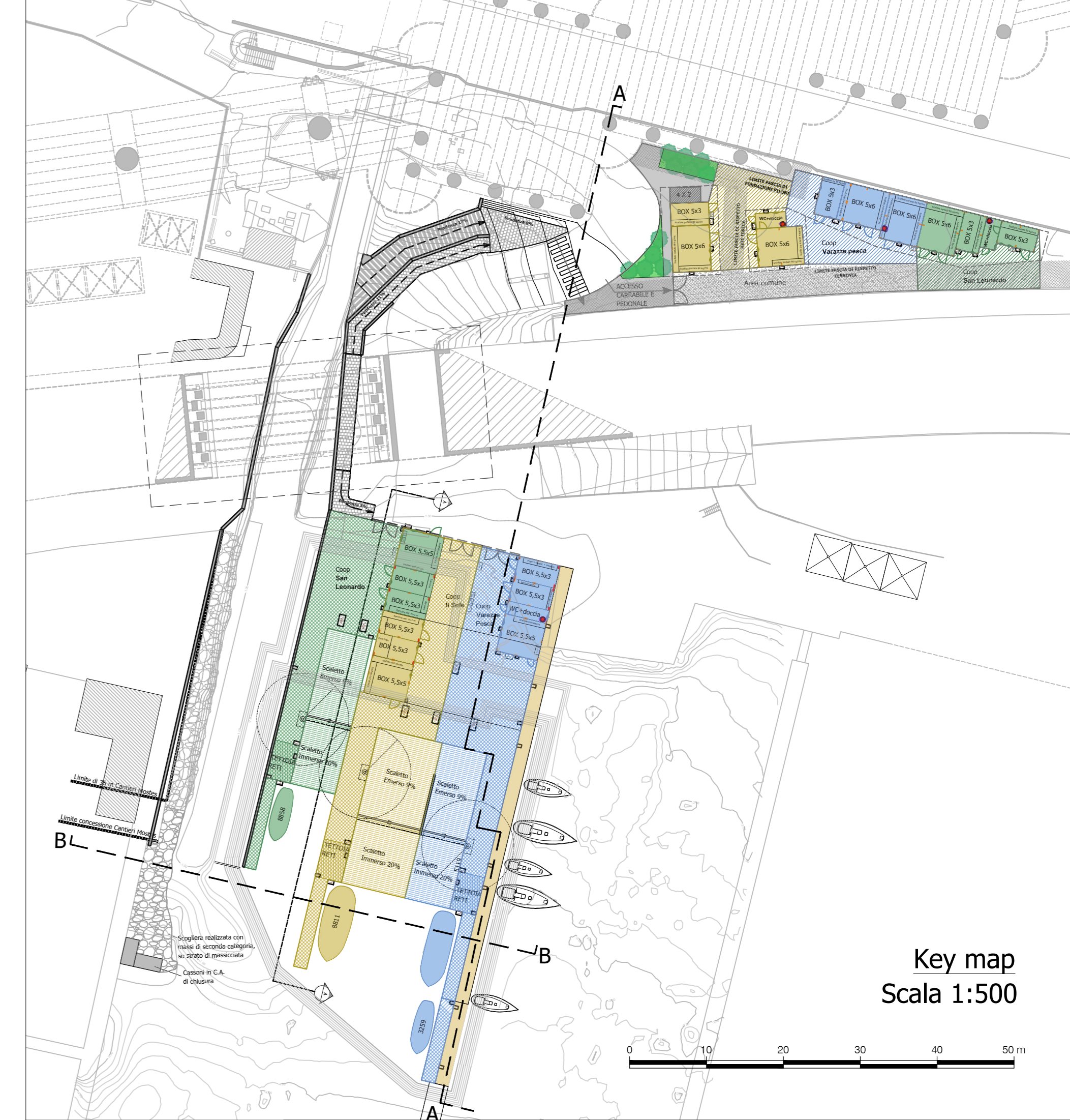
Key map Scala 1:500