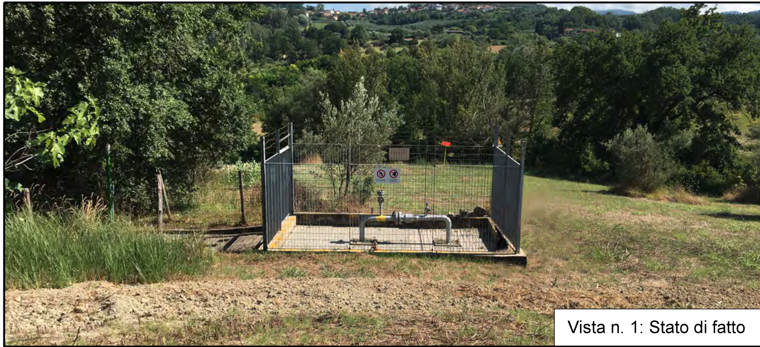
Vista n. 1: Stato di fatto