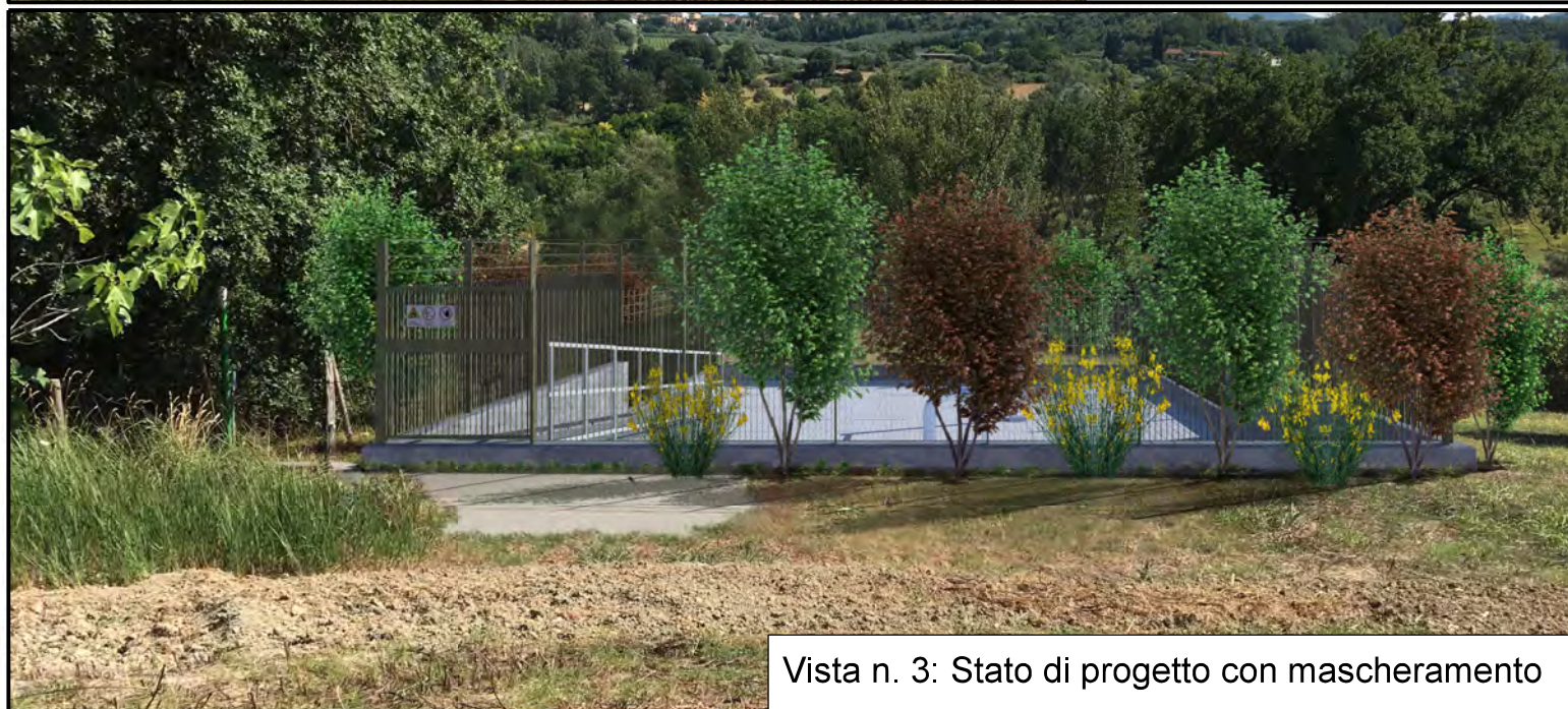
Vista n. 3: Stato di progetto con mascheramento