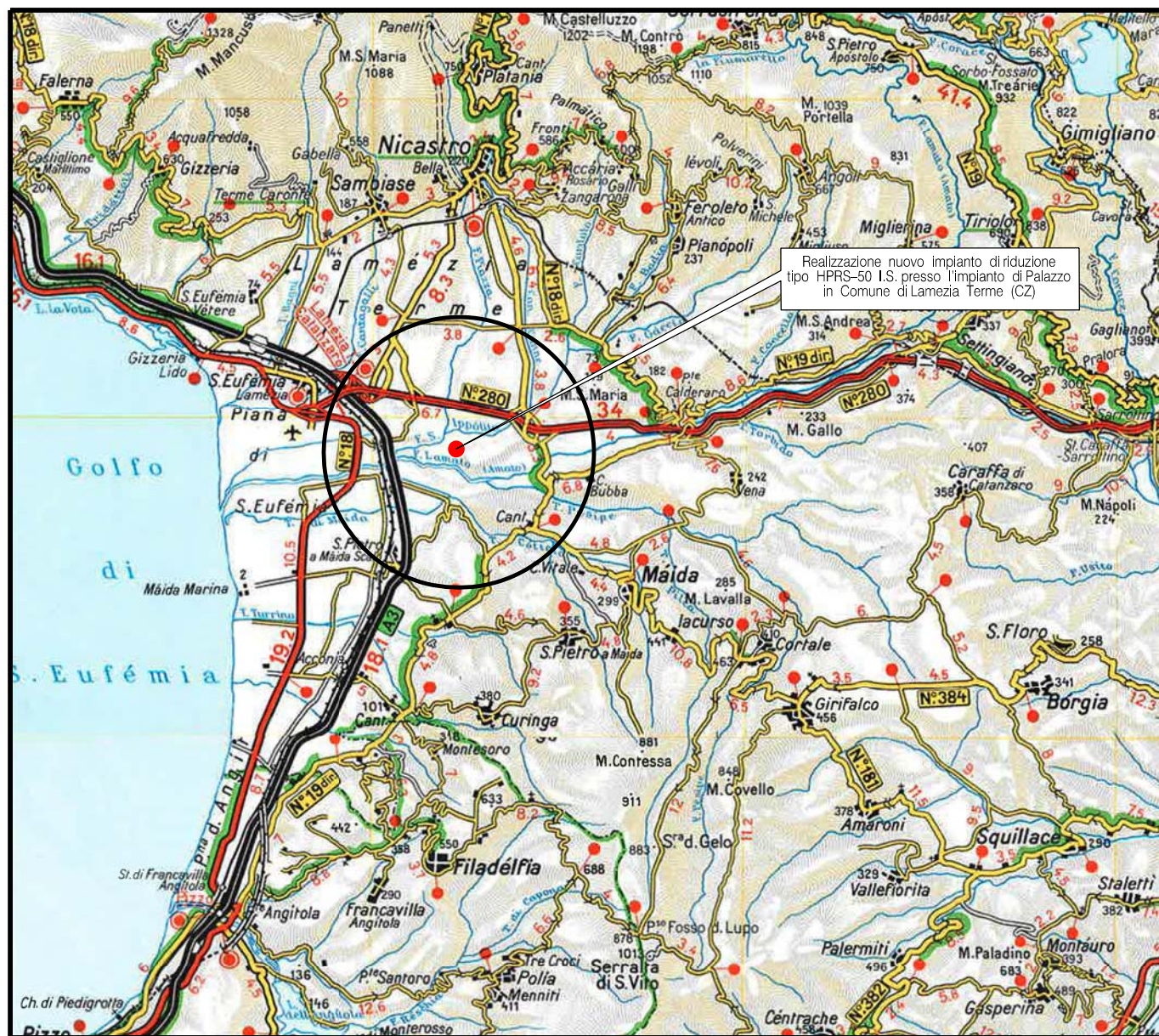
COROGRAFIA Scala 1:200.000