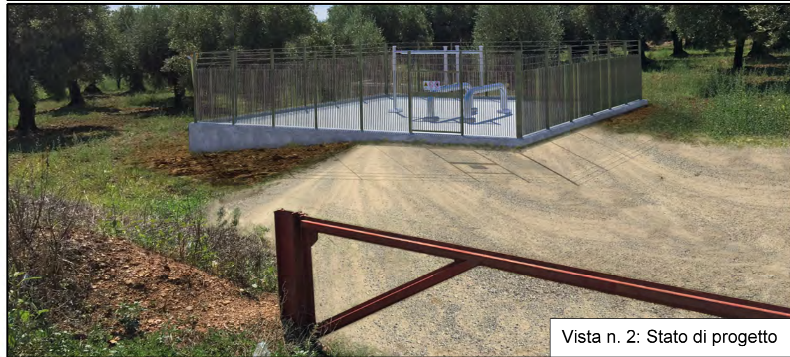
Vista n. 2: Stato di progetto