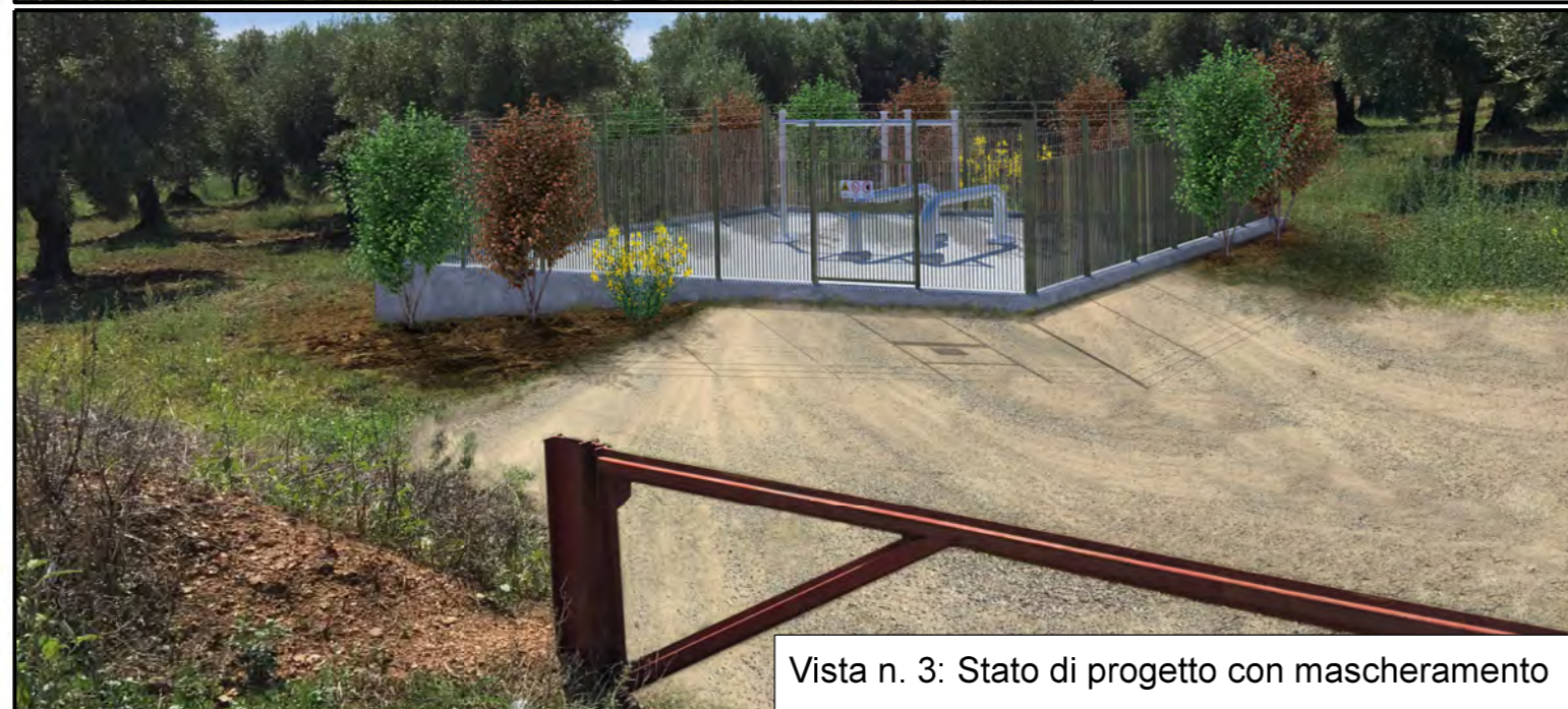
Vista n. 3: Stato di progetto con mascheramento