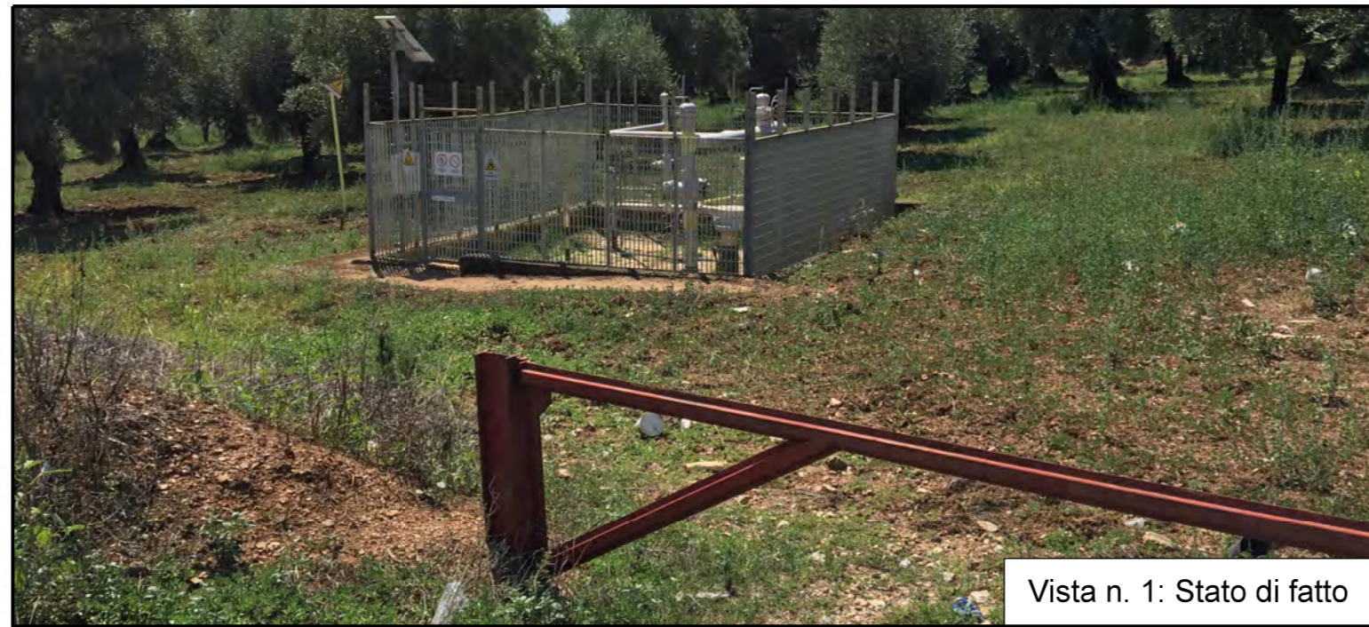
Vista n. 1: Stato di fatto