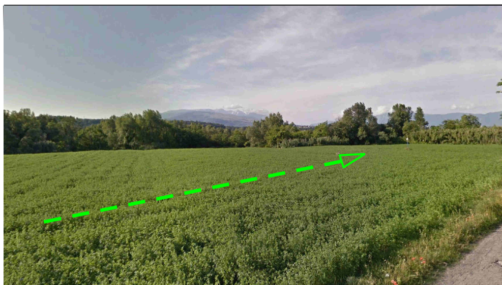
Percorrenza metanodotto esistente su area agricola, stato attuale