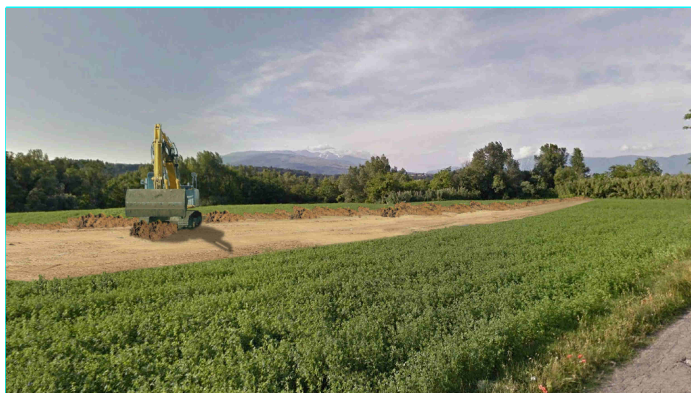
Fotosimulazione apertura area di passaggio su aree agricole