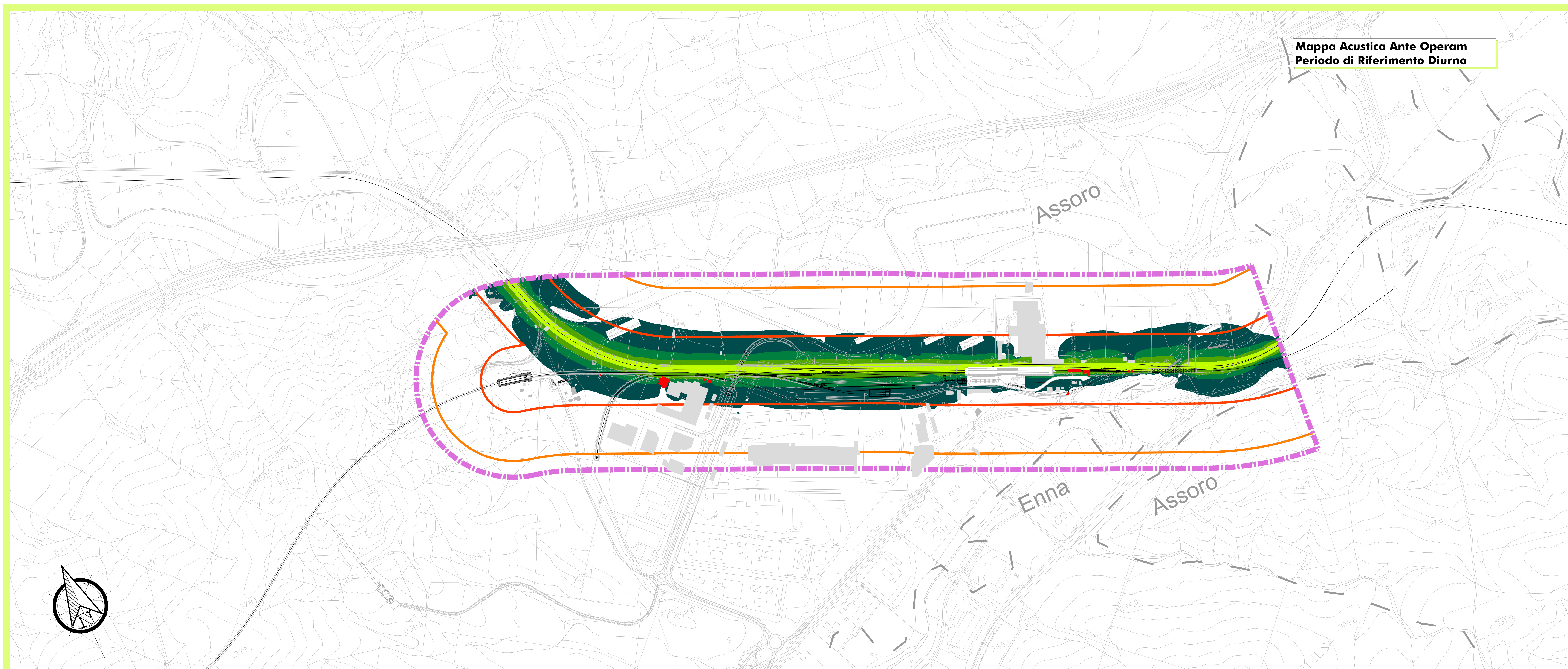
Mappa Acustica Ante Operam Periodo di Riferimento Diurno