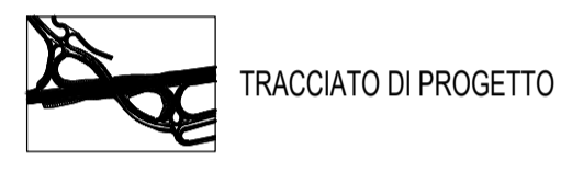
TRACCIATO DI PROGETTO