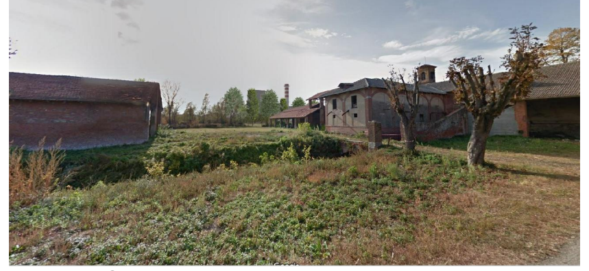
vista B ● Stato di progetto mitigato