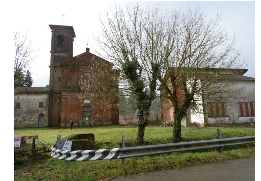
vista 3 ● Stato di progetto mitigato