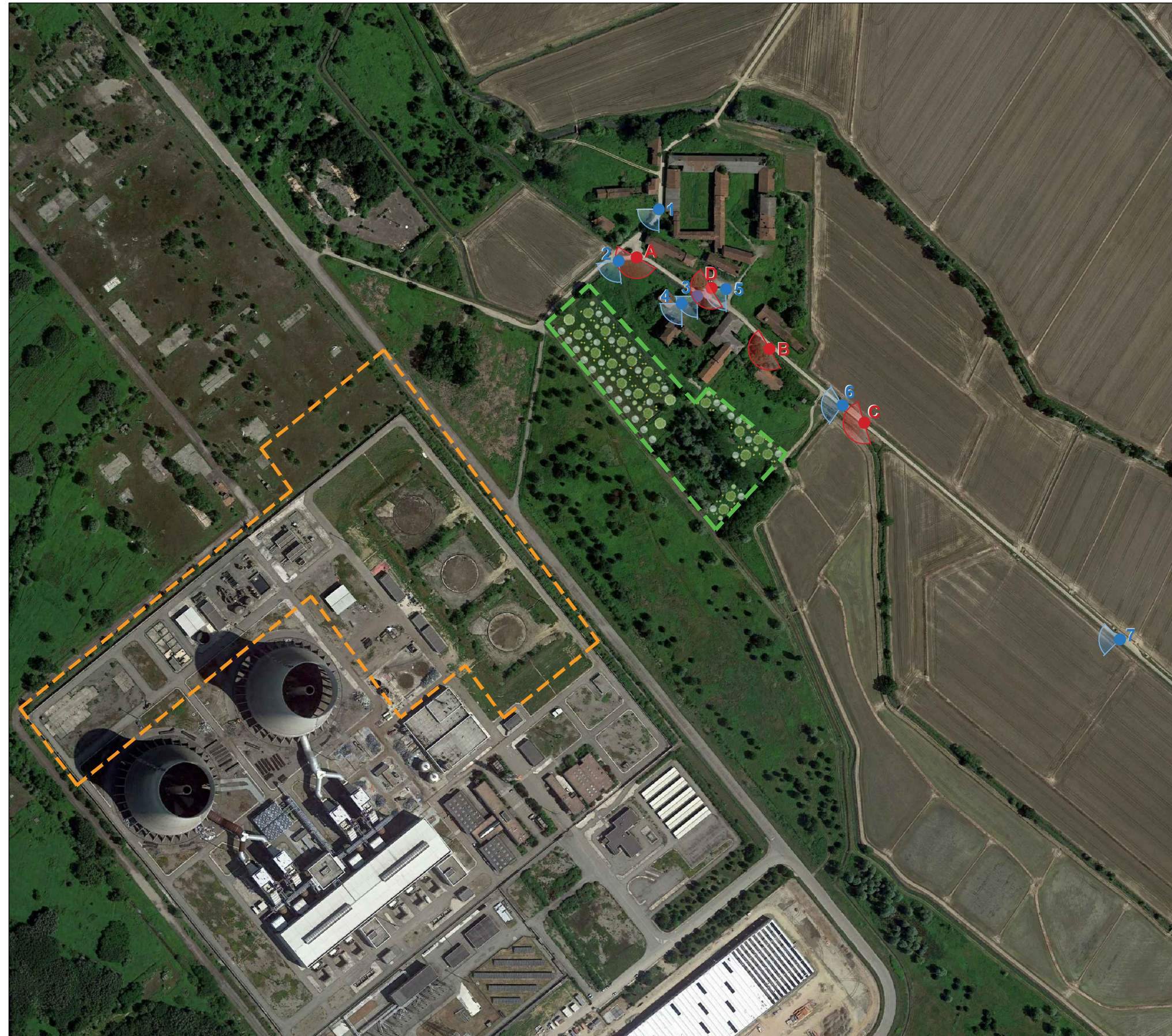
Individuazione dei punti di vista