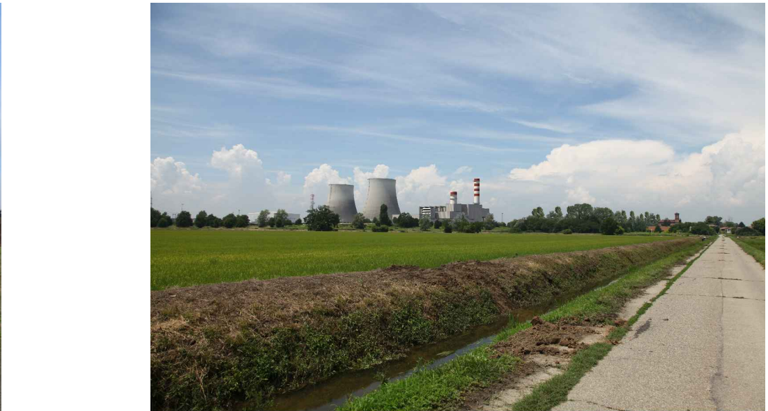
vista 7 ● Stato di progetto mitigato