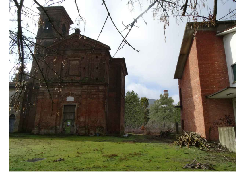
vista 4 ● Stato di progetto mitigato