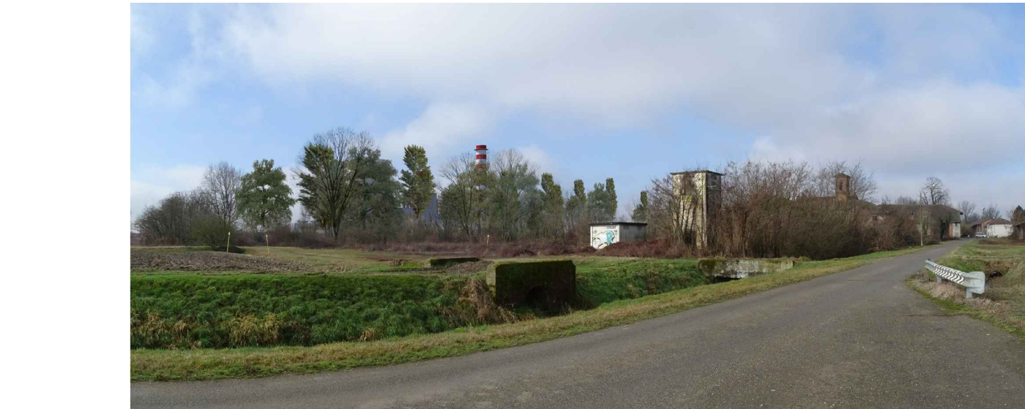
vista 6 ● Stato di progetto mitigato