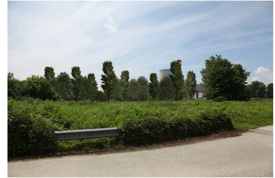
vista 2 ● Stato di progetto mitigato