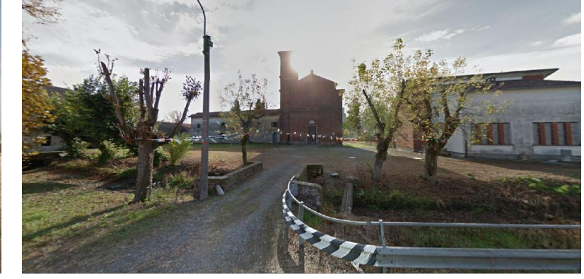
vista D ● Stato di progetto mitigato