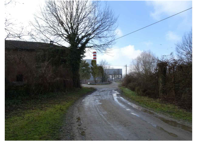
vista 1 ● Stato di progetto mitigato