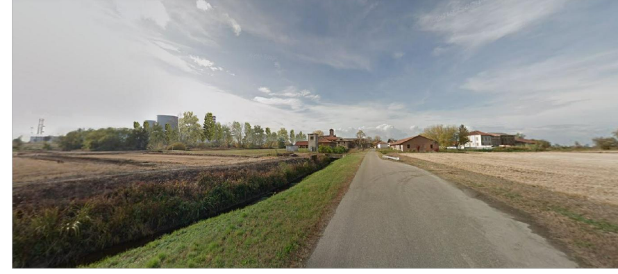
vista C ● Stato di progetto mitigato