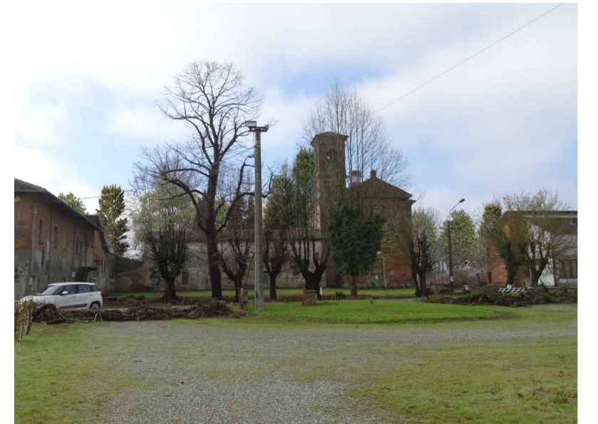
vista 5 ● Stato di progetto mitigato