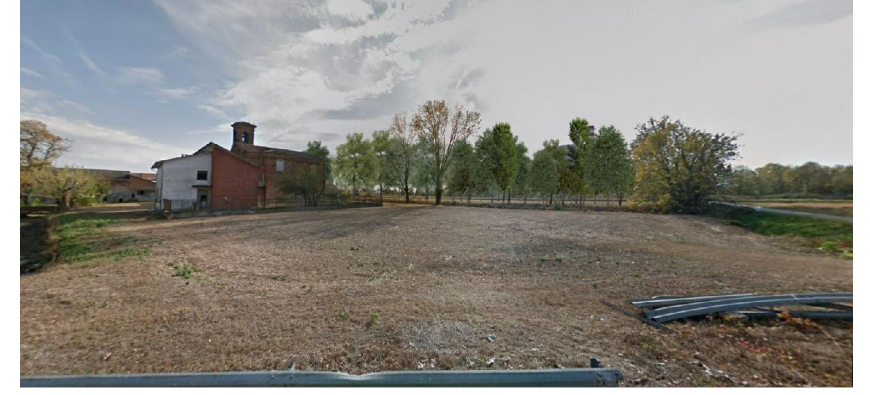
vista A ● Stato di progetto mitigato