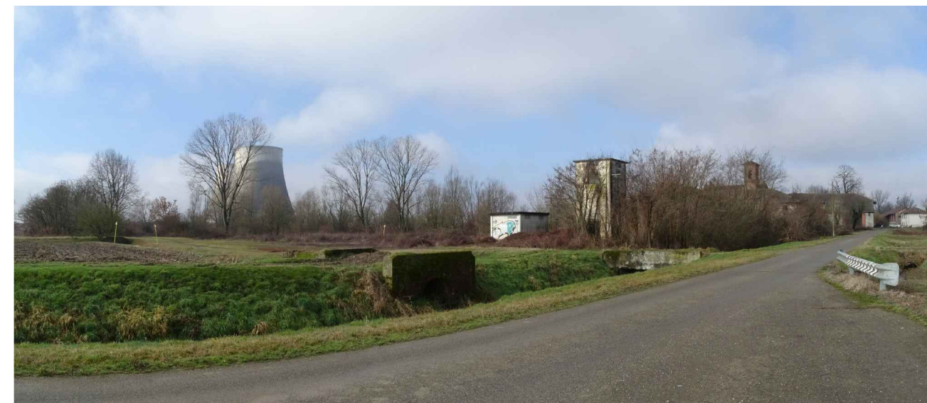
vista 6 ● Stato di fatto