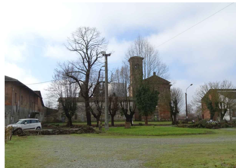
vista 5 ● Stato di fatto