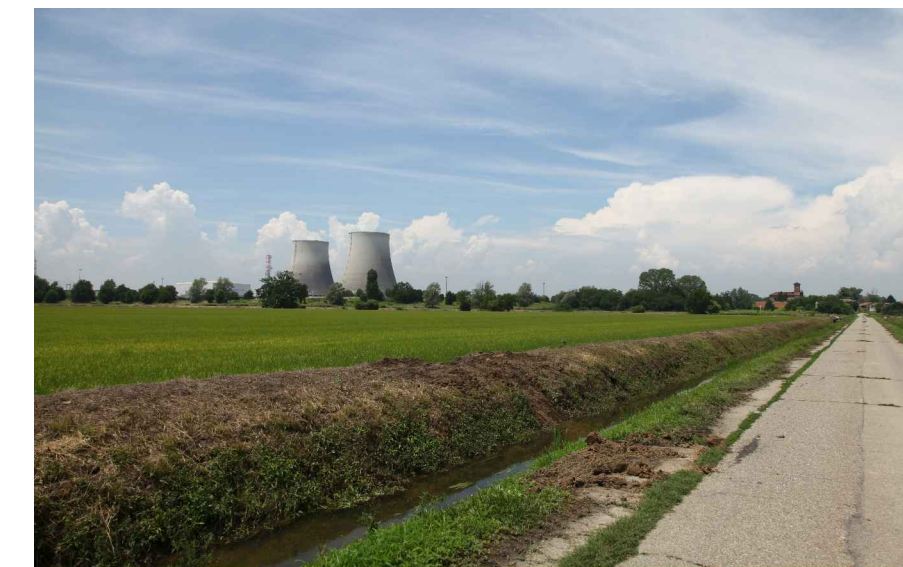
vista 7 ● Stato di fatto