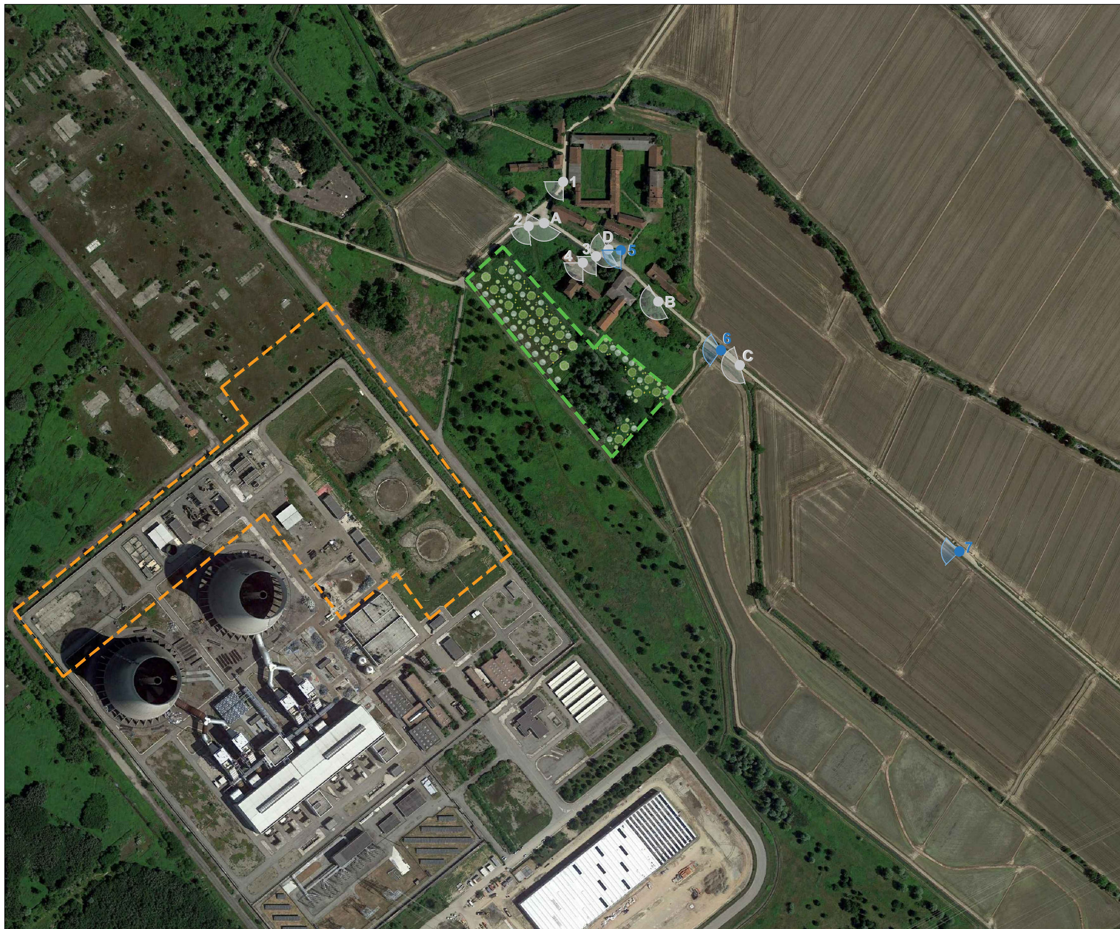
Individuazione dei punti di vista