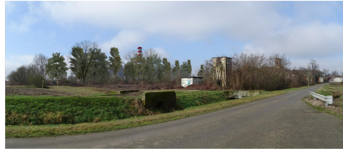
vista 6 ● Stato di progetto mitigato