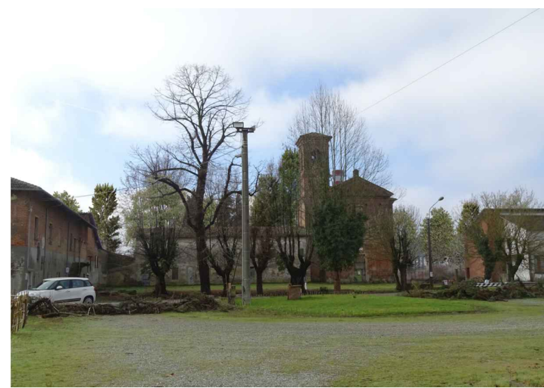
vista 5 ● Stato di progetto mitigato