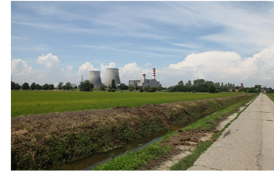
vista 7 ● Stato di progetto mitigato