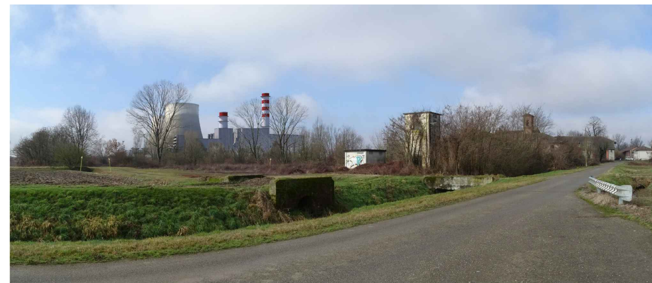
vista 6 ● Stato di progetto