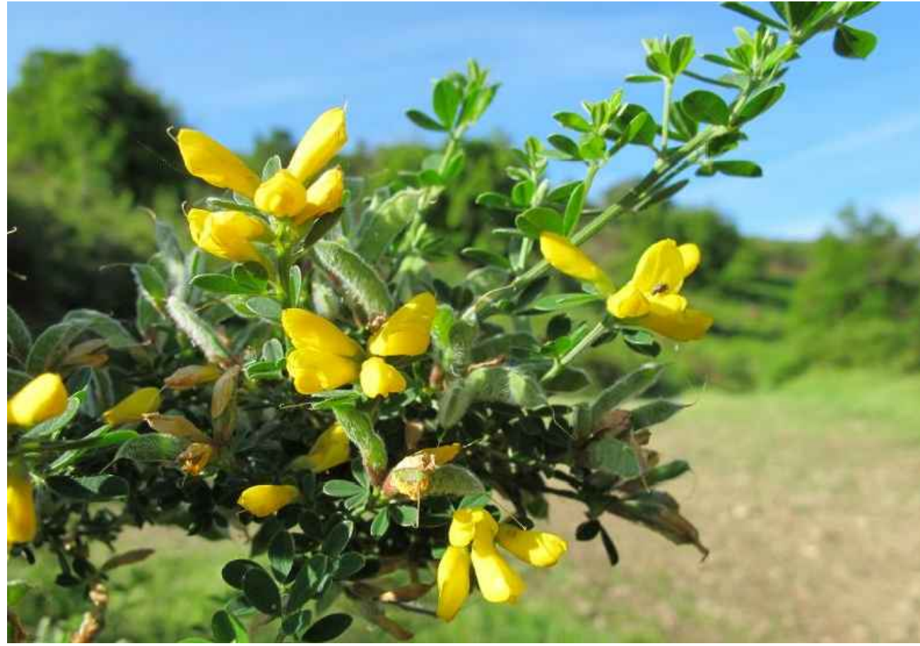
SPECIE ARBOREA AUTOCTONA (CYTISUS VILLOSUS O SIMILARI)