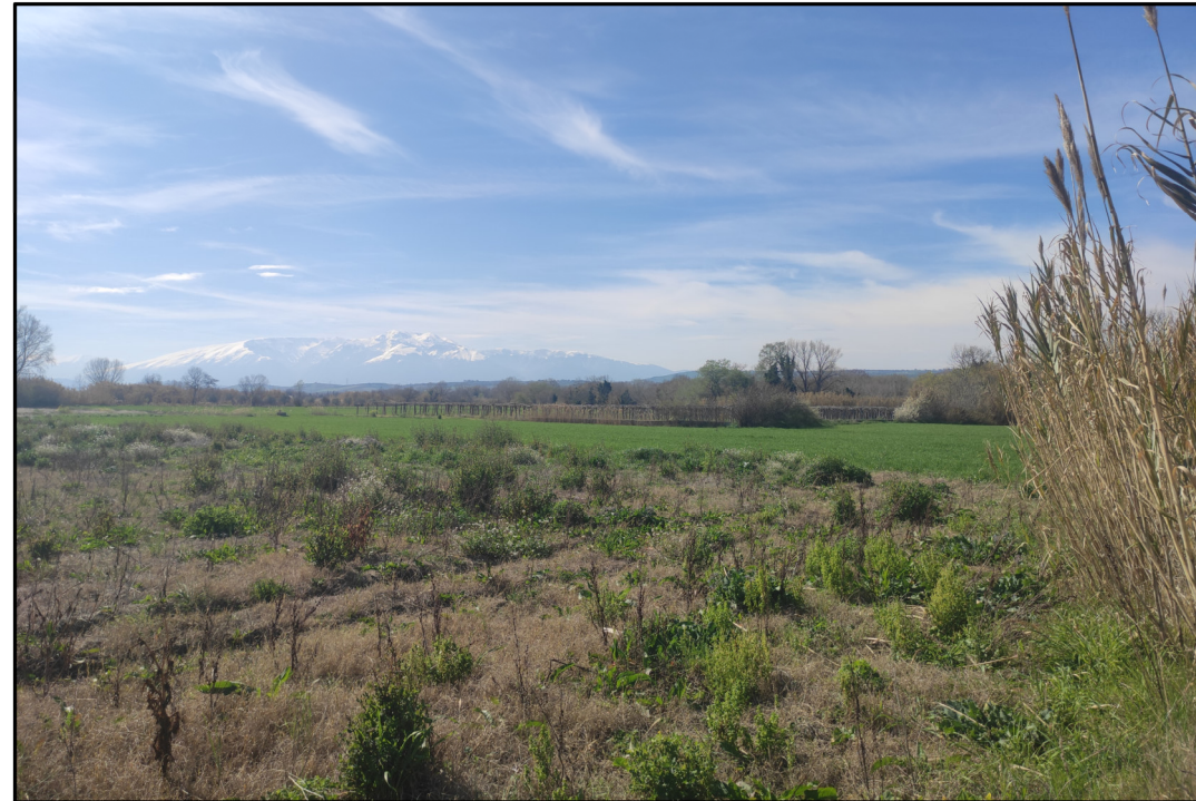
VISTA 1: STATO DI FATTO