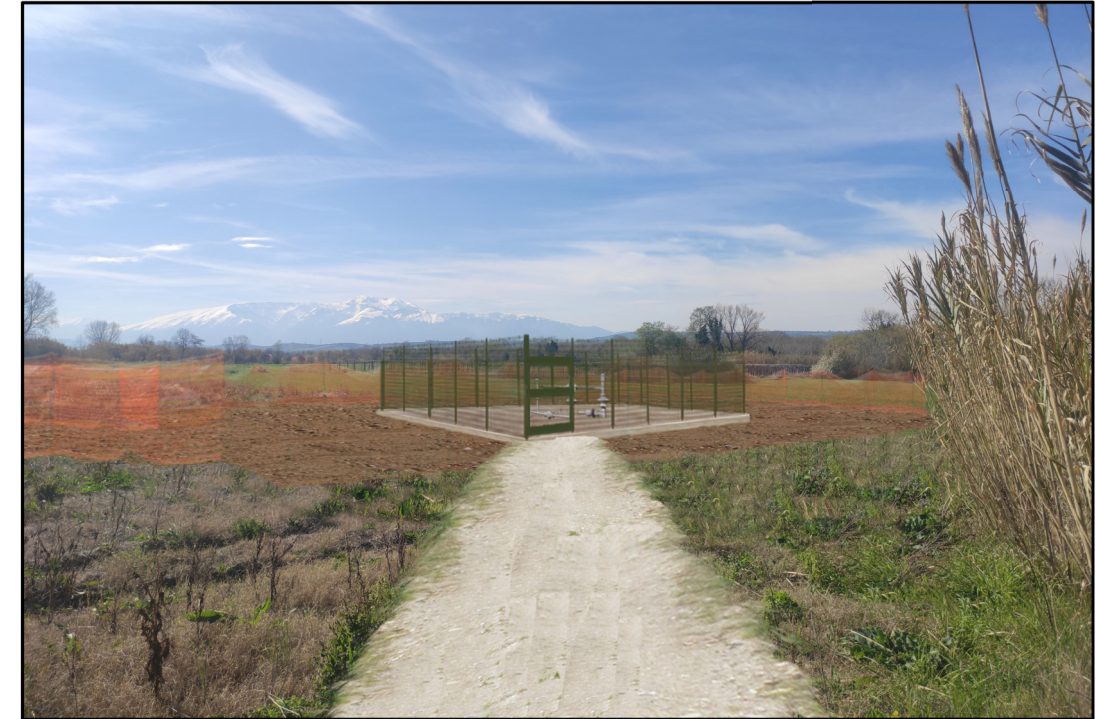
VISTA 2: STATO DI PROGETTO IN CORSO D'OPERA