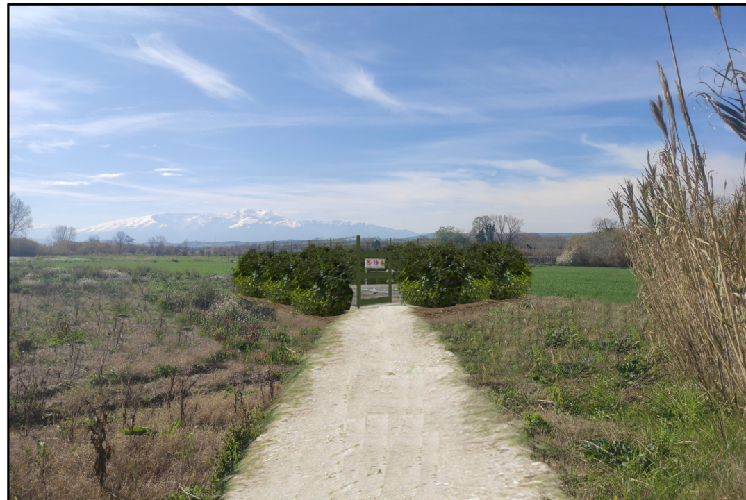
VISTA 3: STATO DI PROGETTO CON MASCHERAMENTO