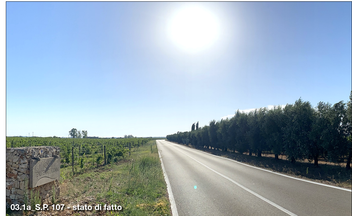
03.1a S.P. 107 - stato di fatto