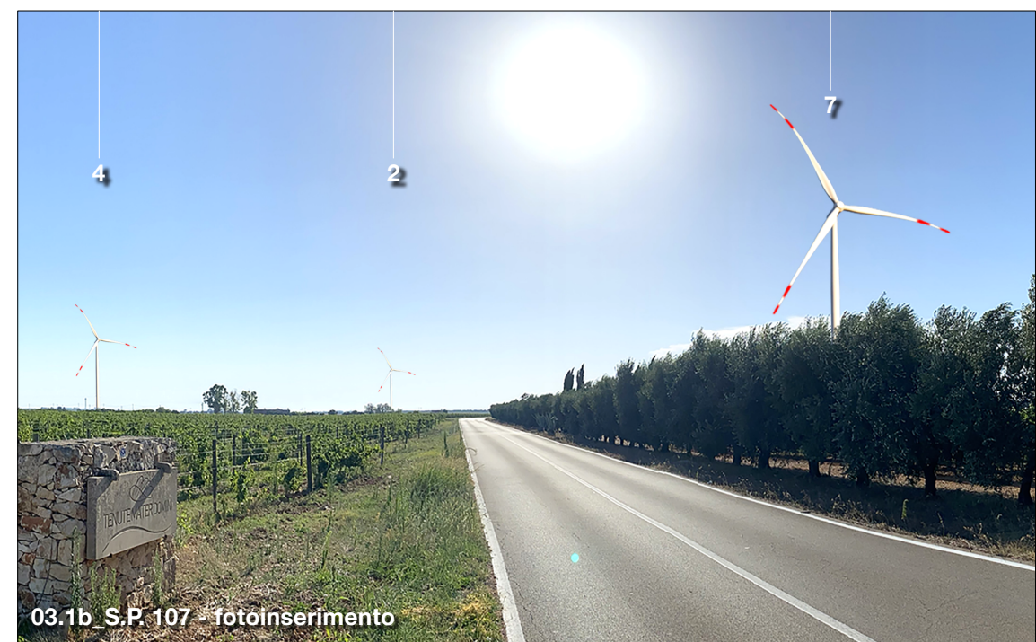
03.1b S.P. 107 - fotoinserimento