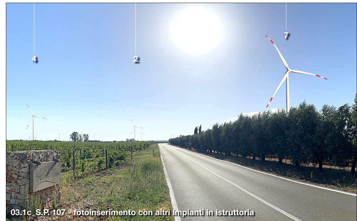
03.1c S.P. 107 - fotoinserimento con altri impianti in istruttoria